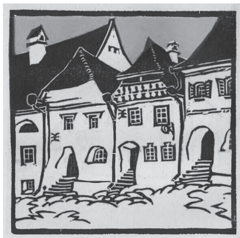
Kós Károly: Segesvári házsor

A tévedés kockázata nélkül kijelenthető, hogy e 19. század végi, még a „magyar időkből” származó tapasztalatok 1918 után, az impériumváltást követően is éreztették hatásukat. Feltétlen ennek tudhatunk be olyan jelenségeket, illetve magatartásformákat, mint a felszín alatti tudatos építkezés, a kisebbségi létből fakadó kooperációs kényszer az országos politikában, vagy épp a hatalomgyakorló többségi nemzet kormányzó erejének támogatása a sok jót nem ígérő opponálással szemben. Ezek olyan túlélési stratégiák, amelyeket a megalakuló Nagy-Románia németisége bizonyíthatóan 1918 előttről hozott magával. Az átörökített