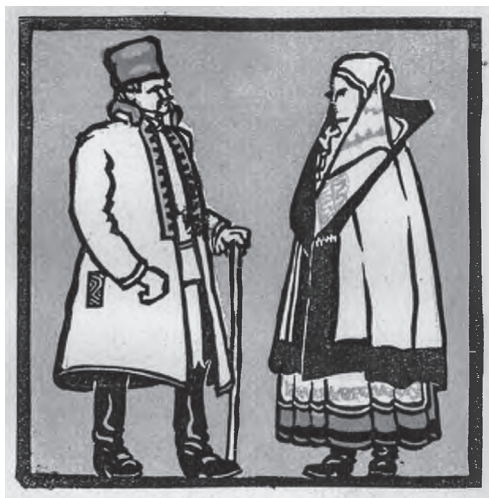
Kós Károly: Szász népviselet

Ennek természetesen ugyanúgy semmi alapja nem volt, mint a német kultúrkör egészében mai napig ismeretes mondai elemnek a hamelni