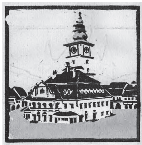
Kós Károly: Brassó, városháza

A szászok e stratégiájáról tudósítva a Neue Post idézi a Siebenbürgisch-Deutsches Tageblatt 1919. január 10-i számában megjelent gondolatokat: „Lépjünk rá immáron teljes szívvel a választott útra. Váljunk részévé teljes belső meggyőződéssel ama új állam életének és eszmeiségének, amelyhez mostantól tartozunk. Ne hátrafelé tekintünk, azokra az időkre és viszonyokra, melyek számunkra elmúltak, hanem fordítsuk tekintetünket a jövő felé. Új hazánk, Románia iránt az aggályokat mellőzve valljuk meg azt a hűséget, amit idáig a régi hazánk iránt mutattunk. A szász nép e hűségfogadalmát a román állam iránt azon a napon tette meg, amikor kimondta csatlakozását a román királysághoz. A szász nép döntése, hogy csatlakozik Nagy-Romániához, szabad elhatározásból született. Ezáltal kifejezésre juttattuk