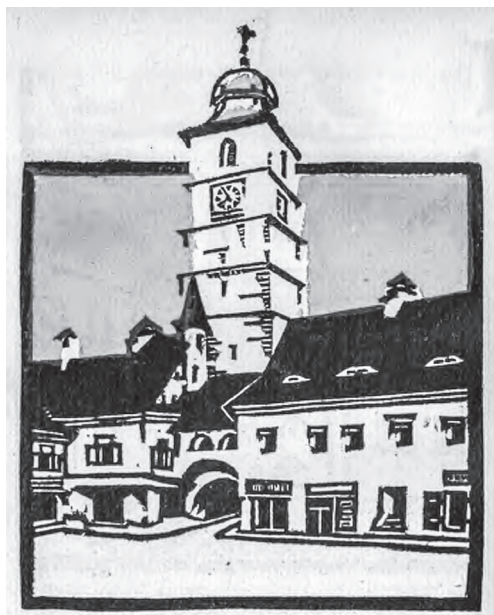
Kós Károly: Székesfehérvári városterület

Ami később is megkülönböztette és kiemelte az erdélyi szász településterületet a fejedelmi korszak után Guberniumként továbbra is a királyi Magyarországtól elkülönítve kormányzott tartomány többi részétől, az a vitathatatlan gazdasági fejlettség s a vele járó jólét, valamint a kulturális nívv emelkedettsége a többi, velük együtt élő nemzeti-etnikai közösséghez képest.