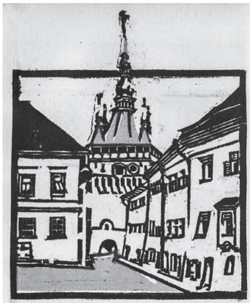
Kós Károly: Segesvár

Korrigálnunk kell azt a „városlakó szászokkal” kapcsolatos sztereotípiát is, miszerint városi életmódjukat és városépítő buzgalmukat még „otthonról” hozták magukkal az első telepesek. Valójában azok földművesek voltak (épp a frank közösségi törvénykezés gyakorlata írja elő, hogy mindenki egyenlő nagyságú földterületet kap művelésre a közösségi vagyonból; ezt és az erős közösségi gondolkodást ültetik át a betelepedők), s csak a tatárjárás negatív élménye készítette őket a biztonságos falakkal körülvett városi közösségek, netán kisebb léptékű falusi erődtemplomok létesítésére. Maga IV. Béla, aki központilag is ösztönözte e törekvéseket, panasolta a pápának, hogy meglátása szerint csak a szászok körében találnak megértő fülekre városalapítási felszólításai. E keletkező városok belső életének szabályozása fonódik aztán össze a szász jogrend alkalmazásával. Olyannyira, hogy egymást követő királyaink az általuk privilégiumokkal ellátott szabad királyi városokat is többnyire a Sachsenspiegel ( Szász tükör ) rendelkezései szerint működtették; a Zsigmond király idején keletkezett Budai jogkönyv nek egyes fejezetei például szóról szóra megegyeznek a magdeburgi (szász) joggal. Az erdélyi szász településterület általános és egységes elvek szerint korszerűsített (a környező magyarság gyakorlatától végképp elkülönült) jogrendje az Erdélyi Fejedelemség időszakában születik majd meg ( Statuta der Sachsen in Siebenbürgen oder eygen Landtrecht ; Báthori István fejedelem hagyja jóvá