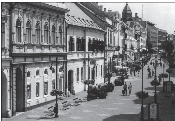
A Fő utca az 1990-es évek végén

A Fő utca közepén van például egy elegáns, modern, kőburkolatos Bauhaus-