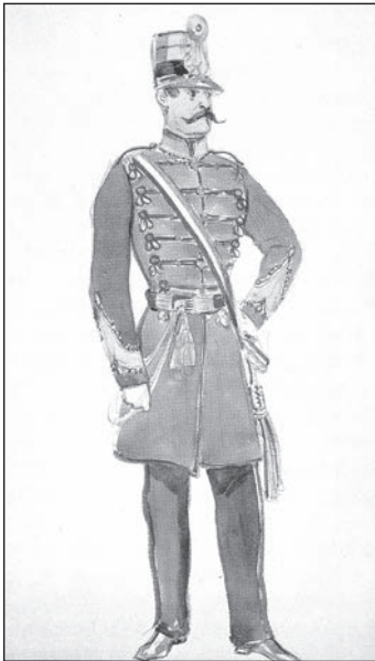
Honvéd törzstiszt (Domonkos Imre rajza)

Petőfi, mint szolgálatát nem teljesítő százados, Debrecenben élt családjával. December 24-én pedig az alábbi levelet intézte Kossuth Lajoshoz az alföldi városból: „Tisztelt Polgártárs!