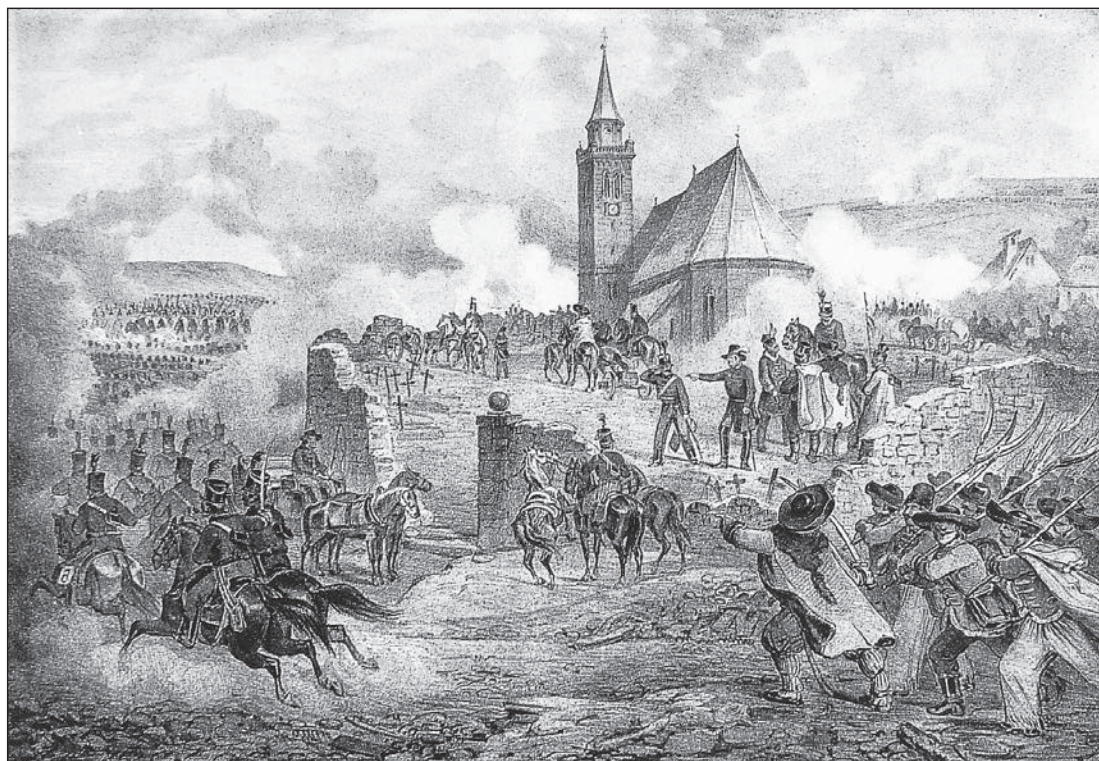
Bem tábora Szászsebesnél

A szabadságharc költője 1849. július 31-én hősi halált halt a segesvári ütközetben.