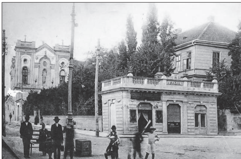
Kaposvár, Zárda utca 23.