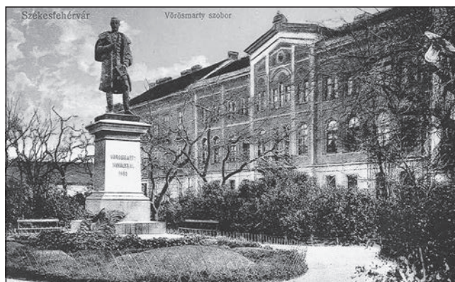
Vörösmarty szobor, Székesfehérvár

Ugyancsak alig egy évvel a Kisfaludy-szobor avatása után, 1861. szeptember 14-én megnyílt a Budai Népszínház. A homlokzatán olvasható szöveg – „Hazafiság a nemzetiségnek” – felidézte az 1830-ban megnyílt balatonfüredi színház emlékét is, amelynek homlokzatára Kisfaludy Sándor, a költő, mecénás, színházvezető vésette e szavakat. A színház magyar nyelvű színházként erősíteni szándékozott a magyar nemzeti színjátszás ügyét. A mecénás Apraxin Júlia, az alapító-színigazgató Molnár György volt.