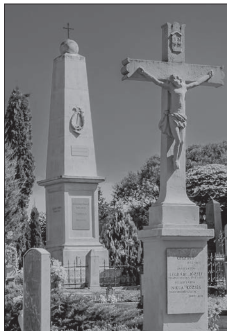
A Berzsényi-emlékmű Niklán