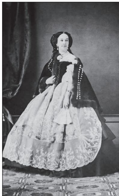
Főúri hölgy magyar öltözékben

Fordulatos életútját másutt már ismertettem (KOVÁCS, 2009; KOVÁCS, 2013b.),