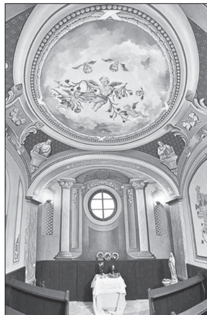
7. kép. A Csák–Pongrácz-kúria egykori Szent Kereszt-kápolnája napjainkban