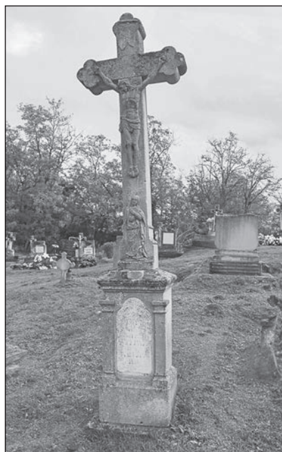
9. kép. A temetői Szabó-kereszt