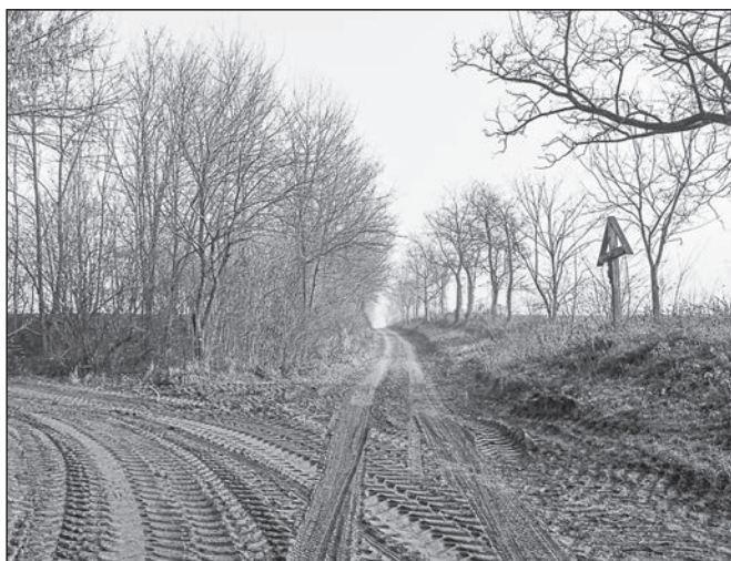
11. kép. A Pléhjézus

Legvégül a bálintmajori mezőgazdasági úton, az Újfalú felé leágazó dűlőút kereszteződésénél, az egykori Kula-hídnál áll egy 3 méter magas gerendakereszt, rajta a megfeszített Krisztus fémöntvény figurájával (11. kép). A falubeliek Pléhjézus néven