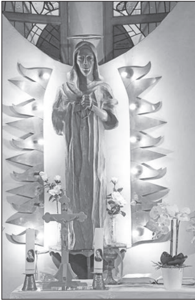
5. kép. A templom oltárának szobordíszje