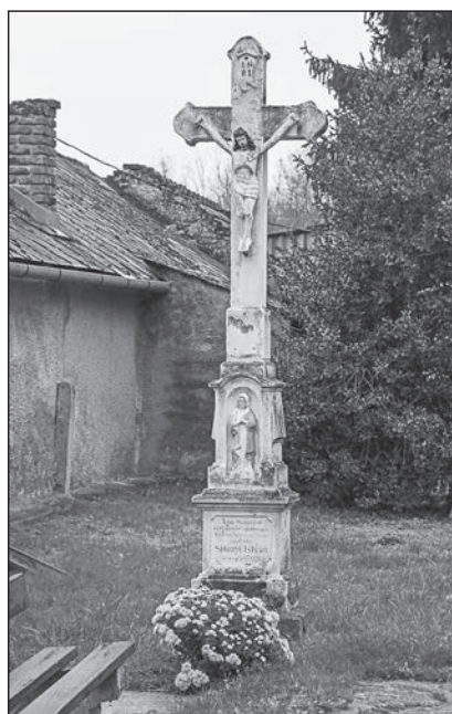
10. kép. A Sóttonyi-kereszt