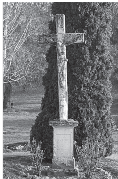
8. kép. A Nagy-kereszt