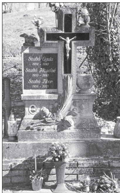
12. kép. Tipikus keresztet formázó sírjel feszülettel, pálmaággal, rózsakoszorúval és galambfigurával

térdre ereszkedve imádkozó angyalt ábrázol.