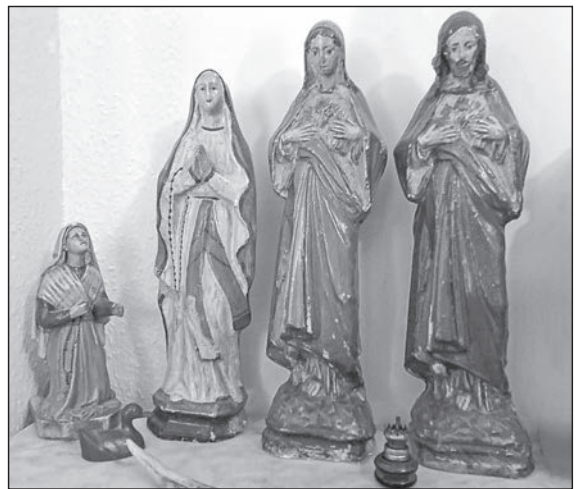
6. kép. Az egykori iskolakápolnából megmentett szobrok, Lourdes-i Szűzanya Szent Bernadettel, Mária Szeplőtelen Szíve és Jézus Szíve egy csombárdi otthonban