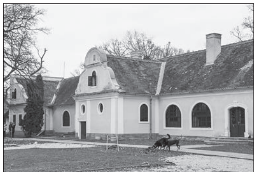
1. kép. A Csák–Pongrácz-kúria nyugati homlokzata, a közepízalít rejti a kápolnát