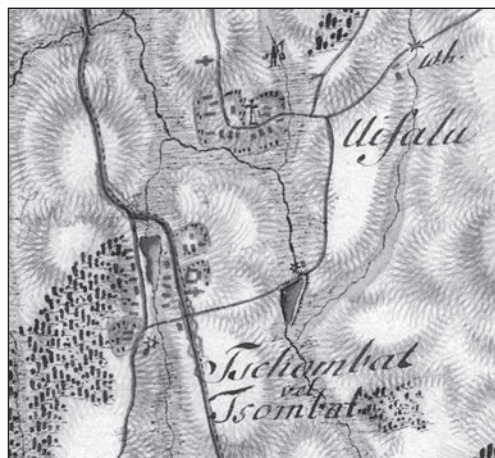
2. kép. Csombárd és Újfalu „kőtemplomai” az első katonai felmérés térképén