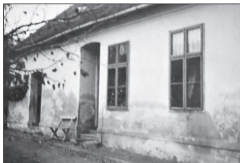
3. kép. A katolikus népiskola épülete, talán az 1940-es években ( Historia domus , 90.)

A régi iskolakápolnát végül az 1990-es évek elején elbontották, és helyén felépült a csombárdiak első állandó kőtemploma. A Domonkos Béla tervei alapján, önkormányzati, egyházmegyei és közösségi finanszírozással készülő istenháza alapkövét 1993. március 25-én tették le, és alig fél év elteltével, 1993. október 10-én Balás Béla kaposvári püspök már fel is szentelte az organikus stílusú templomot (4. kép). Titulusa a helyi hagyomány továbbéléseként Magyarok Nagyasszonya lett. (RÁDICS 1993, 4.; RÁDICS 1997, 4.)