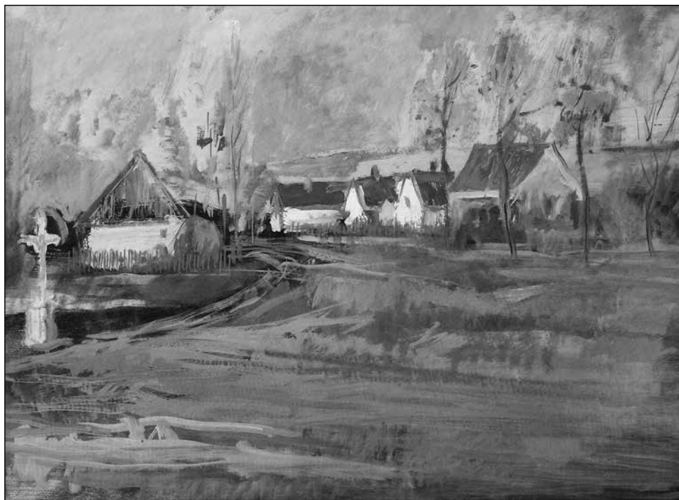
Czinkotay Frigyes: Faluvége útszéli kereszttel