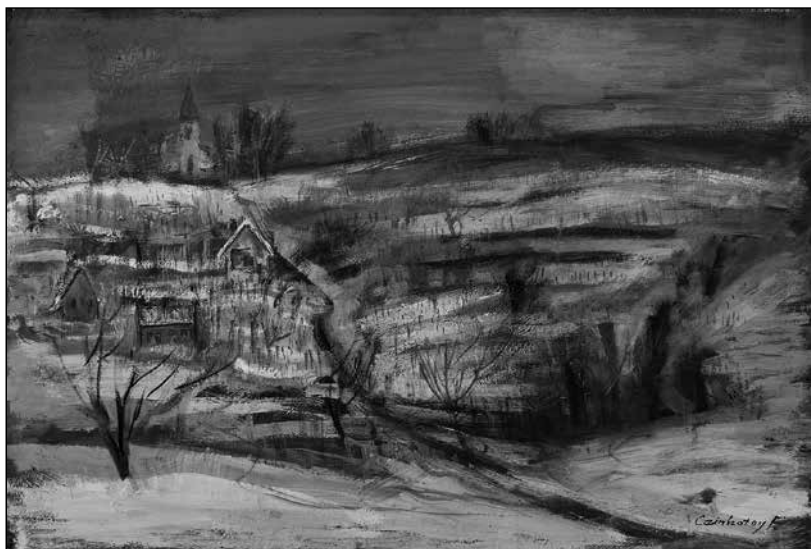
Czinkotay Frigyes: Nyugativánfa télen

Közös fedél alatt engedelmesen ég valami bennem. Letöredezett reményeim széttört cseréptálként ragasztom. Beleégett minden kérdés és indulat. Az időben minden olyan színtelen lett, mint a régi fényképek. A pillanat elhozott egy lehetőséget, aztán már nem tettem semmit. Úgy néztem, mintha mindent láttam volna. Imbolyogtam, mint árnyék a falon. Néma vita végső következtetése, hogy kihallgattad gondolataim.