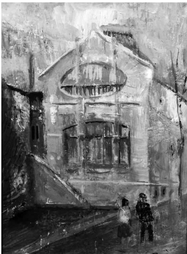
Czinkotay Frigyes: Kaposvári TIT Székház 3.