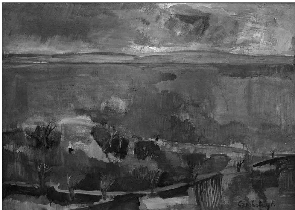
Czinkotay Frigyes: Borús Balaton