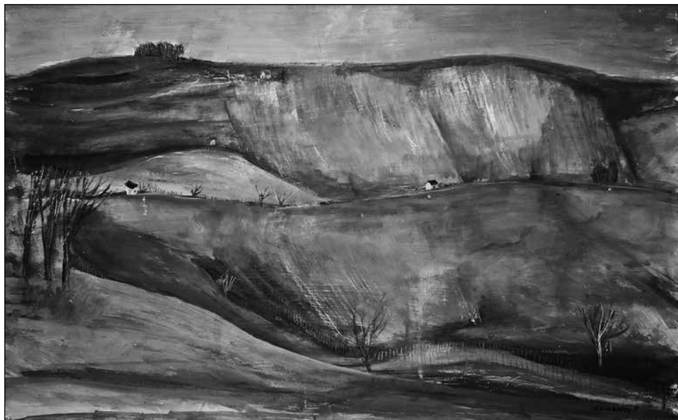
Czinkotay Frigyes: Őszi Ivánfa