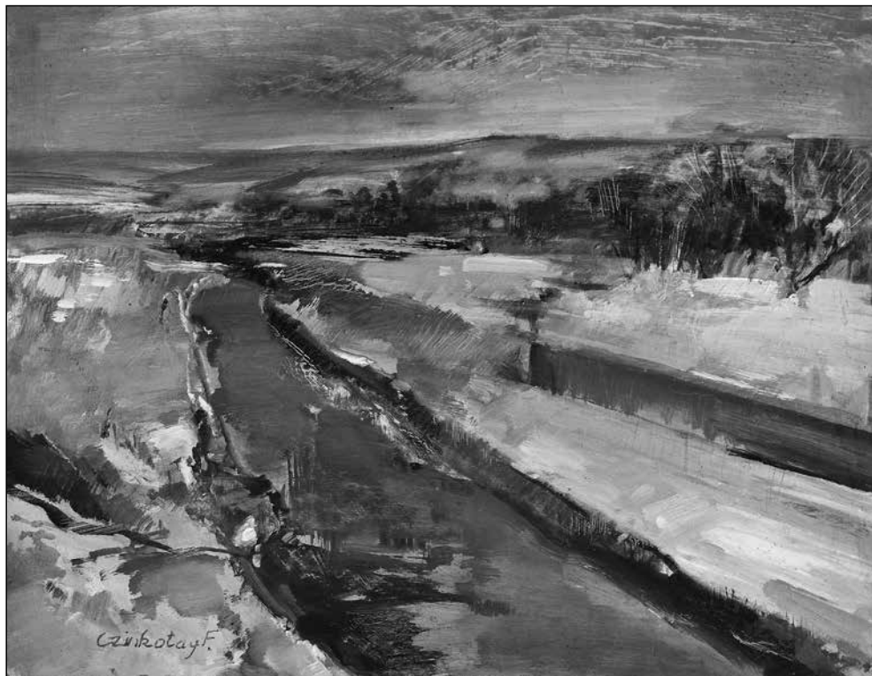
Czinkotay Frigyes: Kapos part

tanulmánya alapos részletességgel mutatja be Szittyay Dénes életét. Ugyanilyen megbízhatósággal kapunk képet Shvoy Lajosról, a Szittyay-ügy részleteiről, a sajtóban megjelent összefüggésekről. Feltűnő – és egyben üdvözlendő –, hogy a szerző került a morális értéktétel kinyilvánítását Szittyay Dénes esetében. Az olvasó a tények ismeretével és a források elolvasásával megteheti, hogy a könyv forgatása közben behelyezkedik a Rákosi-féle diktatúra üldözött és gondterhelt egyházi életébe oly módon, hogy a kommunista hatalommal rokonszenvező plébános életének kellős közepébe kerül.