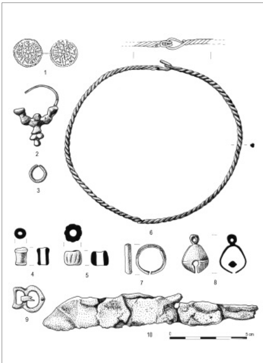
4. ábra: Válogatás a soros temető emlékanyagából (Rajz: Mátyus M.)