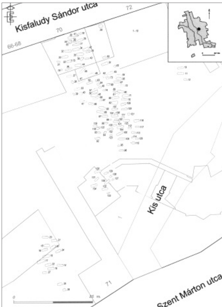
1. ábra: A szombathelyi Kisfaludy Sándor utcai temető feltárt sírjai