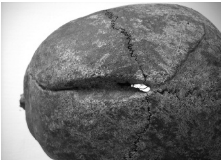
1. ábra: Túlélte koponyasérülés (Vasvár, Domonkos kolostor 54. sír, 25-35 éves férfi)