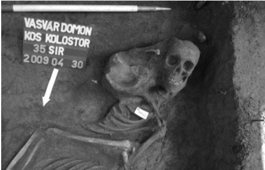
3. ábra: Templomkörüli temetkezés sírja (Vasvár, Domonkos kolostor 35. sír, 18-20 éves férfi)

felvetésnek az igazolása vagy elvetése, hogy esetleg vallási-etnikai alapon döntötték-e el, hogy ki melyik temetőbe temetkezzen. A templomkörüli Árpád-kori sírok hiányos-töredékes embertani anyaga (a temetőt az I. századtól a XX. század második feléig folyamatosan használták) alapján az eddigi vizsgálati eredmények még nem