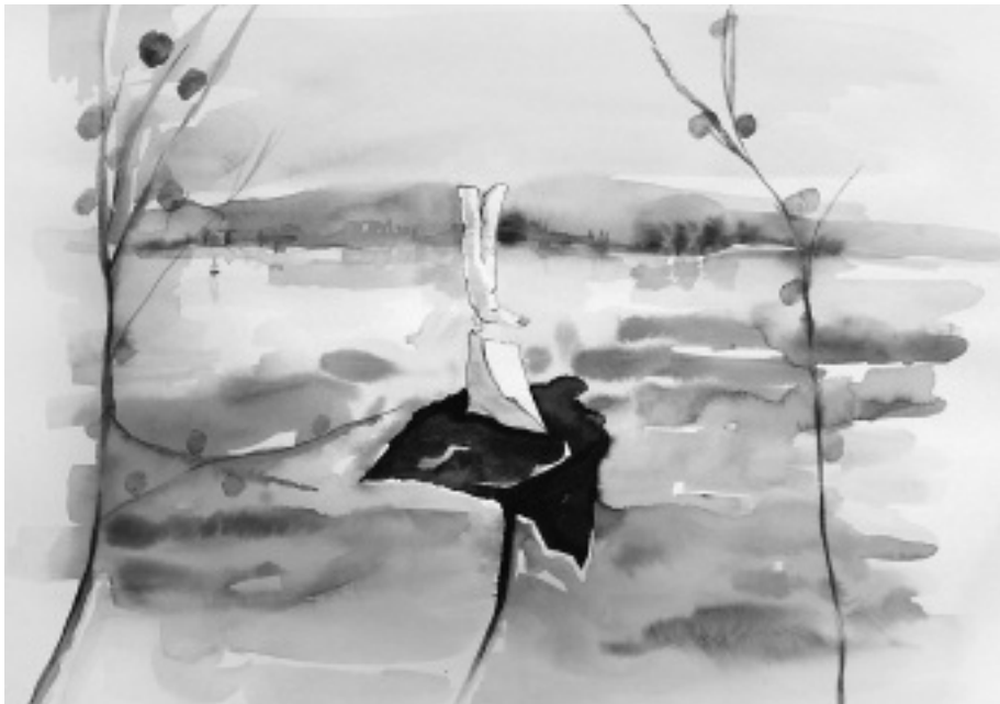
Magányos nyúl úr