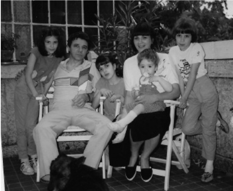
Családi körben a nyolcvanas évek végén

Én annak ellenére, hogy a Bertalan utcai szerkesztőség előtt reggel nyolctól este nyolcig ott állt egy belügyminisztériumi autó feltűnő lehallgató-készülékekkel, s hogy