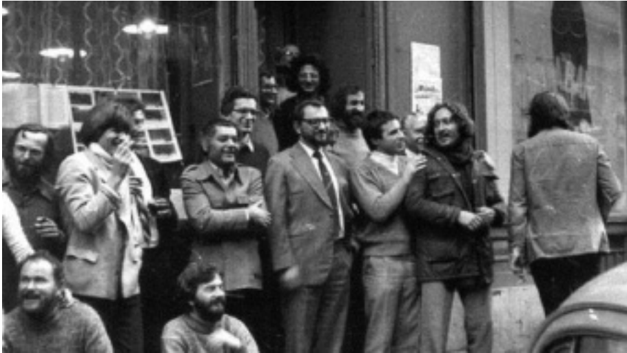
Búcsúzik a Mozgó Világ

– Lényegesen kevesebb, mint amit gondolnak róla. Örülök, hogy fölvetette, tudniillik erről nekem van egy, most már külön-bejáratúnak mondható tapasztalatom. Annak ellenére, hogy nekünk az Antall-kormány hivatalba lépésének napjaitól tudomásul kellett vennünk – ha csak egy nagyon szűk körben is, tehát az elnökségen belül – hogy a 165 MDF-es képviselő között 13 ügynök van. Horn Gyula e tekintetben