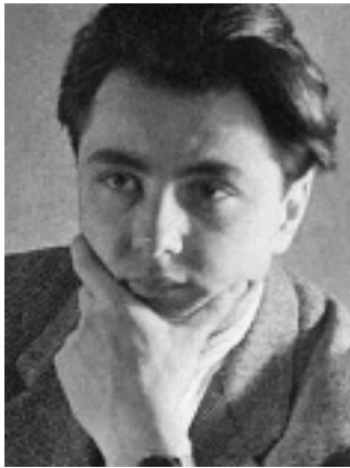
A szerző (1948)