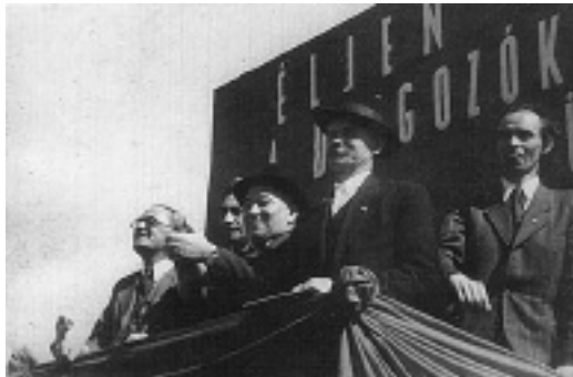
1946. május 1.

A vonat Pilsenben valamennyit állt. A restiben igazi pilseni sört ihattunk (fogalmam sincsen, hogy mivel fizettünk). Prágán éjjel haladtunk át, nem láttunk belőle semmit. Ha ma nézem a térképet, hihetetlen, hogy milyen kerülővel utaztunk, de úgy látszik másfelé még nem volt közlekedés. Olmützben hosszabb ideig időztünk, úgy hogy bemehettünk a városba, sőt moziba is mentem (vagy mentünk, nem emlékezem), ahol egy amerikai filmet láttam csehre szinkronizálva, amiből persze semmit sem értettem. A filmen még látszottak a német feliratok, viszont erősen áthúzogatta (mert a csehek semmiről, ami német, hallani sem akartak). Beszélni