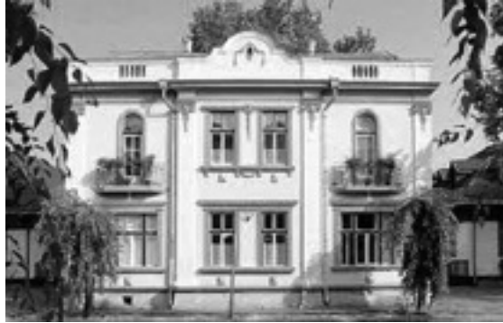
Berki galéria, Kiskunhalas