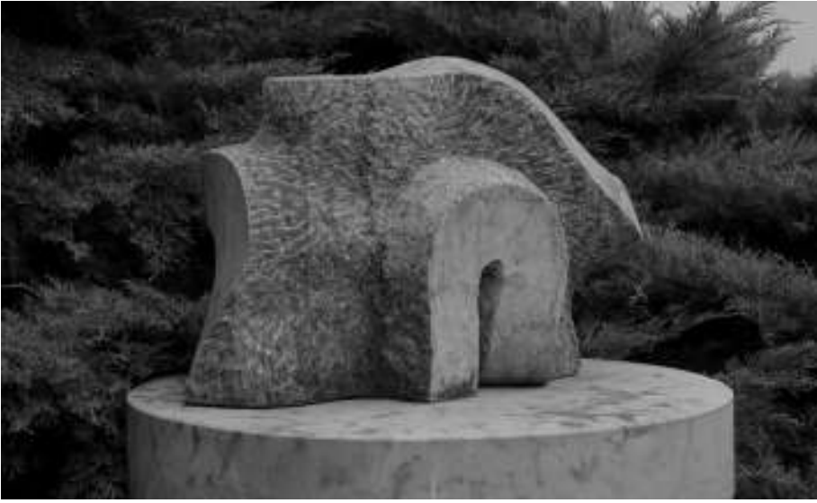
Alul és felül 2.