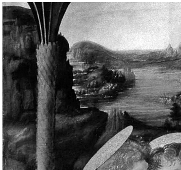
6. kép – Perugino: Jézus megkeresztelése (részlet) 1475 körül;