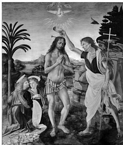
1. kép – Perugino: Jézus megkeresztelése (Washington Nemzeti Művészeti Galéria) 1475 körül; 2. kép – Verrocchio: Jézus megkeresztelése (Firenze Uffizi Képtár) 1475-78 3

A rajzon Jézustól balra ugyanúgy látható a két angyal, mint a későbbi festményen (3-4. kép). Ezen kívül, kétoldalt, a tájképi háttér motívumaiban is hasonlóság fedezhető fel (6-9. kép). A balról és jobbról záró sziklaszirtek közt elterülő tájban is rokonság figyelhető meg. A két főalak azonban részben más. Jézus ugyan kontraposztban áll mindkettőn, a testsúlya a festményen átkerült a másik lábára. A rajzon Keresztelő Szent János is kontraposztban áll, a festményen előrelépő mozdulatban látható. János és Jézus lábmozdulata a festményen a rajzhoz képest felcserélődik. A rajz utal az evangélium soraira is, Jánosnál nagyobbnak mutatja Jézust: „Én csak vízzel keresztelek, hogy bűnbánatra indítsalak benneteket, de aki a nyomomba lép, az hatalmasabb nálam.” 4 Később Perugino a két alaknak ezt az egyenragú dialógusát ismétli meg minden hasonló témájú kompozícióján (11. kép – Vatikán Sixtus kápolna, Bécs Kunsthistorisches Museum, Perugia Galleria Nazionale dell’Umbria). Mindez persze épp azt bizonyítaná, hogy a Verrocchio műhelyében készült oltárkép kompozíciós szem-