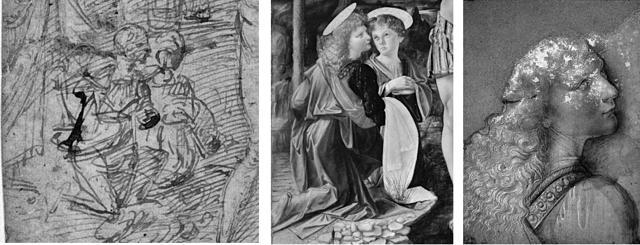
3. kép – Perugino: Jézus megkeresztelése (részlet) 1475 körül;

Ezúttal azonban a Jézus megkeresztelése kompozíció egésze a nagy kérdés, mert a bal oldali angyal arca, drapériája, előtte a kavicsokkal teli partszakasz, a sziklás háttér (lásd Sziklás Madonnák ), az egész tájképi háttér transzcendentális rétegzettsége, mint ahogy erre sokan rámutattak, nagy valószínűséggel Leonardóhoz köthető, habár a Torinói Királyi Könyvtárban őrzött, 1473-ra datált részletgazdag közeli angyalarcot (5. kép) néha Verrocchiónak tulajdonítja a szakirodalom.