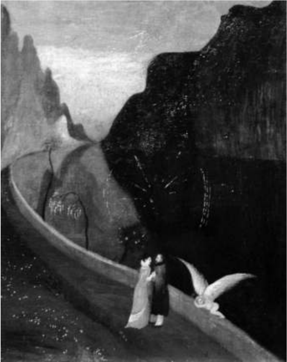
Csontváry Kosztka Tivadar: Szerelmesek találkozósa