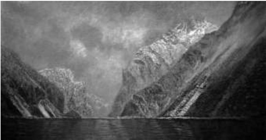
Mednyánszky távlati képe a Kazán-szorosról, a sziklabércsek a Csontváry-festményen is felismerhető alakzatokkal

A festmény a néző szempontjából nyugat-keleti tájolású, a vaskapui Duna folyásával egyirányú. Következésképp a bal oldalon levő részek északon (az akkori Magyarország, ma Románia), míg a jobb oldalon levők délen (Szerbia) találhatóak. A képen a szoros két oldalán levő hegyvidék körvonala sok mindenben hasonlóságot mutat az Al-Dunával, különösképpen a Kazán-szorossal (1-2. képek; számos további kép fellelhető az interneten, illetve több litográfia és különböző festőktől származó tájkép is jól ismert). A Széchenyi-empléktábla közvetlen környezetében az utat kőfal szegélyezi, az út kis kanyart vesz és kiszélesedik. Később a mellvédet kőkorlát váltja fel (lásd 3. kép). Ezek mind segítenek a „randevű” helyének pontos meghatározásában.