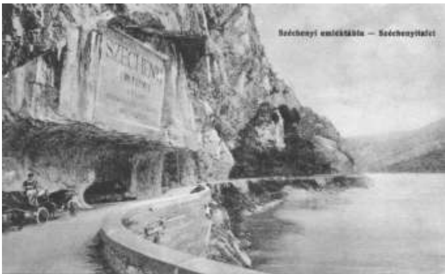
A Széchenyi-emléktábla. És az út, amelyet Széchenyi építtetett. A tábla előtt maga az út kiöblösödik, ez megfigyelhető a Csontváry-képen is. Ide helyezte Csontváry a kézfogó párt. Az utat kő mellvéd és támfal szegélyezi, távolabb viszont kőkerítés. A messzeségben az út fölött emelkedő sziklakupolák is láthatók Csontváry képén. A hely ma víz alatt van