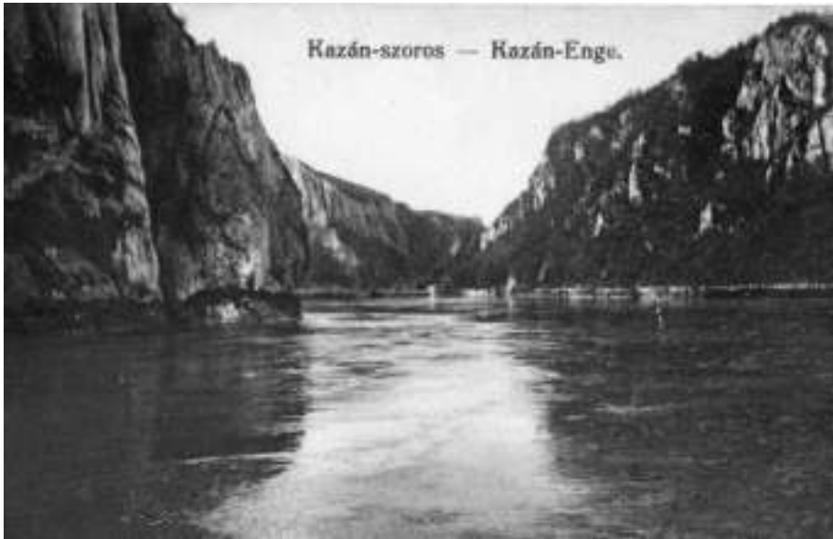
A Kazán-szoros látképe korabeli képselapon. A Csontváry-kép szempontjából különösképpen feltűnő a szerbiai oldal szikláinak körvonala, és a magyarországi rész kúpszerű sziklaszállai