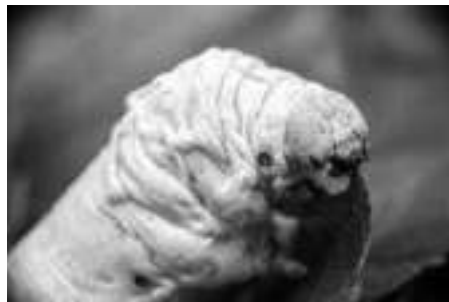
Az Eperfa selyemszövő (Bombyx mori) utolsó vedlésű hernyója (balra), eperfa (Morus sp.) levelén. Ez készíti a selyemgubót, amiben elrejtőzve bábozódik. Jobb oldalon a hernyó kinagyított feji része, ami emlékeztet a Csontváry-képen a mellvéd mögül előmászó puttó arcára