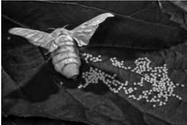
Petéző nőstény Eperfa selyemszövő (Bombyx mori) felülnézetből. A lepke röpképtelen. Csontváry képének szempontjából figyelemre méltó a fehér test és a hegyes fehér szárny