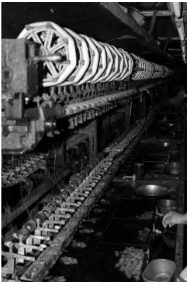
Nagyüzemi selyemkészítés a mai Kínában. A kép alján a selyemgubók, felül pedig a selyemgombolyító kerekek sora, a felgombolyított selyemmel

A találkozás helye és Széchenyi személye adja a megoldást a titokzatos kerékre. A kerék annak a gépnek a legfontosabb része, amely a selyemlepké gubójáról lefejt a selyemszálat, vagy magát a selyemfonalat gombolyítja. Mind kisiparosi, mind pedig nagyüzemi használatban ismert. Lehet, egyeseknek megnyugtatóbb lenne a kerékre valamiféle teozófikus kálacsakrárt ráerőltetni, de ez Csontváry filozófiájától idegen. Csontváry nem állatövekben élt, hanem igyekezett a Teremtő valóságát megfesteni. A selyemiparral Széchenyi és Csontváry neve is kapcsolatba hozható, mindketten fontosnak tartották a hazai selyemgyártás felvirágoztatását. A kerék tehát nem misztikus jelkép, hanem nagyon is valóságos utalás egy olyan eszközre, aminek alkalmazása előmozdítja a nemzet felemelkedését.