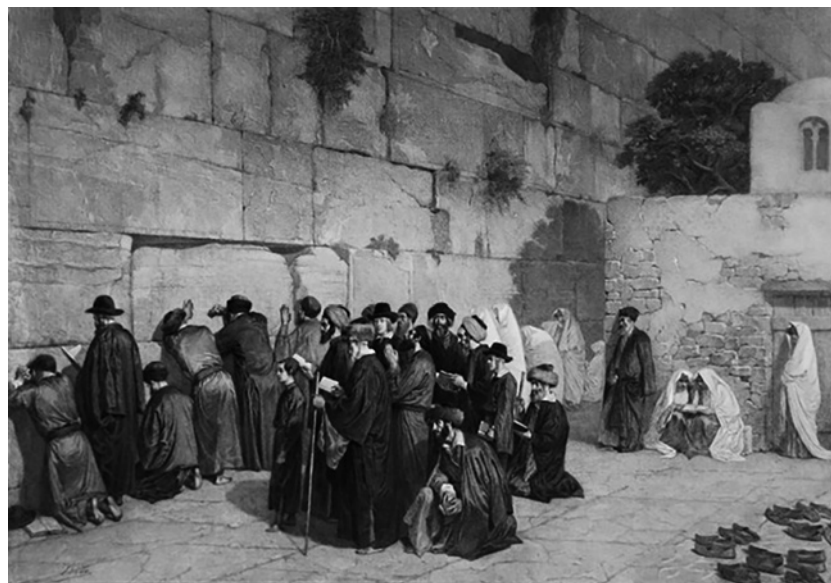
A Siratófal 1851-ben, a déli oldalon még áll a mecset; jól látható az épület bejárati ajtaja, amit később befalaztak; Alexandre Bida (1813–1895) metszete.