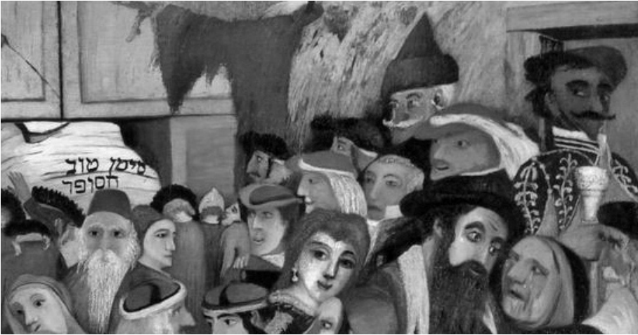
Kivágás Csontváry „A Panaszfal bejázatánál Jeruzsálemben” című képéből. A jobb felső sarokban láthatók az esszében elemzett motívumok (jobbról balra): az oldalfal és az ajtó; a tamburmajor; a zöld süveges férfi; a kötélben lógó vörös rongy.