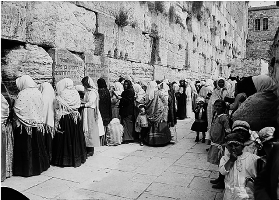
A Siraófal észak felől nézve, imádkozó asszonyok (1898-ban készült felvétel). Jól látható a Csontváry által megfestett legelső kőtáblák jellegzetes vízszintes kopása, és a kövekbe vésett vagy felfestett feliratok, illetve a síkátort részben lezáró déli fal, ami a hajdani mecset maradványa. Az egykori épület nyugati fala meszelve van, az északi fal viszont nincs. Ismertek olyan felvételek, ahol az északi fal is fehérén ragyog a meszeléstől.