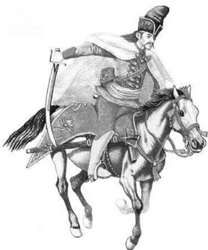
Kuruc lovasvitéz, a Csontváry képen is ábrázolt hegyes süveggel.