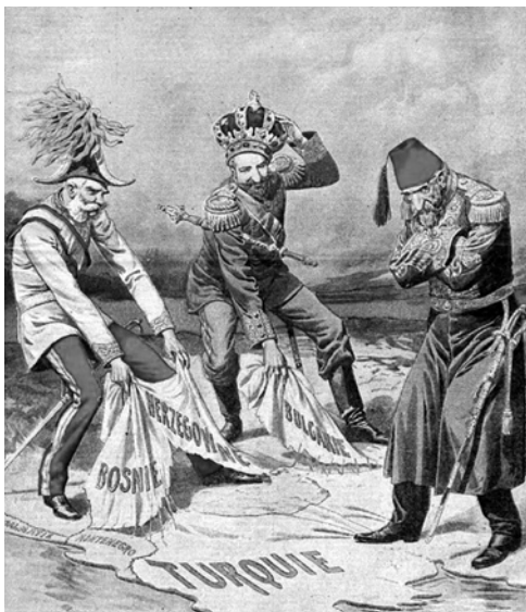
Az Oszmán Birodalom részeinek megszállását kifigurázó korabeli karikatúra. A birodalmat kormányzó V. Mehmed (1844–1918) piros fezen és arany süjtásos kék atillában a kép jobb oldalán.