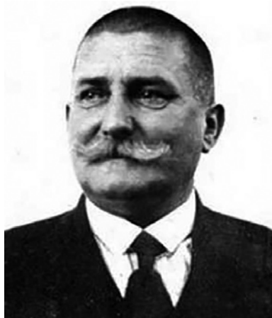
Az őszülő Egán Ede (1851–1901), aki sokat tett a kárpátaljai ruszin nép felemelkedéséért. Az Ung vármegyei Szerednyén gyilkolták meg, ahol Csontváry nyári vakációit töltötte, és apjával lődözték a tűzijátékokat. A panaszfalos képen a zöld süveges alaknak is fehér magyar bajusza van.