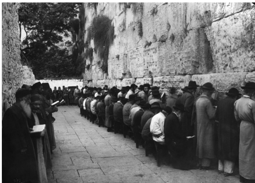
A Siratófal dél felől nézve, imádkozó férfiakkal (1900 körül készült felvétel). A háttérben húzódó lemeszelt oldalfalba vágott fakeretes ajtó látható; továbbá mögötte a nagy fa, aminek egyik benyúló ága Csontváry képének fontos motívuma.