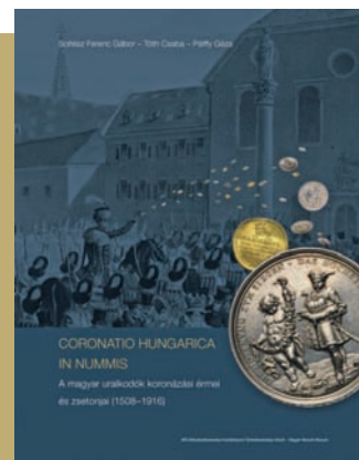
CORONATIO HUNGARICA IN NUMMIS A magyar uralkodók koronázási érmei és zsetonjai (1508–1916)

MTA BTK Történettudományi Intézet Budapest, 2016