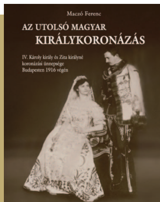
MACZÓ FERENC Az utolsó magyar királykoronázás. IV. Károly király és Zita királyné koronázási ünnepsége Budapesten 1916. december végén

Végül az utolsó napon, szeptember 30-án először egy gyalogos ütközetben cseh és német csapatok küzdöttek meg a magyar huszárokkal, majd a tűzijáték-kastély látványos ostroma következett. A favárat német gyalogosok, majd markotányosok védtek, a támadók játék fegyvereket – fakardot és fából készült golyókat kilövő ágyúkat – használtak. Forgách Ferencnél az is szerepel, hogy a sikeres ostrom után a várra „hamis fejeket” és „csinált embereket” raktak. Itt hasonló bábukra gondolhatunk, mint az 1563. őszi koronázás tűzijátékkastélya esetében. ♦