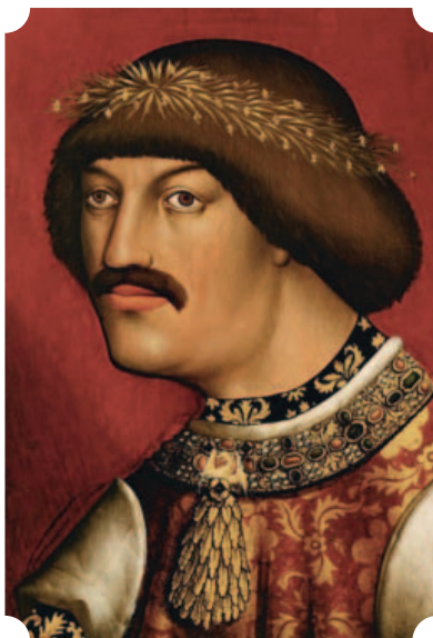
Habsburg Albert magyar király (1437–1439)

A közép-európai államok alapító dinasztiáinak kihalása után helyüket új trónkövetelők foglalták el, akik a trónigényüket gyakran a korábbi dinasztia női leszármazóival kötött házassággal erősítették meg. Így kerültek hatalomra az osztrák tartományokban a Habsburgok, Magyarországon az Anjouk, Csehországban a Luxemburgok, Lengyelországban a Piast-