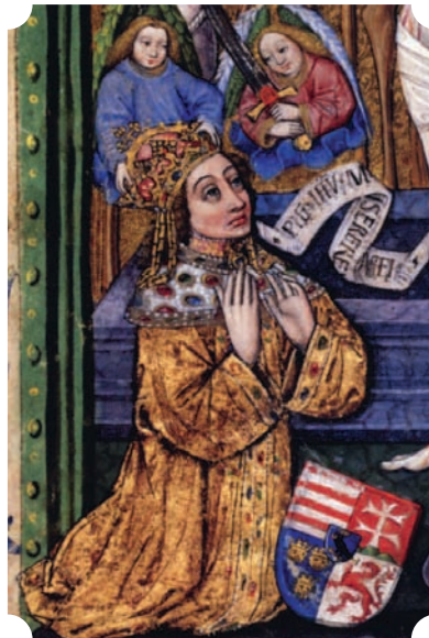
Az imádkozó Mátyás a vatikáni ferences missalében, 1469

Az udvari párt májusban megkoronáztatta Lászlót, Erzsébet 1440 februárjában született fiát, és bár a szertartás az ország szokásai szerint ment végbe, azaz a csecsemőt az esztergomi érsek Székesfehérváron a Szent Koronával koronázta meg, Ulászló trónra lépését ezzel már nem tudták megakadályozni. Így a következő négy évben Ulászló gyakorolta a hatalmat, ám a dinasztikus legitimáció megszakadásának messze ható következményei lettek. Egyrészt tartóssá vált a hatalmi elit megosztottsága, az ország Jagelló Ulászló és Habsburg László hívei között két pártra sza-