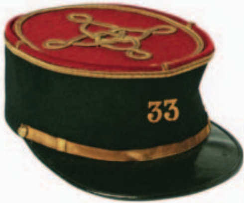
Francia katonai fejfedők