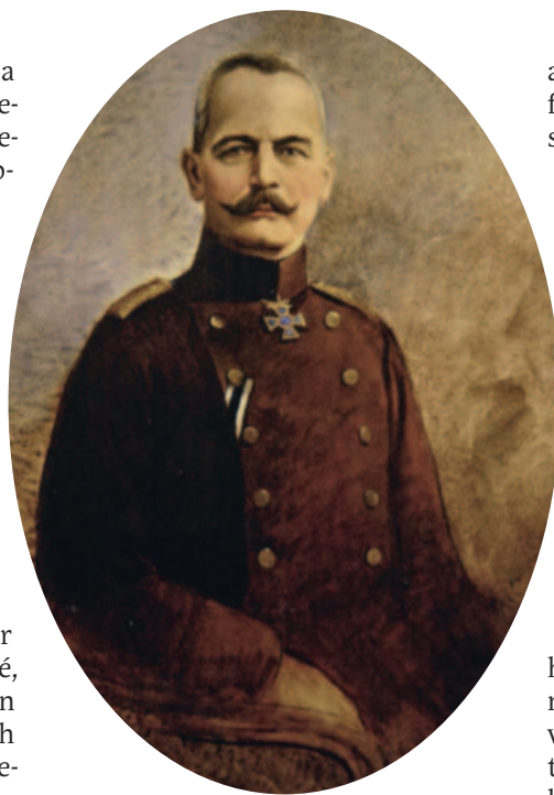
Erich von Falkenhayn tábornok

A nagy háború emlékezetében a hadvezéreknek kitüntetett helyük van. Kétségkívül ők szerepeltek a korabeli médiában is a legtöbbit, a katonai hierarchiában elfoglalt különleges helyzetük következtében pedig mundurba öltöztetett harcosok százerei tartoztak adott esetben a parancsnokságuk alá. Az ő számukra legalább a parancsnokuk neve ismerős volt – még ha többnyire soha nem is kerülhettek vele testközelbe. Akadtak kedvelt hadvezérek (kevesen), és voltak olyanok is (szép számmal), akik igen rossz hírnévre tettek szert. Utóbbiak között a brit Haig, illetve French, a francia Nivelles és a magyar Tersztyánszky főleg arról vált hírhedté, hogy a rájuk bízott csapatoknál igen magas volt a veszteségi arány. Erich von Falkenhayn tábornok, a német vezérkar 1914 és 1916 közötti főnöke tulajdonképpen nem tartozott a nagy „mészárosok” közé – az utókor szemében mégis ő számít a legvisszatetszőbb, legcinikusabb első világháborús hadvezérnek.