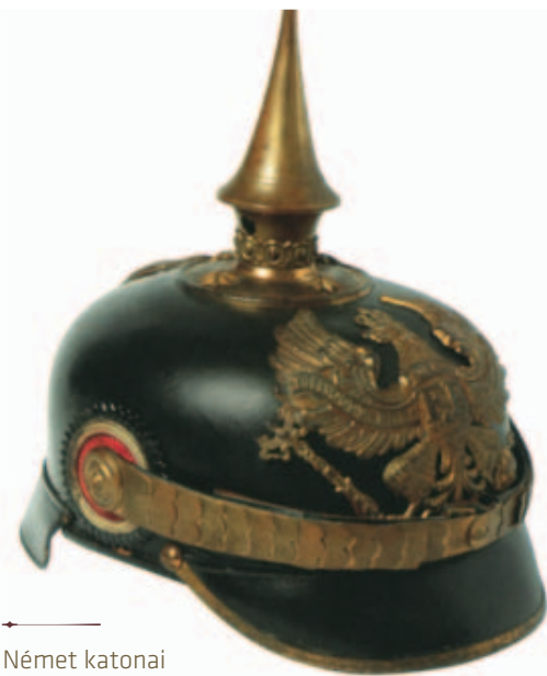
Német katonai fejfedők