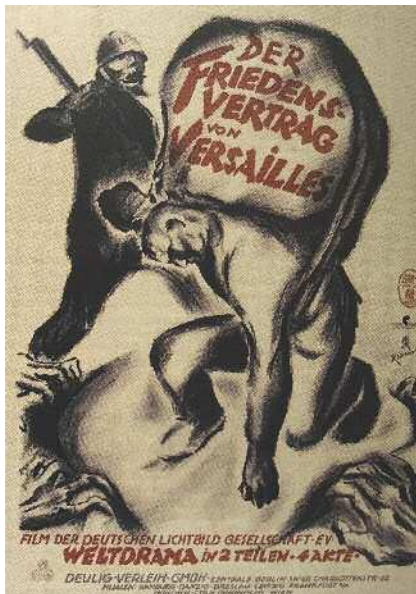
A versailles-i békeszerződés. Világdráma két részben. Filmplakát, 1923

A Monarchia úgy érezte, pusztá léte forog kockán. Szentpéterváron attól tartottak, hogy Oroszország nagyhatalmi státusza válik komolytalanná, ha nem reagál Szerbia megtámadására – de szemet vetettek Konstantinápolyra és a török tengerszorosokra is. Németország úgy vélte, hogy a Monarchia nagyhatalmi pozíciójának megőrzése számára is létkérdés, amelyet a hármas antant veszélyeztet. Poincaré Franciaország biztonságát hozta fel in-