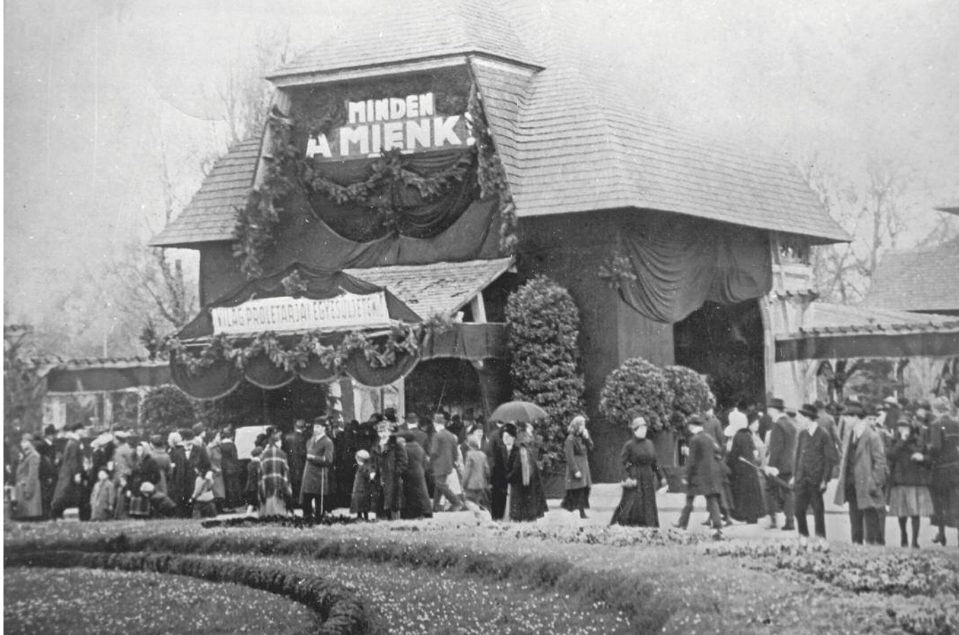
„Minden a miénk!” Dekoráció a Margitsziget bejáratánál, 1919. április 13.

hozott. A kormánynak az Osztrák-Magyar Monarchiában – ahogy a többi hadviselő országban – elemi érdeke volt, hogy az ipari munkásság támogassa a háborús erőfeszítéseket. Pontosán emiatt számos területen kompromisszumra kényszerültek az addig szinte teljesen elutasított szociáldemokrata párttal. 1916-tól az üzemekben a bérek és a munkakörülmények miatt fellépő feszültségek kezelésére panaszbizottságokat állítottak fel, amelyekben a hadsereg, a munkáltatók és a munkások egy-egy képviselője kapott helyett. Ezekben a bizottságokban a munkavállalókat szinte minden esetben a helyi szociáldemokraták képviselték, így befolyást szereztek olyan kérdések eldöntésére, mint a munkások elbocsátása, betegszabadságolása vagy éppen a katonai szolgálat alóli felmentése.