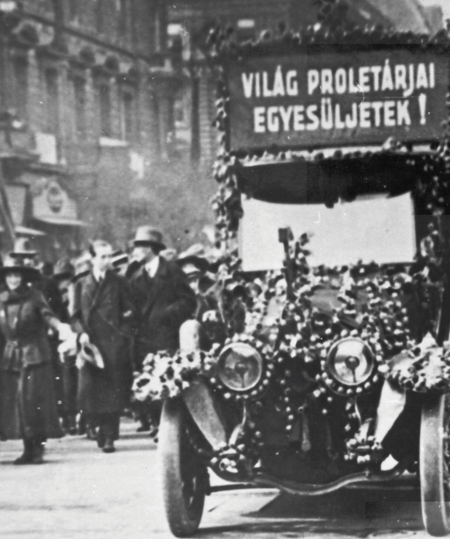
↔ Felvonulók az Andrássy úton, Budapest, 1919. május 1. ↔