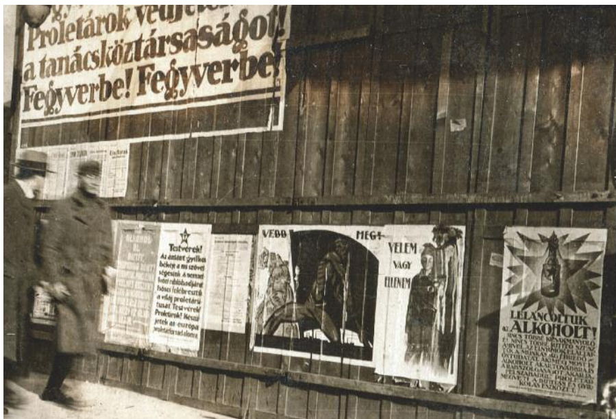
Utcai plakátok Budapesten, 1919. május 1.

kirándulásra. A hatóságok ezúttal már erőteljesen felléptek a tüntetőkkel szemben, és több helyen erőszakos oszlatásokra, ezek nyomában pedig letartóztatásokra került sor. Ha a fővárosban nem is, néhány vidéki helyszínen összetűztek a karhatalommal. Békés megyében az Orosházáról indult tüntetési hullám végigsöpört a Viharsarok területén, a nagyszénási, békéscsabai, battonyai agrárszocialista jellegű tüntetések leveréséhez a csendőrség a sortűztől sem riadt vissza.