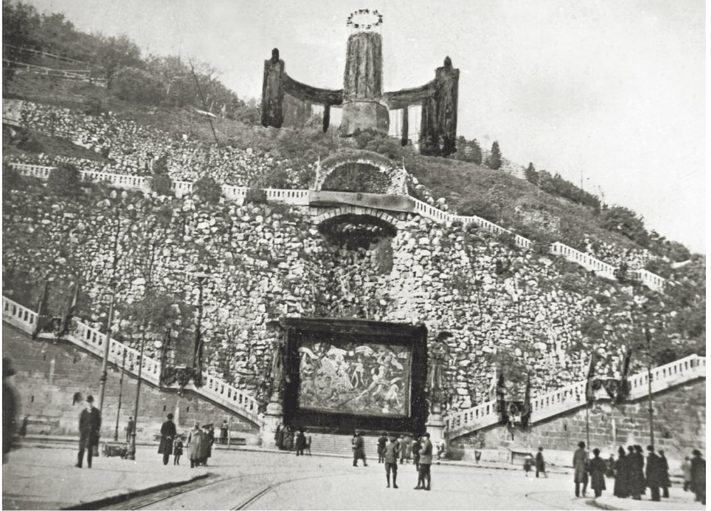
A becsomagolt Gellért-szobor, 1919. május 1.

zési helyére, a Vérmező közepére hatalmas vörös szarkofágot építettek, „Martinovics” felirattal. A diktatúra történelemszemléletét tükrözte, hogy ugyanezen a téren egy hatalmas Lenin-szobrot is elhelyeztek. A szimbolika bizonyára a jakobinus mozgalom és a nemzetközi kommunizmus közti kapcsolatot hangsúlyozta. De a rendszer a szimbolikus politizálással másutt is nyomatékosította, hogy kiket tekint előképeinek és hőseinek, és kiket tart ellenségeinek. Amíg a Petőfi téren álló Petőfi-szobor ünnepi díszítést kapott, addig a városligeti Millenniumi emlékmű „reakciós” királysobrait vörös textíliával takarták le.