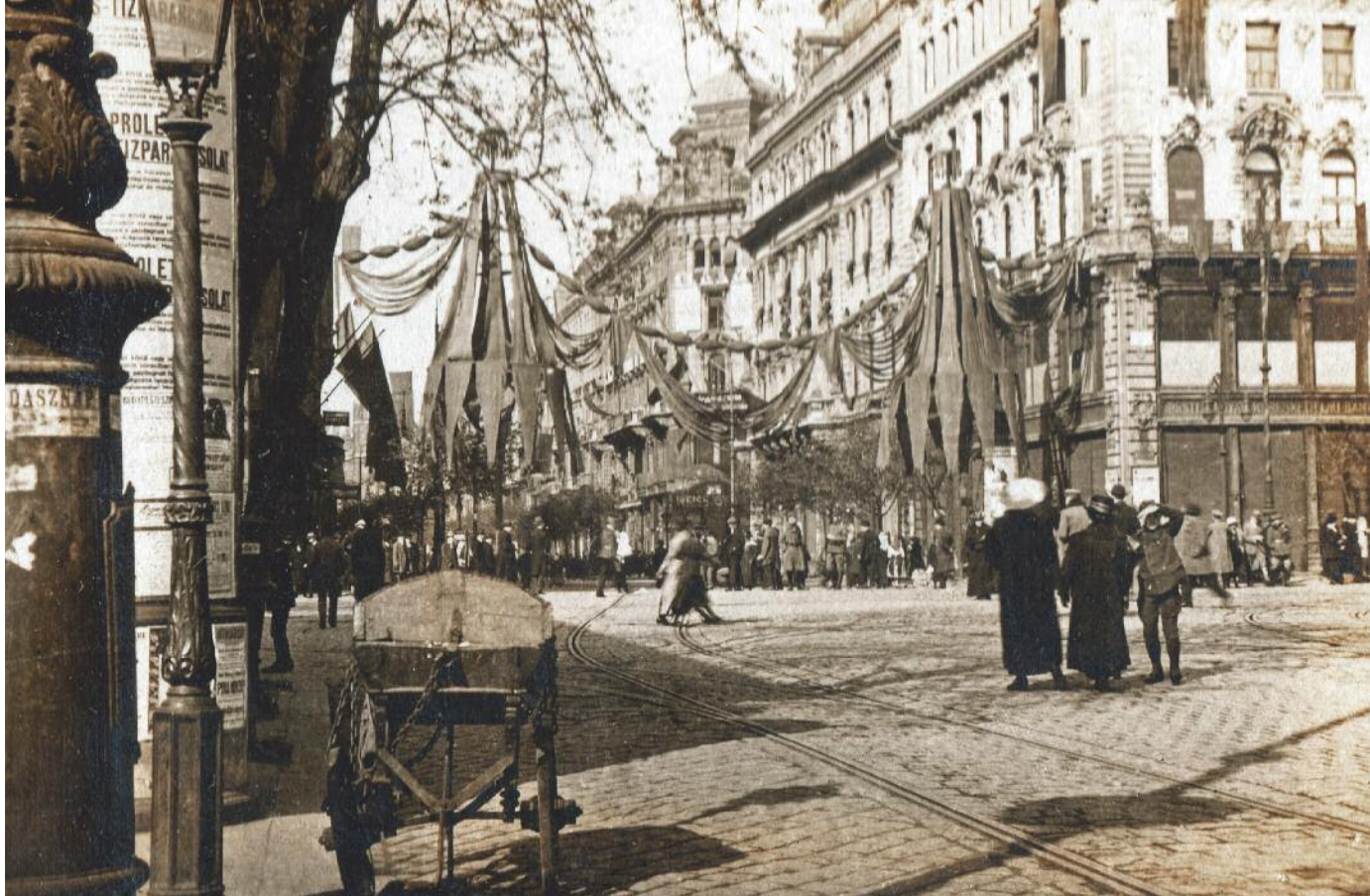
A Kossuth Lajos utca az Astoria kereszteződéséből nézve, Budapest, 1919. május 1.

ták egy „rendezői központ” utasításainak megfelelően. A többnyire hatos és nyolcas sorokba rendezett felvonulók mellé intézők voltak beosztva.