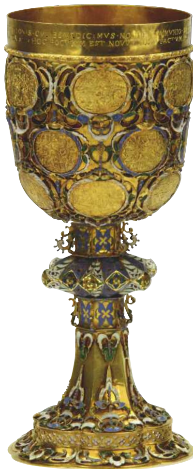
Áldozókehely. Készítette: Brózer István, 1624, Kolozsvár

Az 1715-ös országgyűlés a vallási sérelmek kölcsönös kivizsgálására és orvoslására létrehozta az úgynevezett pesti bizottságot, amelybe az uralkodó és a rendek is delegáltak tagokat, s egyidejűleg vallási téren teljes változtatási tilalmat rendelt el. A bizottság utóbb működésképtelenségévé bizonyult, s munkájának hatása csak abban mutatkozott meg, hogy az itteni vitákban fogalmazódott meg az a koncepció, amely III. Károly két jelentős rendelkezését, az első (1731) és a második (1734) Carolina Resolutiót meghatározta.