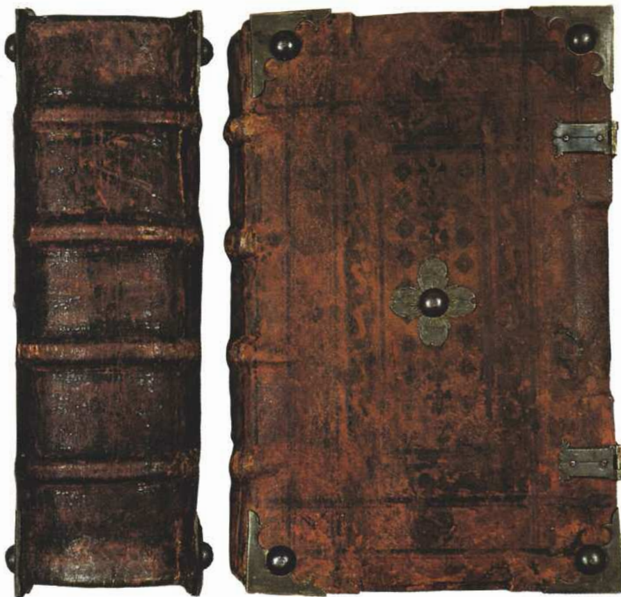
Luther Bibliájának a Fuggerek által finanszírozott luxuskiadása a fejedelmek számára. Az illusztrációkat többek közt Holbein és Cranach készítette. Augsburg, 1535

A második nyomozásban ugyannerre a társadalmi közrege vonatkozik egy bevezető félmondat: „ivás közben beszélgettek a papokról, hogy az a hír járja: meg kéne házasodniuk”. Moritz Pál vádlott szavai pedig pontosan fo-