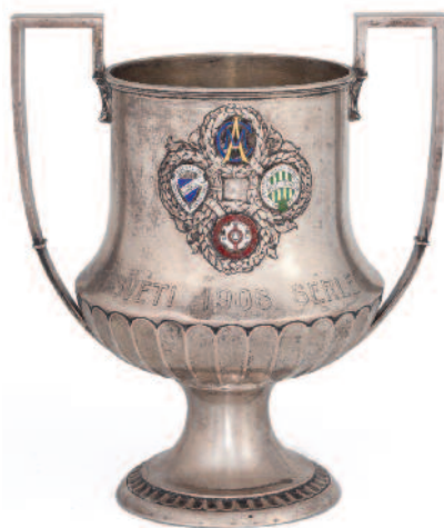
Az 1908-ban rendezett Húsvéti Tornán részt vevő csapatok (MTK, FTC, BTC és a bécsi Amateure) klubjelvényei és a torna serlege

De a Ferencváros és a magyar labdarúgás újabb nagy korszakának, mint szinte mindennek ezen a földön, véget vetetett a második világhégés.