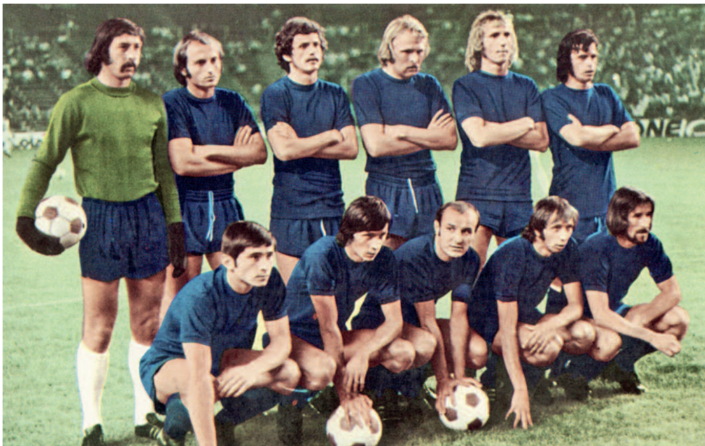
Az Újpest bajnokcsapata, 1974

ták, holott a visszavágó szünetében már 2:0-ra vezettek. 1967-ben a Közép-európai Kupa fináléját is a Dózsa vívta, itt is második lett 5:4-es összesítéssel a csehszlovák Spartak Trnava mögött.