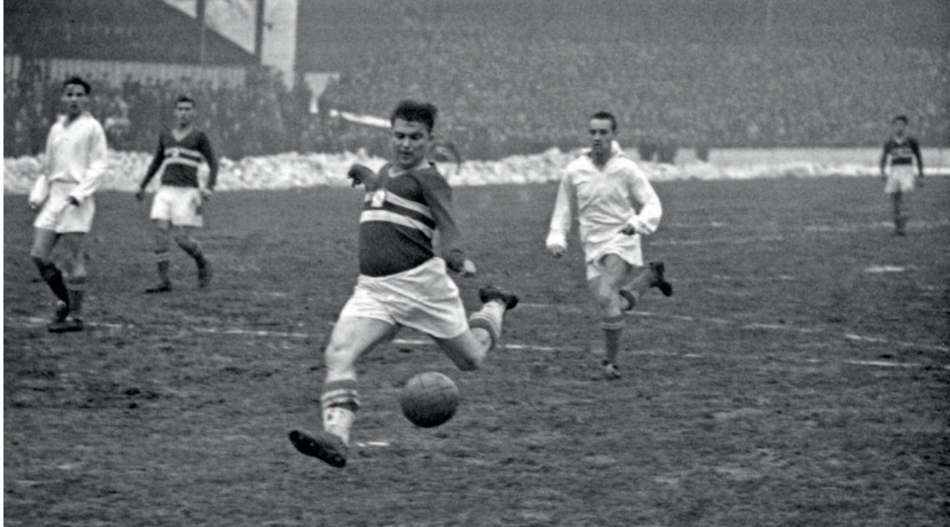
Puskás lövőhelyzetben a Bp. Honvéd–Bp. Vörös Lobogó mérkőzésen (9:7), 1955. január 9.

A fiatalabbak (Tichy, Machos, Solti és Palicskó) mentesültek a szankciók alól, mert nem utaztak el Puskásékkal, a korábban hazatérő Töröcsik I és Dudás megúsza három hónapos eltiltással, a később, de Magyarországot választó Bozsik, Bányai, Rákóczi, Faragó, Budai II és Kotász június 7-ig nem játszhatott, de május 1-jén valamennyien amnesztiában részesültek. Azonban a sztárjait elvesztett kispesti csapat csak 11. lett a bajnokságban, és ha nem emelik fel a létszámot 14-re, szégyenszemre kiesett volna.