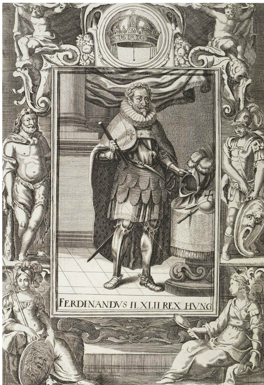
II. Ferdinánd magyar király teljes alakos portréja a Szent Korona hiteles ábrázolásával

Így került sor 1622. július 26-án az első soproni királyné-koronázásra, amikor a főtéri ferences templomban Eleonóra Anna királynét a Pázmány Péter érsek celebrálta szentmisében Magyarország királynéjává koronázták. Míg a