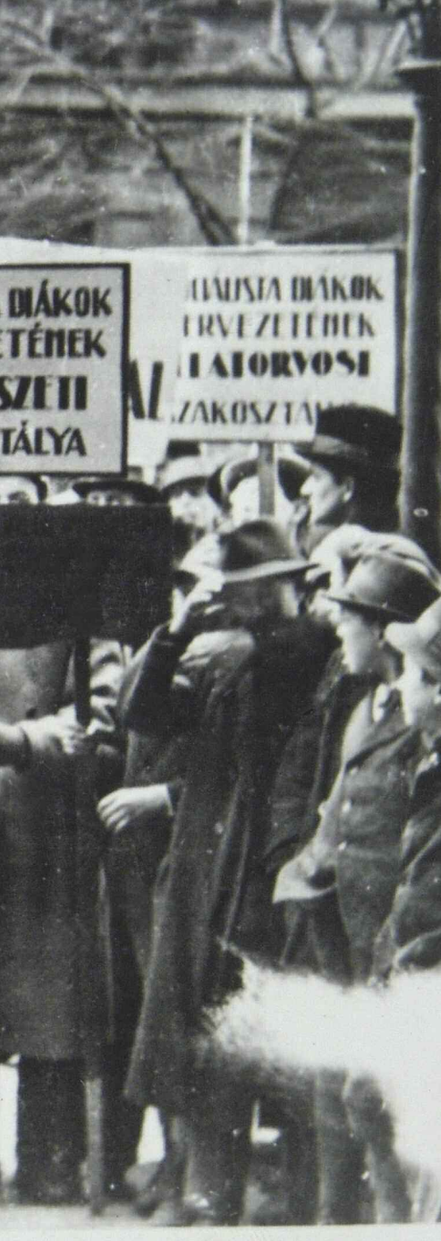
A proletárdiktatúra mellett tüntető szocialista diákok egy múzeumkerti ifjúmunkásgyűlésen, 1919. március-április

binus diktatúrának nevezték el, bár mind a kortársak, mind a francia történészek rendkívül ritkán használták e szóösszetételt. Ennek okát könnyen felismerhetjük, ha összehasonlítjuk Albert Mathiez francia történész A francia forradalom című könyvének eredeti és magyarra fordított tartalomjegyzékét. A francia kötetben a harmadik rész alcíme La Terreur (A terror) , az 1957-es magyar kiadásban azonban ez az alcím A jakobinus diktatúrára szelődött. Vagyis a jakobinus diktatúra és a proletárdiktatúra fogalma egyaránt arra használható, hogy demokratikusabb színben lehessen feltüntetni egy-egy terrort alkalmazó politikai rendszert, hiszen a korábban elnyomott többség sújt le vele az egykori elnyomókra.