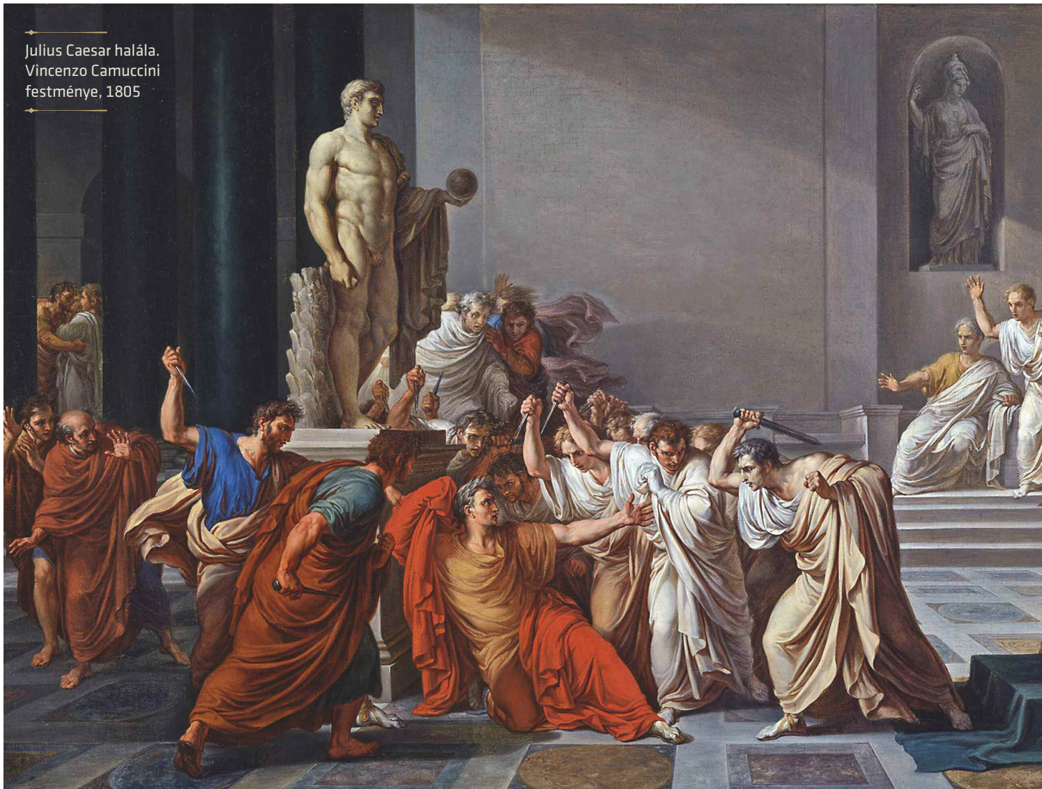
Julius Caesar halála. Vincenzo Camuccini festménye, 1805

végül 44-ben dictator perpetuusá, vagyis élethossziglani dictatorrá választotta meg magát. Igaz, hogy egy hónappal Caesar halála előtt Antonius megpróbálta őt királyi koronával megkoszorúzni (a corona jelentése koszorú), de Brutusék számára már az élete végéig tartó dictatura is sok volt: úgy döntöttek, hogy élete ne tartson tovább 44. március 15-énél.