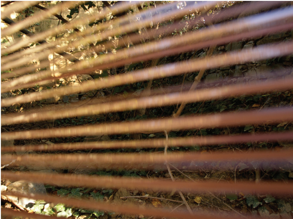
Horváth Csaba: 641,25 méternyi csend