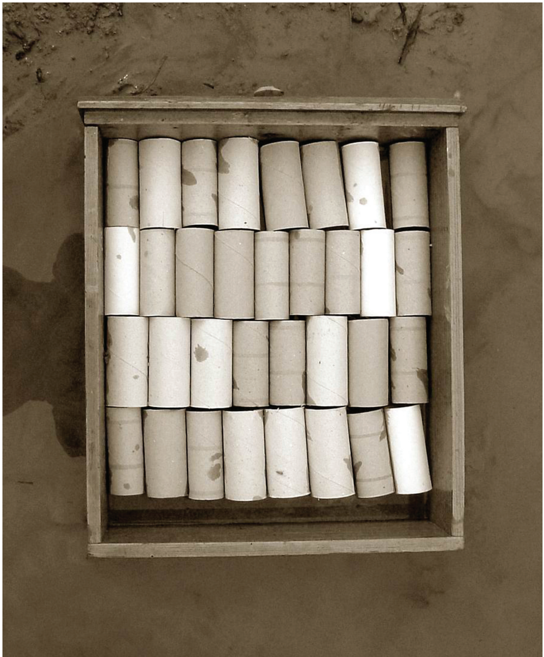
Herczig Zsófia: Cím nélkül