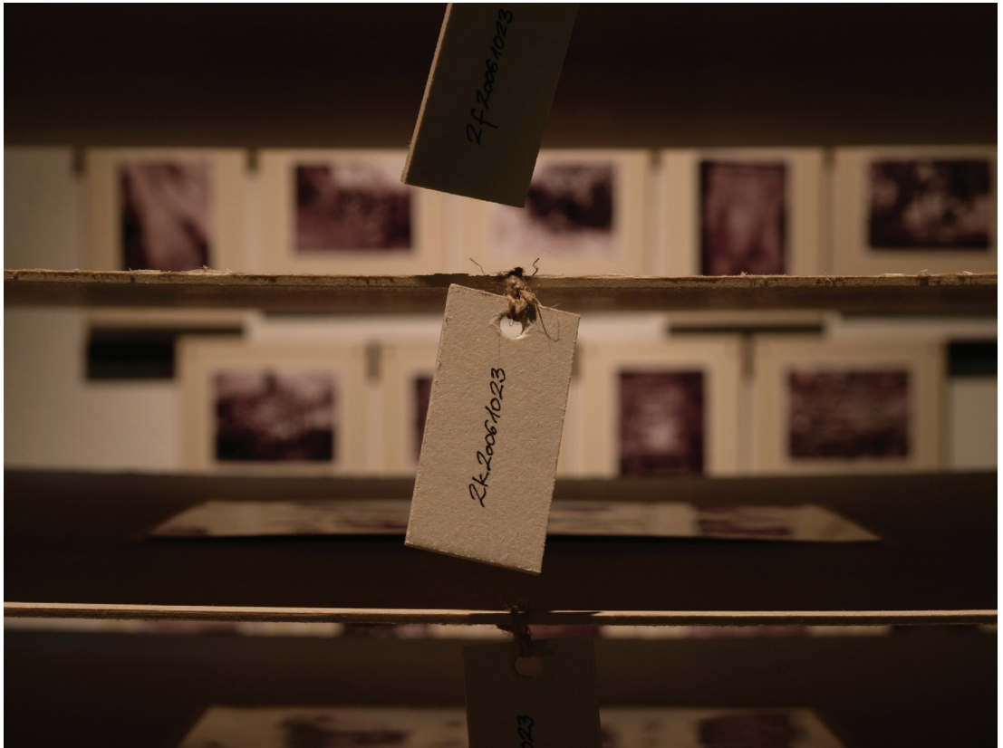
Herczig Zsófia: Cím nélkül