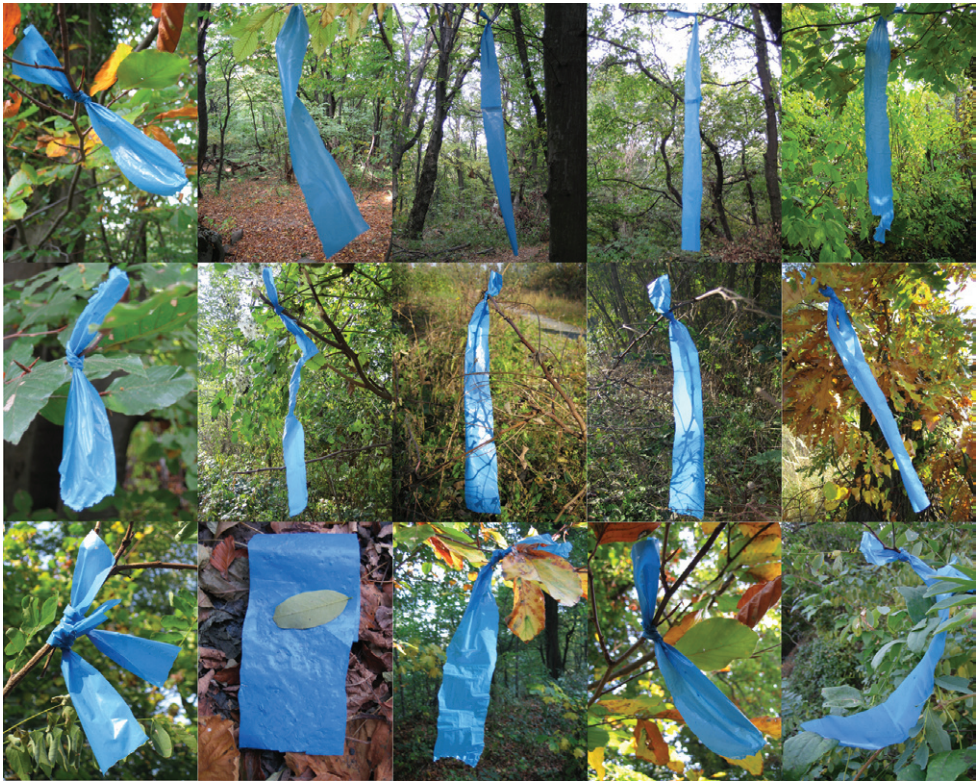
Horváth Erzsébet: Jelek