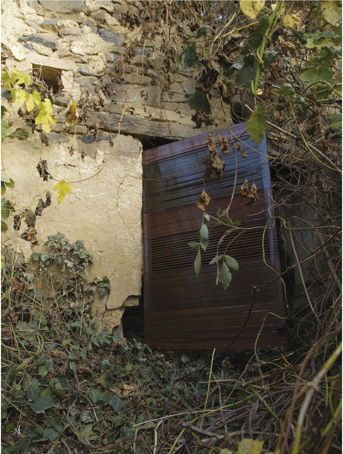
Horváth Csaba: 641,25 méternyi csend