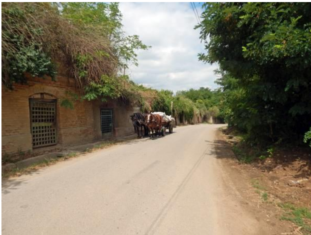
A nagyburgai, más néven Nagy pincesor