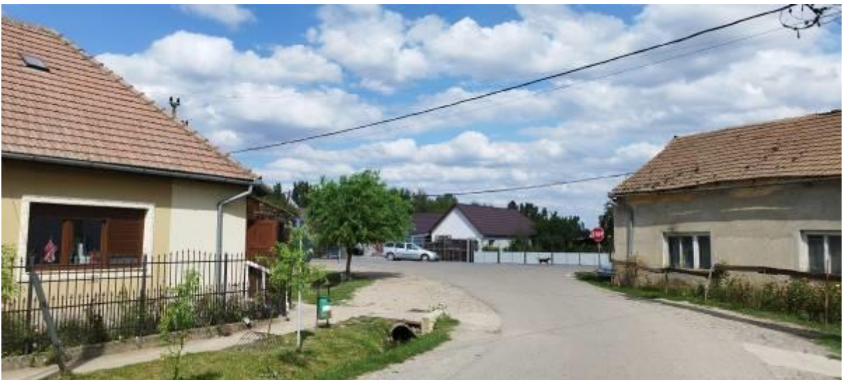
A Központ és a Posta utca kereszteződésének vegyesbolt felőli oldala