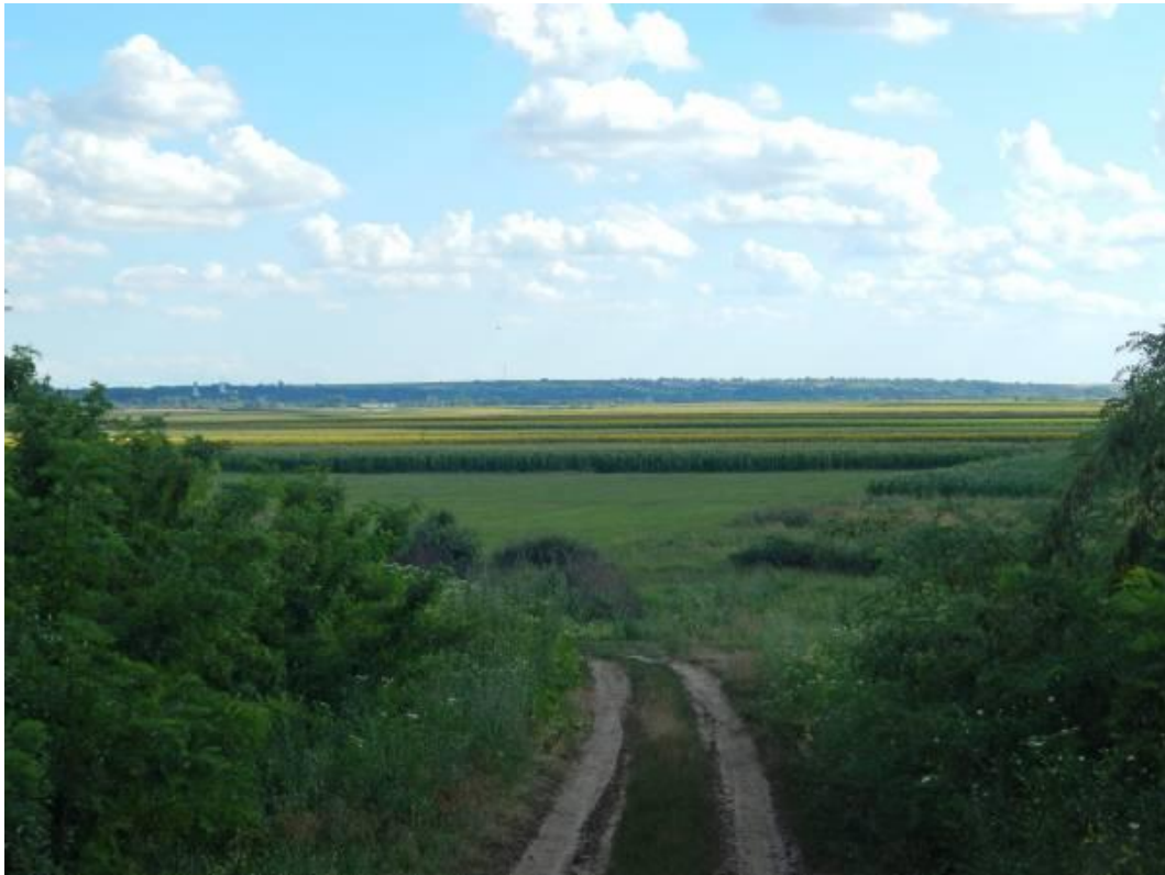
Szalacs az alsó határ felől, a Szent János halomról tekintve