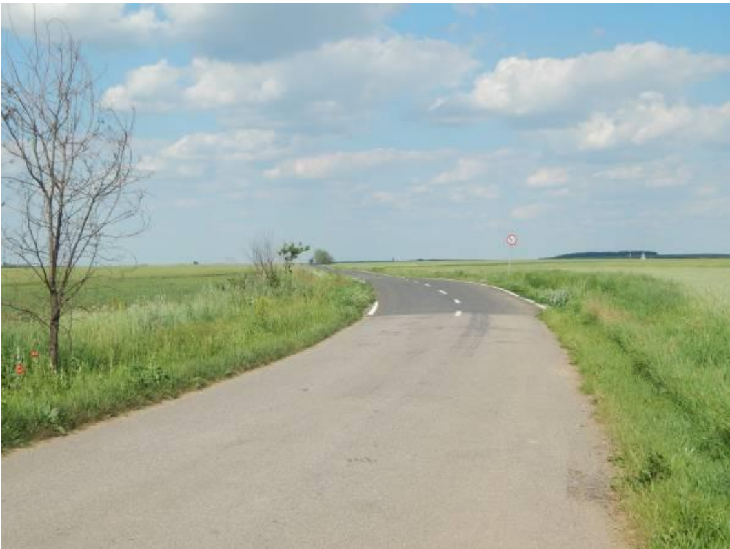
A Bihar–Szatmár megyehatár Szalacs és Szilágypér között