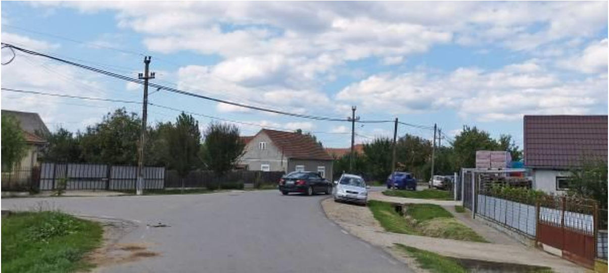
A Posta utca és a Központ kereszteződése a műszaki üzlet felőli oldalon