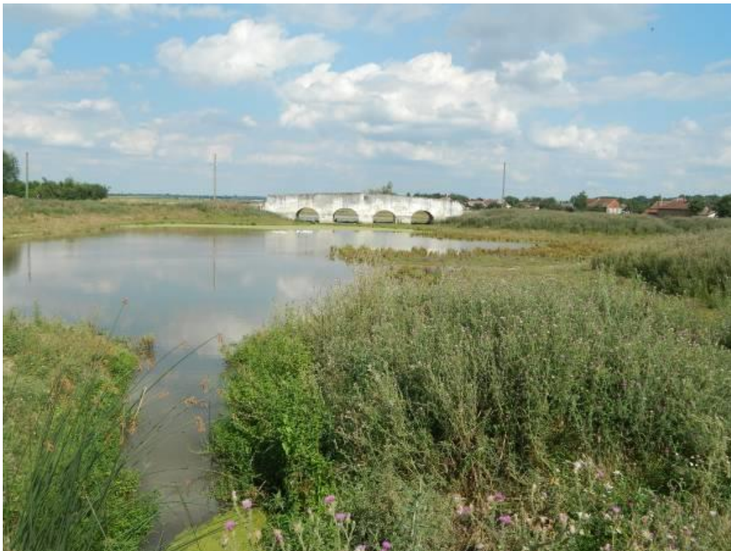
A Kőhíd, melynek közvetlen környezete lápos maradt