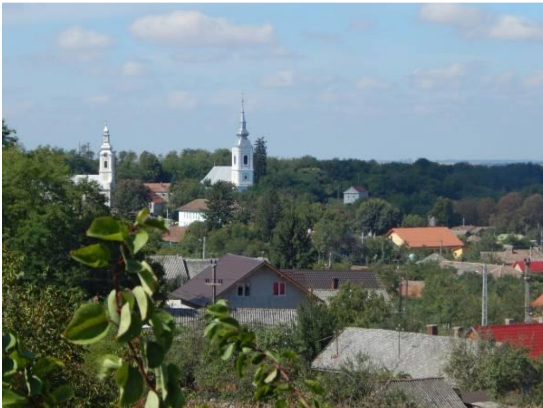
A Szentgyörgy és a felső határ peremén