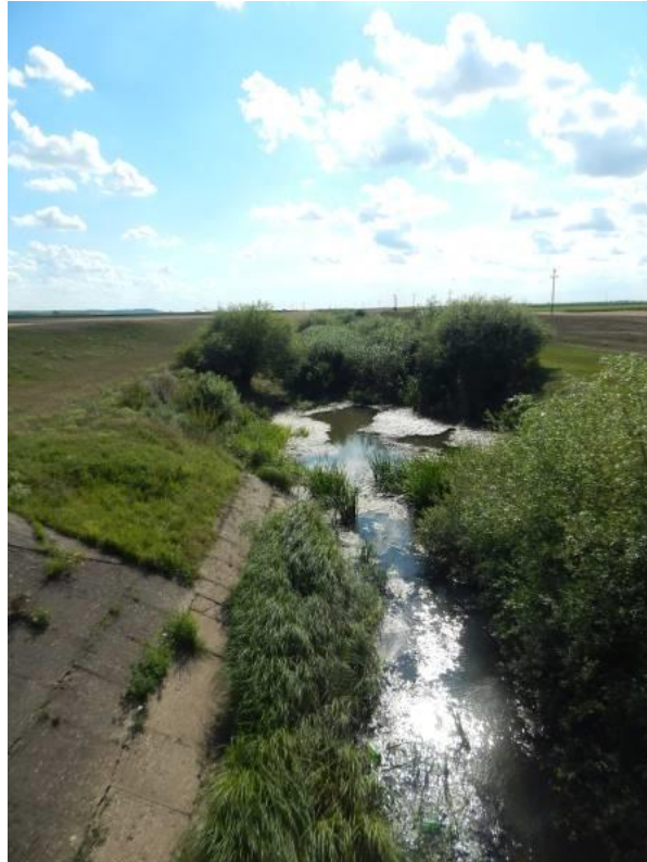
Az alsó határt kettévágó kanális