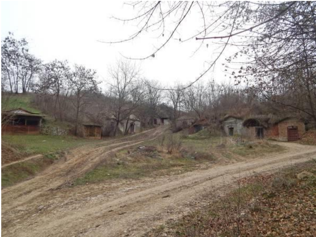
A Katonaberek pincesor a Tót utcai (Kossuth utcai) hegy alatt