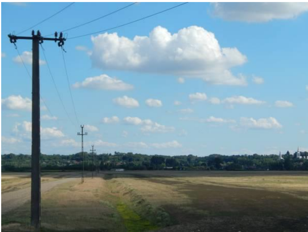
A korábbi ártér sávja, és a távolban a Kőhíd