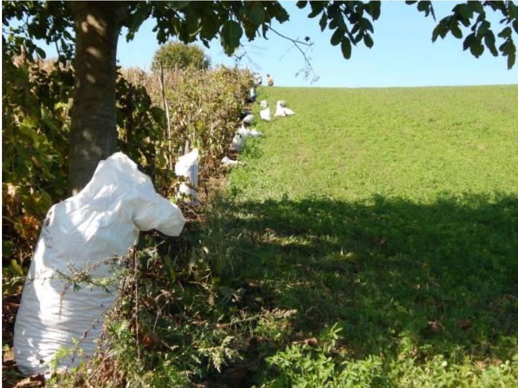
A szőlőhegyek mozaikos képe szüretkor