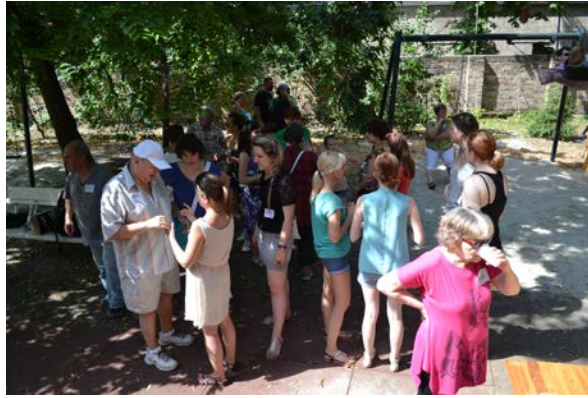
Pillanatkép a piknikről