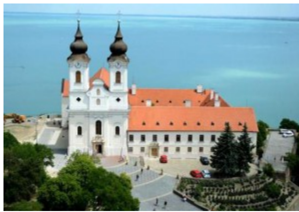
A Tihanyi Bencés Apátság

Az 1880-as évekre az épületegyüttes nagyon rossz állapotba került és felvetődött az is, hogy a templomot teljes egészében újjá kellene építeni. Cziegler Győző építész, a Műegyetem tanára 1889-1890 között megoldotta a templom és kolostor szerkezeti problémáit, és az épületegyüttest teljesen felújította.