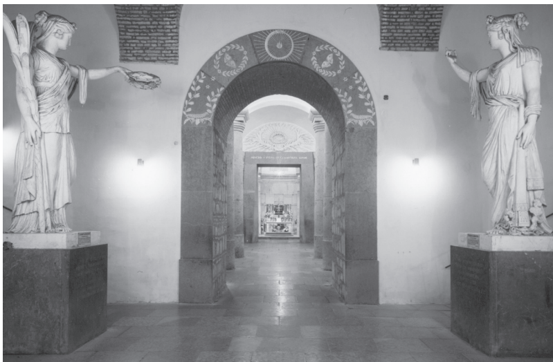
1. kép: Az esztergomi bazilika altemplomának teremsora

Ha Kühnel és Packh közül ez utóbbit tekinthetjük a kripta megálmodójának, érdemes még röviden utalnunk az itt található korabeli szobrászati díszítések tervezőjének és kivitelezőjének személyére. Az esztergomi bazilika altemplomában ugyanis (egy-egy tagozatok esetében mindenképpen) több alkotó együttes tevékenységével kell számolni. Egyfelől a kripta ornamenteinek kivitelezése 1823 májusától 9 a Rudnay primás alkalmazásában lévő bécsi szobrászművész, Andreas Schroth feladata lett. Ő még ebben az évben elkészítette a kőfaragványokat, az oltár keresztjét és a gyertyatartókat, a következő esztendőben pedig a lépcsősor alatt lévő két allegorikus szoboralakot. 10 A szobrász monográfusa a mesterhez köti továbbá a két belső, vörösmárvány bejárat elkészítését is. 11 Másfelől azonban ugyancsak Szerdahelyi Márk a primási kripta oszlopfőinek megtervezését Packh János munkájának tartja. 12 Ezt támasztja alá egyrészt a Pack-tervek Schroth megbízásánál korábbi, 1823 februári keltezése, 13 másrészt a tervrészleteknek a megvalósult állapothoz való hasonlósága is. Packh János rajzait figyelembe véve szembetűnik, hogy a primási, belső sírboltban az architektonikus elemek díszítései szinte változtatás nélkül valósultak meg, 14 az előcsarnokban ezzel szemben nem az építész (fennmaradt) tervét vették alapul. Emellett a helyiségek vörösmárvány bejáratait keretező díszítő