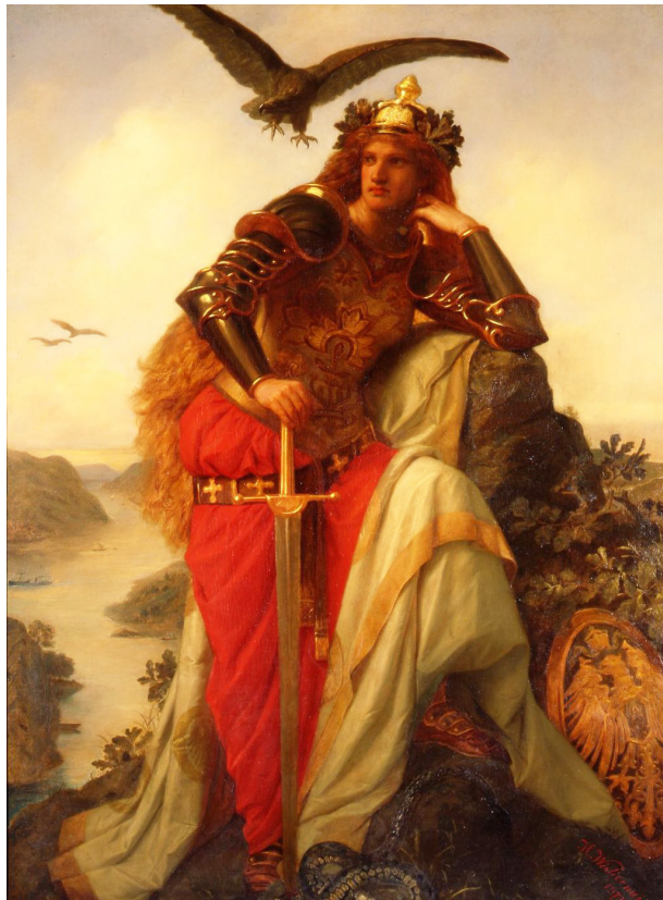
Hermann Wislicenus: Germania oder die Wacht am Rhein (1873)

Nach 1871 kehrt die Kämpferin zwar dem Krieg den Rücken, das Schwert bleibt aber in ihrer Hand und sendet eine Warnung an die feindliche Welt. Germania, die Hüterin des Friedens, hält ihre Augen offen und sollte sich ein Feind nähern,