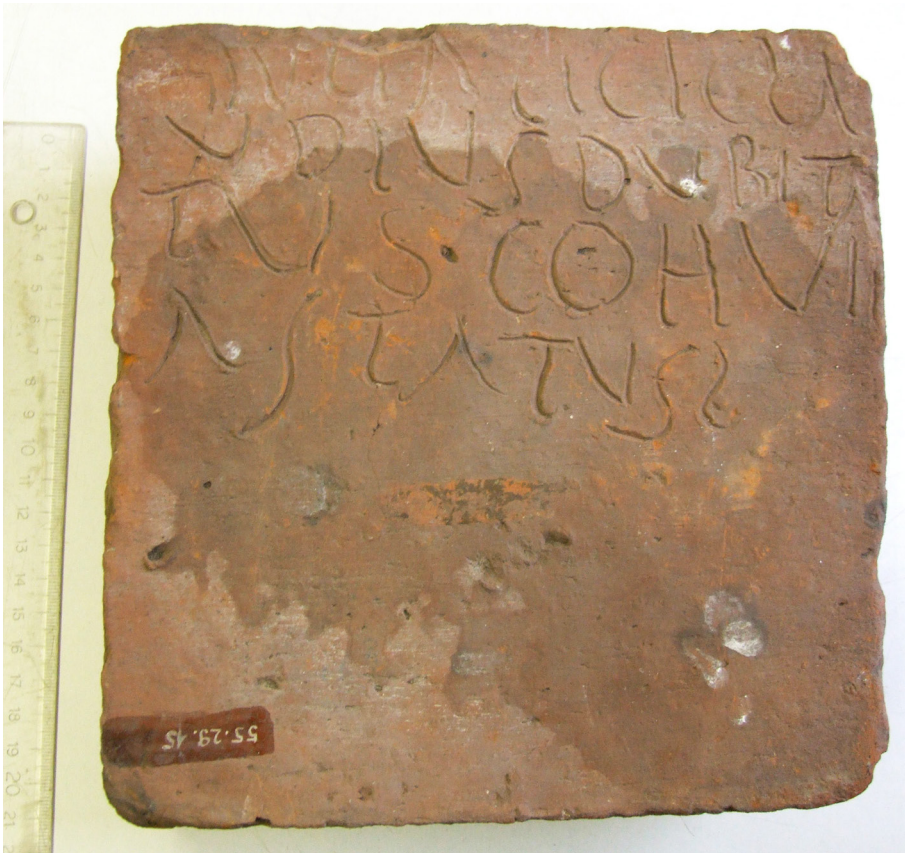
2. kép. TAq 1330

Az mindenesetre rejtély, hogy az utolsó jelet miért septimus -nak interpretálta, amikor a megfelelő görög számra alig hasonlít, semmi oka görög szám használatára, különösen hogy előtte korrektül leírja latinul, és egyáltalán minek ismételné? Ez a jel vagy egy nagyon csúnya L, vagy annak a jelnek a hanyag kézírása, melyet általában vagy centuria/o , vagy contra rövidítésének használnak. A centurio illenék is a szövegösszefüggésbe, tehát a legio 7. cohors (valamelyik) hastatus centuriójáról lenne szó, nagy kérdés azonban, hogy mi lenne az ő kapcsolata Licinius felszabadítottjával, az amúgy nem létező latin nevű Duliával, és így hogy vonatkoznék a dolog a gyártásra. Dehát ez az értelmezés 1950-ben született, amikor az ókortörténetnek is azt a fő feladatot szánták, hogy a rabszolgaság történetét tanúsítsa, magyarázza és következtessen belőle Marx Károly tanainak helyes voltára, és ennek a feladatnak Szilágyi becsülettel eleget is tett, ezért talált akkoriban megjelent írásaiban mindenütt rabszolga- és felszabadított-feliratokat, s e cikkében is igen érdekes – bár semmi esetre nem igaz – következtetéseket vont le a pannoniai rabszolgartartás történetére vonatkozólag. Az mindenesetre tény, hogy katonák az ilyen graffitin gyakran jelentkeznek mint a katonai téglüzem gyártói vagy ellenőrzői, és persze elvileg egy