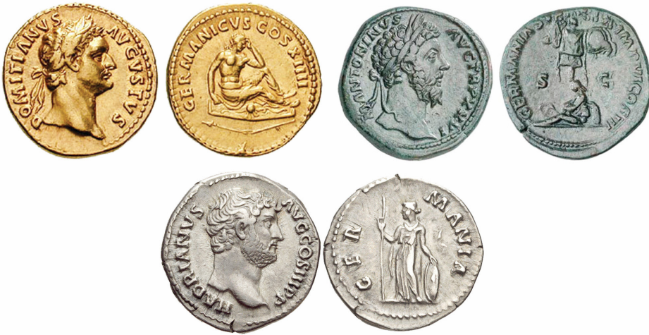
Römischer Aureus von Kaiser Domitian (88–89); Sesterz des Marc Aurel (172–173); Denar unter Kaiser Hadrian (134–138)

auf jegliche militärische Aktionen, um die Integration der Provinzen in die große Gemeinschaft voranzutreiben und das friedliche Zusammenleben im Imperium zu sichern.