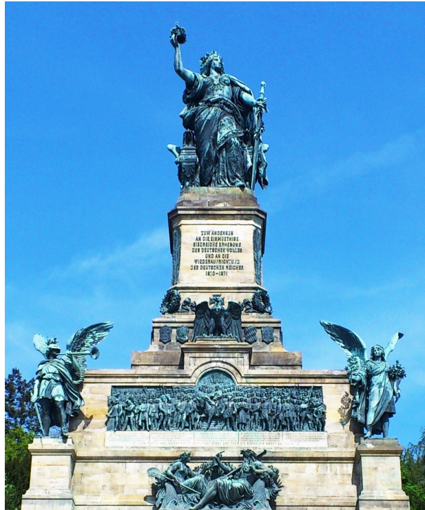
Germania auf dem Niederwalddenkmal (errichtet zwischen 1871 und 1883)

trüge wie sie. 21 Ein anderer Versuch, um die plastische Wirkung vollkommen zu machen, stammt von Rudolf von Gottschall, der das Wort an ein Germania-Denkmal richtet. Die Massivität, die in der Figur steckte, rief wie beim Atlasbild nach Materialisierung. Die Zahl der Statuen, die nach der Reichsgründung von der Kriegerin Germania inspiriert wurden, ist nicht genau zu beziffern. Die berühmteste ist jedenfalls das Niederwalddenkmal und mit einem Gruß an dieses 12,5 Meter hohe, in Erz gegossene Monument fängt Rudolf von Gottschalls Gedicht an: „Ich grüße dich Germania, / Auf deiner Bergeshalde!“ 22 Um den Eindruck von Gewaltigkeit zu steigern, wird das „Erzbild vom Niederwalde“ mit der zerbrechlichen, bleichen Loreley kontrastiert. Die eine Frauenfigur über dem Rhein verkörpert das Reich und die andere die Kunst, sie können ohneeinander nicht existieren: „Doch neben deutschen Thaten blühh! / Ja ewig die deutschen Lieder!“ 23