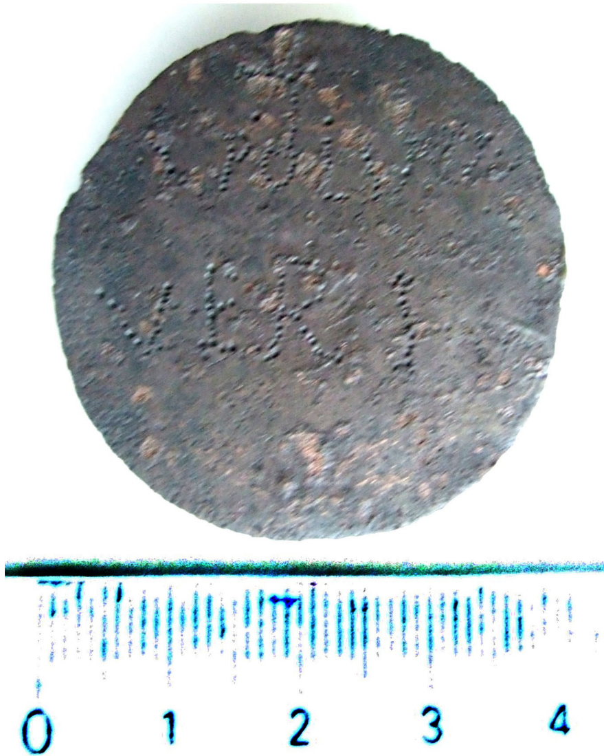
1. kép. TAq 1533

a részeit), de különböző időpontban és helyileg is elszórtan (az ún. 5. épületben, A árokban). Az öt közül csak egyen volt írás, a katonai felszerelési tárgyakon megszokott módon apró betűkkel egy nyilvánvaló használói/tulajdonosi jelzés beponcolva, és a szöveg két jól olvasható, azonosítható sorából a katonai összefüggés világos volt: