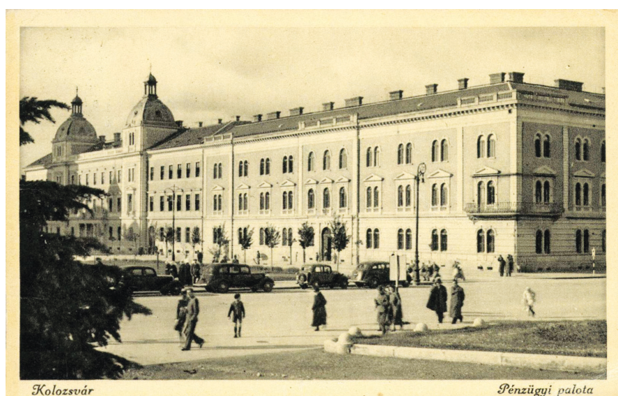
2. A kolozsvári Pénzügyi Palota