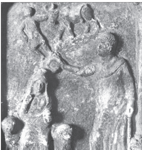
2. kép. Athéna Azzanathkona ábrázolása az istennő szentélyében.

Artemis egy másik keleti istennővel is azonosult. Szentélye (E7) eredetileg sémi bevándorlók alapítása lehetett, de idővel görögök is látogatták, akik Artemis Azzanathkona néven tisztelték az istennőt. A kultuszreliefen feltehetőleg a donátor látható, amint egy áldozati tálból valamit szór