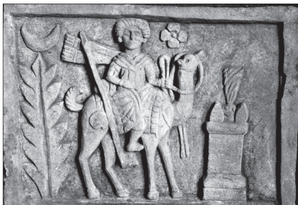
4. kép. Tevén lovagló Arsu isten. Relief Atargatis szentélyéből.

Még a parthus korszak vége előtt épült Zeus Theos temploma (B3). Az első felirat Kr. u. 121/122-ből származik. Eszerint Seleukos, Theomnéstos fia, Antiochos unokája, Európaios, aki a prótoi közül való, ajánlotta fel Zeus Theosnak a naost , a kapukat ( thyrómata ) és a képek festését ( eikonón graphén ). A naos valószínűleg nem a templom egészére, hanem egy új helyiség kialakítására utal. 30 Mindenesetre nagyarányú építkezéstről van szó. A felirat közelében egy datált oltáron Zeus nevének birtokos esete olvasható. 31 A templom egyik falfestményén Baribonneia, egy másikon egy fiú apjának, Bargatésnek a neve maradt fenn. 32 Egyik név sem görög. Egy magánházaiban talált ezüst ivóedényen olvasható a dedicatio , miszerint Séttabos, Adadiabothés fia ajánlotta fel a potériont Zeus Theosnak. A másodlagos lelőhelyen előkerült ivóedényt Kr. u. 232/233-ben ajánlotta fel Séttabos, 33 aki nem a város szülőtte. Mindez arra mutat, hogy ez a templom sem