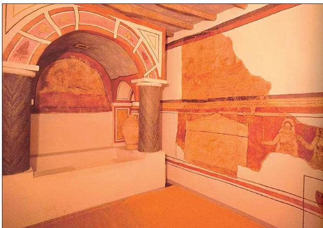
9. Domus ecclesiae. Keresztelő kápolna.

az időszámításunk első évtizedeiben épült, központi udvarból és a körülötte elhelyezkedő helyiségekből álló, két-szintes, peristylumos magánház, melyet Kr. u. 232–256 között teljesen átépítettek. Az alsó szinten egy nagyobb imatermet, egy keresztelőkápolnát és különböző vallási célokra szolgáló szobákat alakítottak ki. Az imaterem