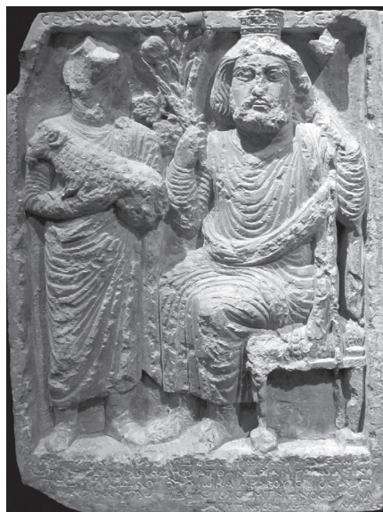
3. kép. Zeus Kyrios/Baalšamin. Kultuszrelief.