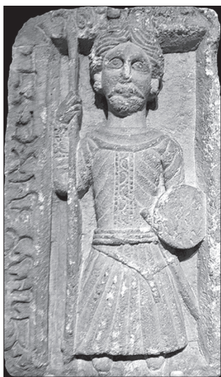
5. kép. Arsu isten kerek pajzzsal. Kultuszrelief.