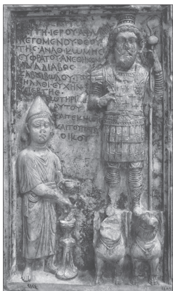
6. kép. Aphlad isten. Kultuszrelief.

ről azt mondják, hogy az Euphratés mentén fekvő Anath falu istene – maga, gyermekei és egész háza népe jóléte érdekében. 53