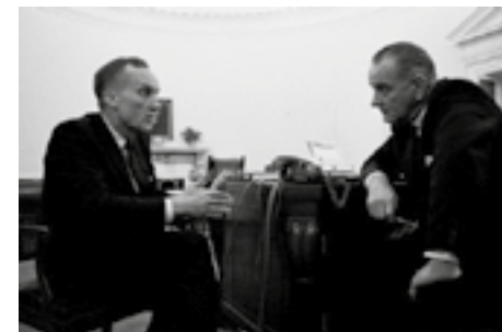
1. kép. Johnson és Mann

Vietnám kérdése került legtöbbször a kutatás fókuszába, a Latin-Amerika felé irányuló politikai tevékenységének részletes, levéltári kutatásokon alapuló összegzése még váratott magára. Jelen kötet azonban pótolja ezt a hiányt. A szerző a bevezetőben emellett foglal állást, hogy az Amerikai Egyesült Államoknak az 1960-as években Latin-Amerika irányába folytatott politikájának egyes aspektusait érintő értékeléseket felül kell vizsgálni