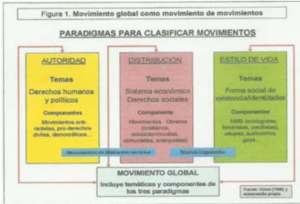
2. táblázat. A globális szerveződési rendszerellenes mozgalmak hálózata (Forrás: IGLESIAS: Multitud y acción colectiva post-nacional , 40)

Negri írásában részletesen elemzi az általa használt fogalmak tartalmát és a globálissá vált kapitalizmus viszonyai közötti érvényesülésük, illetve érvényesítésük feltételeit és körülményeit. Ellenállás alatt a mindennapi életben, az együttélés minden szintjén alkalmazott, társadalmi kommunikáció által is megegerősített nyomásgyakorlást ért. A felkelés Negri számára ennél jóval bonyolultabb dolgot jelent.