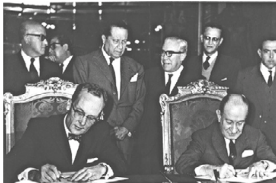
2. kép. A fényképen balra Thomas C. Mann, az USA mexikói nagykövete, jobbra Manuel Tello Baurraud, mexikói külügyminiszter látható, az El Chamizal-i Egyezmény aláírása alkalmával – Mexikóváros, 1963. augusztus 29.

legjelentősebb állomásához érkezett a Panama-csatorna szerződés újratárgyalása révén, és 1964. április 3-án a két állam közös nyilatkozatot írt alá, amelyben megállapodtak, hogy helyreállítják a diplomáciai kapcsolatokat.