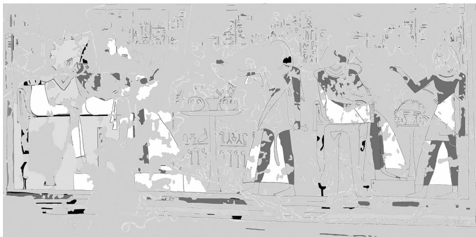
2. kép. A Dzsehutimeszt áldozó személyként ábrázoló jelenetek rajza

és részletmegoldásokat tartalmaz, ám mégsem azonos. Azt feltételezhetjük, hogy a művész több vázlatot is készített, és ezek egyike lehetett az osztrakonon látható rajz. Mégsem ezt a vázlatot dolgozta ki végül a sziklás falának festményén, hanem egy másikat. Ezt a változatot, az ásás során a közelben megtalált osztrakont pedig, mivel nem volt rá további szükség, eldobták.