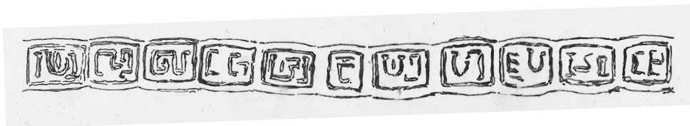
9. sz. ábra: felül az Ellend Szilfádülő 128. számú sírban talált ezüstgyűrű felirata Fehér Bence rajza (Fehér 2020, 196)

karakterek is ide értendők) mágikus erején alapuló II. századi varázsgyűrűk feliratai nem dekoratív célból kerültek az ékszerre, hanem címeztek az adott vallási elképzelésben konkretizált numen (például a Thebal-formula esetében a dwarf vagy elf ) volt 37 , aki számára az üzenet kristálytisztán érthető.