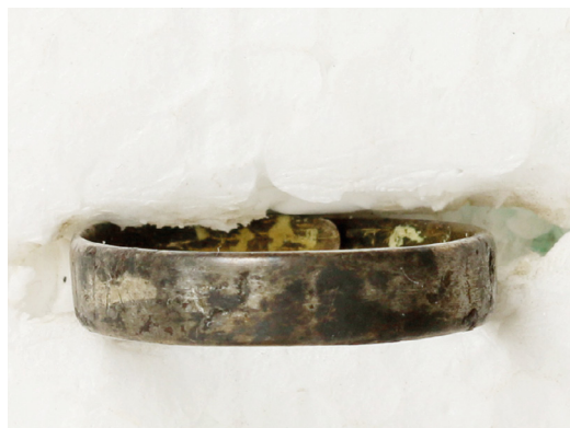
3, 4a és 4b. sz. ábra: az Ellend Szilfadűlő 70. számú sírjaiban talált ezüstgyűrű (felül), illetve a Palotabozsok 59. számú sírjában talált ezüstgyűrű (alul) fotói

két-két fülbevaló és egy-egy fűzött nyaklánc volt az elhunytak (egy gyermek, illetve egy felnőtt nő) halotti ékszere.