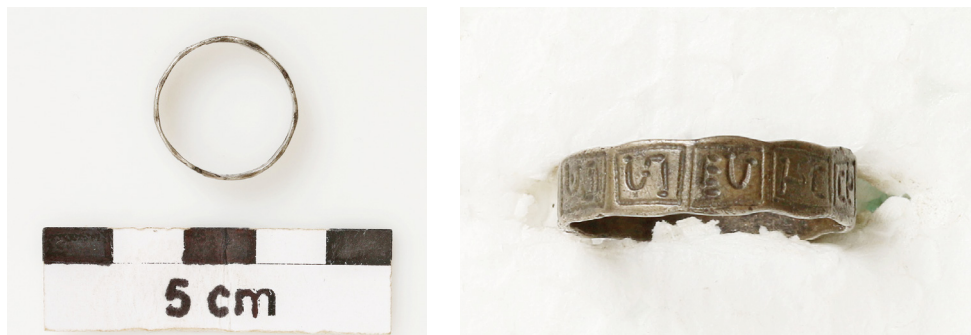
1–2. sz. ábra: az Ellend Szilfadűlő 128. számú sírban talált ezüstgyűrű felülnézeti és oldalnézeti fotója

A jobb kézfejen 5–6 mm széles ezüstlemezből készült, zárt gyűrű. A lemezvégeket egymásra hajlították és összeforrasztották. Az összeforrasztás látszik. Külső oldala tizenegyszögletes, a belső sima. A tizenegy szögletnek megfelelő, vonallal bekeretezett, négyszögletes lapocskákon írásjelekre emlékeztető, vésett jegyek vannak (XXVIII. t. 5, lsz: 3/74–1939). 4