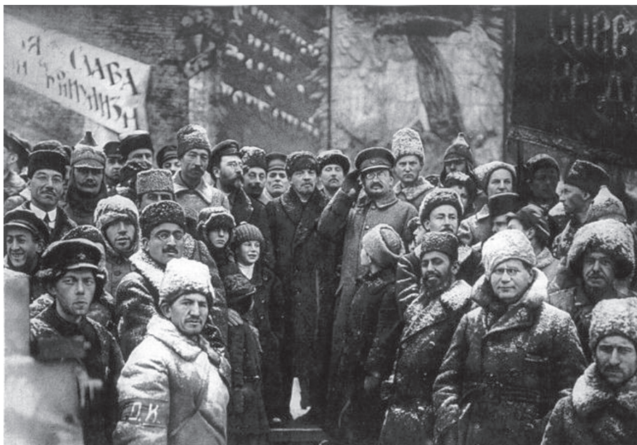
Kamenyev, Lenin és Trockij 1919-ben az októberi forradalom 2. évfordulóján

úgy „kötötte meg” a népi szmuta erőszakát, hogy átvette, kisajátította, megsokszorozta és végül maga a szmuta ellen fordította azt. Az 1917-es forradalomból létrejött szovjet állam – ez az anti-jogállam – ebben az értelemben fennállása egész időtartama alatt, beleértve legrosszabb, legembertelenebb időszakait is, népi állam volt: az 1905-ben és 1917-ben elszabadult népi erőszakot kötötte meg, terelte egy fejlesztési diktatúra medrébe; a népi elitellenességet és a szociális igazságosságról szőtt archaikus népi utópiát váltotta valóra; a szmuta elitellenes népi erőszakát fordította át a „népi állam” erőszakába, a népi erőszak államosításával zabolázta meg a népi erőszakot.