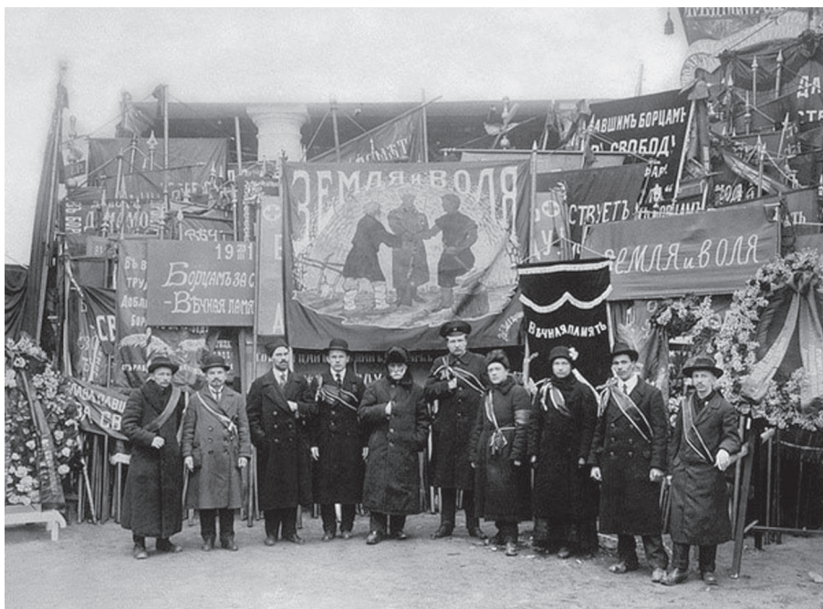
Az eszer gyászbizottság tagjai a forradalom mártírjainak temetésén

tanúja volt egy jelenetnek, amely jól mutatja, mit jelentett a jogrend, a társadalmi gátak és erkölcsi fékek megszűnése a nagy válság hisztérikus légkörében, hogyan vált a törvények kötéseitől és a morális parancsoktól is szabad tömeg vérszomjas fenevad-dá: „a tömeg által közösen leleplezett »nép ellenségeit« rituálisan megéget-ték: ha elkaptak valakit, vaságyra kötözték és vaságyastól máglyára vetették”. 5 Különösen sok tiszt halt kínhalált ezekben a napokban saját matrózai kezétől Kronstadtban. A balti flotta több tengerészisztet – 76 főt – veszített március 15-ig – a „nagy és vértelen” forradalom röpke pár hetében –, mint a Németországgal