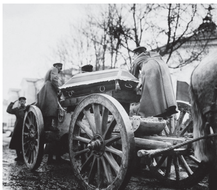
A forradalom mártírjainak temetése

A liberális februári forradalom elitje eltörölte a halálbüntetést, a parasztgyűléseken pedig már 1917. április elején halálos ítéletet követeltek a cárra, bár nem egészen úgy, ahogyan végül kivégezték teljes családjával együtt: „kobozzák el a néhai cár teljes vagyonát és minden tőkéjét... és állítsák őt a legszigorúbb ítélőszék elé, amelynek jogában áll akár halálbüntetést is kiszabni rá”. 7 A mozgásba jött nép és a hatalomra került politikai elit nem értették egymás nyelvét: az archaikus népi