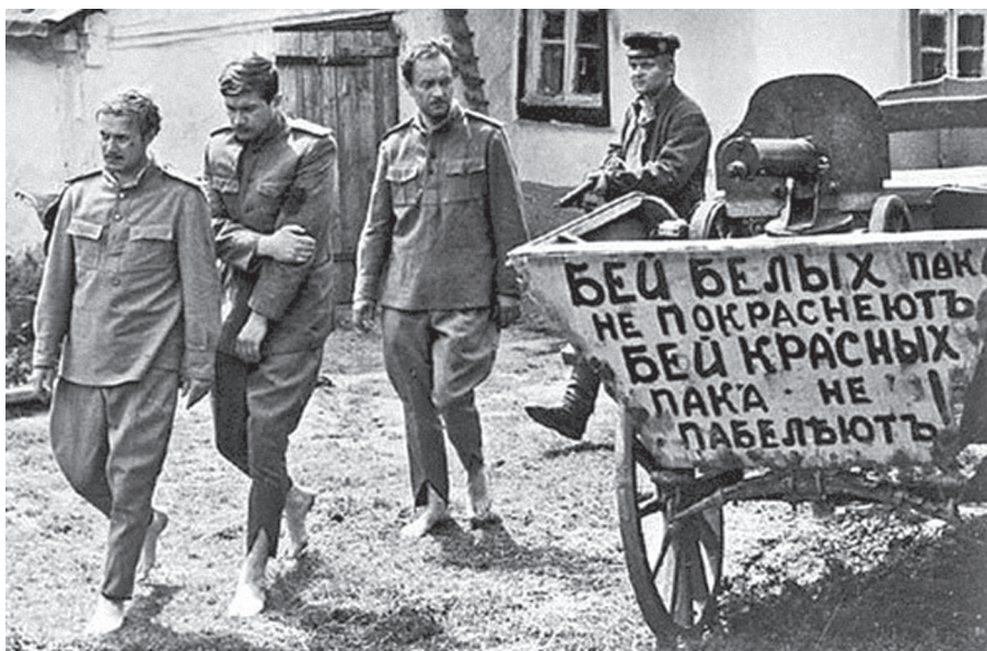
Anarchista jelszó. Üsd a fehéreket, míg bele nem vörösödnek, üsd a vörösöket, míg el nem fehérednek

kal egybefonódott felfordulásokat „rituális fosztogatásnak”, kiemelve, hogy „a rítus itt természetesen nem valamilyen kínos pontossággal követendő, meghatározott cselekvéssort jelent, inkább valamilyen lazán körvonalazható magatartást, egyfajta commedia del’arté-hoz hasonló forgatókönyvet. A fosztogatásokat olyan »antidramához« hasonlíthatjuk, amelyet »az utca színpadán« rögtönöznek.” 18 Ginsburg többek között a IV. (Carafa) Pál halálát követő eseményeket hozza például: „a tomboló jókedvtől elragadott tömeg” megostromolta „a Szentszék Via Ripetán álló palotáját, megsemmisítette az ott tárolt iratokat, kiszabadította a rabokat, felgyújtotta az épületet. Ezt követően még három napon át