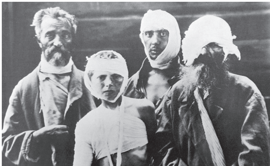
A zsmérinkai pogromok túlélői, 1920

banditák –, illetve az utcai magáncsőcselék kezébe került és jogilag korlátlanra vált. (Sem a sebtiben megszervezett milíciák, sem a vidéki városokban szerveződött Közbiztonsági Bizottságok, de még a szovjetek sem rendelkeztek ekkor tényleges, mozgósítható, bevethető erőhatalommal.) A cári autokrácia – 1905 után – mégiscsak bizonyos alkotmányos határok közé szorított, jogilag korlátozott önkénye helyére a semmi által – sem jog, sem erőszak által – nem korlátozott népi önkény , az utca zsarnoksága lépett. Különösen igaz ez a rendkívül erőszakos parasztforradalomra, amely az 1905–1907-es erőszakhullámot idézte, azzal a különbséggel, hogy most már nemcsak a nemesi udvarházakat gyújtották fel és rombolták porig, nemcsak az