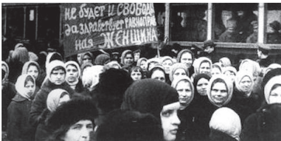
Nincs szabadság a nők egyenjogúsítása nélkül

Minden forradalmak e „legvértelenebbikének” végső mérlege azt mutatja, hogy az idillikus kezdet vértelensége olyan vérözönbe toroklott, amelynek alapján sokkal inkább minden forradalmak legvéresebbikének kellene neveznünk. A polgárháború négy éve alatt (1918-tól 1922-ig) elszenvedett összes veszteség nagyságrendileg: 13 millió ember. Ebben a keretszámban benne van 2 millió emigráns; 3–4 millióra tehető az 1918–1919 között spanyolnáthában elhunytak száma; tízfuszban 2,1 millióan haltak meg; az 1921-es éhínségben és járványokban, betegségekben