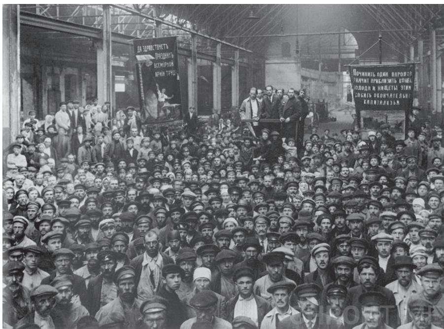
Gyári munkások 1919-ben

de mentalitásában és kultúrájában is inkább a bomló archaikus, mint a keletkezőben levő modern világhoz tartozott (ezt az archaikus paraszti mentalitást hordozta magában a parasztságból legfeljebb két nemzedékkel korábban kiszakadt, friss összetételű ipari munkásság zöme is). 26