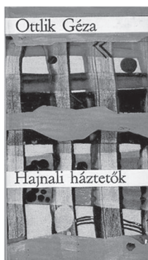
Magvető, Budapest, 1969