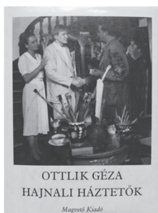
Magvető, Budapest, 1987