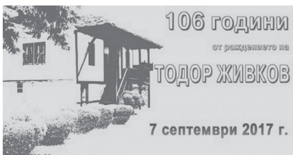
Meghívó a Zsivkov születésének 106. évfordulóján tartandó ünnepségre, Pravec, 2017. http://balkanec.bg/predstoyasheto-106-godini-ot-rozhdenieto-na-todor-zhivkov-36070.html

szov óvó tekintete előtt kezdődött, bár hivatalosan a BSZP és Pravec önkormányzata kezdeményezték. Az önkormányzat élén Rumen Gyninszki 2 BSZP-tag polgármester állt, aki zsvikovistának vallotta magát, és bizonyítottan a kommunista biztonsági erők ügynöke volt. Az első ilyen évfordulós ünnepség 2010-ben zajlott le Pravec-ben. Zsivkov akkor lett volna 99 éves. Szerény rendezvényt tartottak, a sajtó alig vett róla tudomást. A következő évben, a néhai diktátor centenáriumán már a