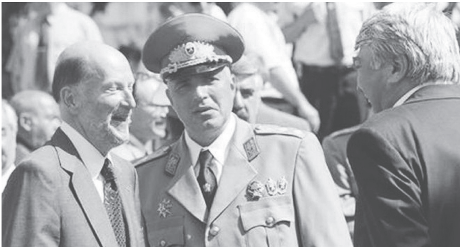
Szimeon Szakszkoburgotszki miniszterelnök és Bojko Boriszov belügyminisztériumi főtitkár, 2004. http://rf-smi.ru/evropa/18032-etot-smeshnoy-premer-bolgarii-boyko-borisov.html

Újra eljött szeptember 7-e. Idén, 2018-ban Zsivkov születésének 107. évfordulója esik erre a napra. A dátum kétszeresen is szimbolikus, hiszen egybeesik a „nagyyszerű atyuska” halálának 20. évfordulójával. Az EU és Bulgária zászlói ismét büszkén lengenek Pravecben, a Zsivkov-szobor mellett. Országos és helyi politikusok jelennek meg az ünnepségen, Zsivkov családtagjainak és elszánt híveinek társaságában. Törököt, romát vagy muszlimot nem hívtak meg, nem lennének szívesen látott vendégek. A kutya sem törődik az