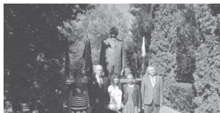
Unió és bolgár zászlók Zsivkov születésének 106. évfordulóján, Pravec, 2017. http://balkanec.bg/106-godini-ot-rozhdenieto-na-todor-zhivkov-36116.html