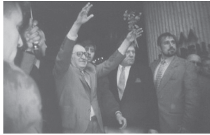
Bojko Boriszov testőr és a diadalmas Zsivkov Pravecban, 1995 május. http://www.desant.net/files/news/2012/08/06/134423680461485.jpg

elhunyt elődökre is kiterjesztették, s nem elég, hogy átírták a hivatalos születési, házassági és halálozási anyakönyveket, még a sírkövek feliratait is meg kellett változtatni. A megmaradt mecsetek legtöbbször szintén bezáratták. Betiltották az idegen, „bolgártalan” nyelvek – vagyis a török és a cigány – használatát, miként a „muszlim” viseletet, valamint a muszlim ünnepeket és eseményeket (ideértve a körülméletlenséget is). A névváltoztatás erőszakos kikényszerítése és a muszlim kultúra betiltása több tucat áldozatot követelt, majd szükségessé vált a dunai Belene-szigeten található sztálinista koncentrációs tábor újbóli megnyitása is. Viszont a Zsivkov-kormány bejelentette, hogy az 1985-ben megtartott utolsó (kommunista) népszámlálás szerint semmiféle etnikai, nemzeti, nyelvi vagy vallási kisebbség nem maradt Bulgáriában. Az országból „valóban tiszta” nemzetállam lett.