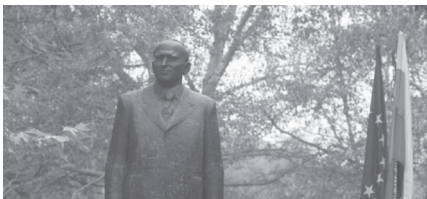
Az Európai Unió és Bulgária zászlaja Zsivkov születésének 105. évfordulóján, Pravec, 2016. http://balkanec.bg/pravets-chestva-105-godini-ot-rozhdenieto-na-todor-zhivkov-32288.html

Árulkodó jel, hogy a következő Zsivkov-évfordulók hivatalosan „nem hivatalos” megünneplésének hagyománya a miniszterelnök Bori-