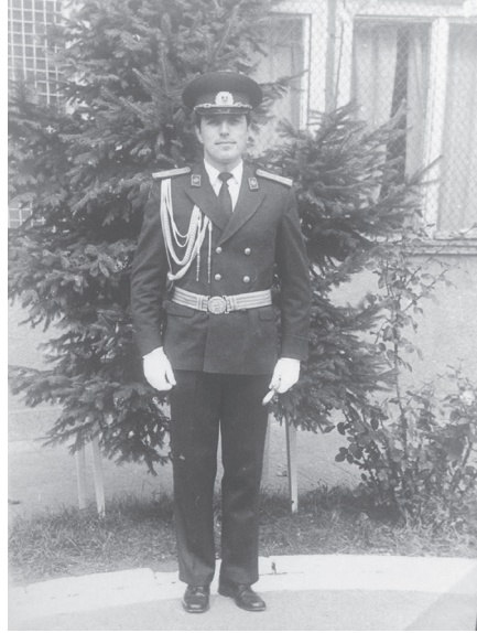
Bojko Boriszov hadnagy 1982-ben.

Interjúiban és beszédeiben Boriszov elismerően szokott szólni Zsivkovról, „a bolgár nép nagyszerű atyuskájáról”. 3 Úgy tűnik, Boriszov nem érzékeli, mennyire nevetséges ez az elnevezés, amely a mindent átfogó bolgár nacionalizmus jegyében összemossa a kommunista totalitarizmus, illetve a demokrácia markáns különbségeit, a szovjet uralom, illetve az európai integráció ellentétét. Zsivkov elsősorban amiatt bukott, mert a gorbacsovi peresztrojka piacbarát reformjainak gyors változásokat hozó korszakában rosszul irányította a bolgár gazdaságot.