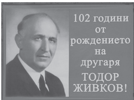
A plakáton: meghívó a Todor Zsivkov elvtárs születésének 102. évfordulója alkalmából rendezendő ünnepségre, Pravec, 2013. http://pirinsko.com/todor-jivkov-sam-si-opredelq-rojdeniq-den-25380.html