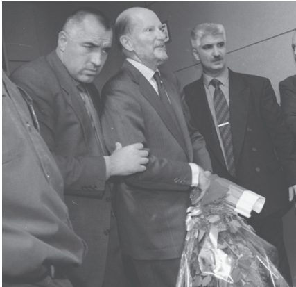
Bojko Boriszov testőr és II. Szimeon ex-cár. http://www.alarmanews.com/с-много-хигър-ход-премисра-бойко-борис/

kai tisztogatása Európában. (Ellentétben az említett háborúkkal, ez a tisztogatás Bulgárián kívül teljeséggel feledésbe merült, sőt a legelső monográfiát is csak 2018-ban publikálták róla.) 4 A száműzöttek augusztusban elkezdtek óvatosan visszaszivárogni, s miután Zsivkovot kommunista kollégái 1989. november 10-én elmozdították a hatalomból, a folyamat felgyorsult, végül nagyjából az elűzöttek fele tért haza.