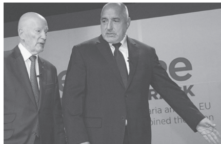
A korábbi cár és miniszterelnök találkozása korábbi testőrével, a hivatalban lévő miniszterelnökkel, 2017. http://glasove.com/categories/komentari/news/caryat-sklyuchi-sdelka-sborisov-vliyanie-sreshtu-imoti

Tudtommal Bojko Borisov az egyetlen olyan vezető politikus az Európai Unió tagországaiban, aki előre megfontolt szándékkal, szégyentelenül dicsőíti egy etnikai tisztogatás irányítóját. Mi több, engedi, sőt bátorítja egy totalitárius diktátor személyi kultuszát, amely oda nem illő módon virágzik az EU zászlaja alatt. Kérdés, hogy ez most felháborító botrány-e, vagy az új politikai vonal, melyet vakon követ az Unió? Miért nem tiltakozik Brüsszel? Vagy arra kell felkészülnünk, hogy egy szerb vezető nemsokára hivatalosan fog ódákat zengeni a népirtó Slobodan Miloševićről, esetleg egy olasz