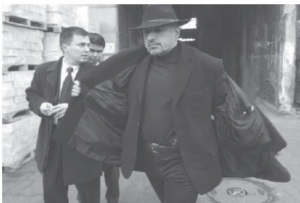
Bojko Boriszov üzletember az átmenet idején. http://razuznavane.com/?p=16910

kai tisztogatása Európában. (Ellentétben az említett háborúkkal, ez a tisztogatás Bulgárián kívül teljeséggel feledésbe merült, sőt a legelső monográfiát is csak 2018-ban publikálták róla.) 4 A száműzöttek augusztusban elkezdtek óvatosan visszaszivárogni, s miután Zsivkovot kommunista kollégái 1989. november 10-én elmozdították a hatalomból, a folyamat felgyorsult, végül nagyjából az elűzöttek fele tért haza.