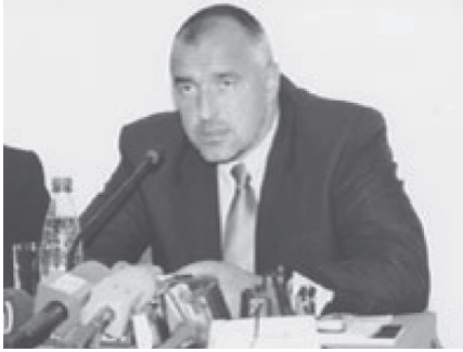
Bojko Borisov, Szófia főpolgármestere, 2005. http://www.factor-news.net/index_php?cm=2&ct=1&id=5891

érzéseikkel, és a véleményüket sem kéri ki senki. Egy árva török tan nyelvű kisebbségi iskola sincs Bulgáriában. A törvény diszkriminatív alkalmazása miatt gyakran a földdel teszik egyenlővé a romák házait – tősgyökeres bolgárokkal szemben sohasem járnak el így. Rossz szemmel néznek azokra, akik törökül vagy cigány nyelven szólnak meg nyilvános helyen. Egyfelől Borisov miniszterelnök rendre kárhóztatja a kommunizmus bűneit, beleértve az 1989-es etnikai tisztogatást. 7 Másfelől tudja, hogy a választók csendes többsége bolgár nemzetiségű, s ők továbbra is az etnikailag „tisza” Bulgária zsvikovi elképzelésének bűvkörében élnek. Borisov hallgatlagosan legalább annyira egyetért a praveci ünnepléssel, mint amennyire vonakodik szót ejteni arról az időszakról, amikor – 1982-től 1990-ig – a kommunista Bulgária Belügyminisztériumában szolgált, hadnagyi rangban. Lehetetlen, hogy a hivatalban