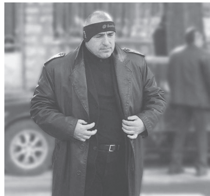
Bojko Boriszov, a Belügyminisztérium főtitkára, 2003. http://e-vestnik.bg/16071/prisadana-ot-strasburg-sreshtu-borisov-e-samo-nachaloto/ ; https://www.mediapool.bg/boiko-borisov-e-noviyat-kmet-na-sofiya-news110798.html

Sem Zsivkovot, sem kormányának tagjait nem vonták felelősségre az etnikai tisztogatás miatt. A korábbi Jugoszlávia miatt létrehozott hágai Nemzetközi Törvényszék (ICTY) 1993-ban alakult meg, mikor még dúltak a jugoszláviai háborúk, de hasonló törvényszék gondolata Zsivkovék 1989-es tetteivel kapcsol-