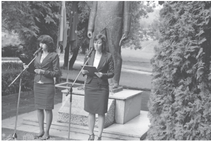
Zsivkov születésének 103. évfordulója uniós és bolgár zászlóval, Pravec, 2014. http://balkanec.bg/galeria/v-pravec-otbelqzaha-103-godini-ot-rozhdenieto-na-todor-zhivkov-1462.html

korábban ismeretlen munkanélküliség, s gyors növekedésnek indultak a társadalmi egyenlőtlenségek, Zsivkovból keresett szónok lett. Hatalomvesztése után ő jelképezte a „rég, szép kommunista időköt”. Rajongói szemében a kommunizmus egyetlen jelent Zsivkov 35 évig tartó uralkodásával. A volt főtitkár haláláig keresztül-kasul utazgatott az országban, és látogatásai csak nevükben voltak „nem hivatalosak”. Minden lépését újságírók követték, akik gondosan lejegyezték bölcs kijelentéseit. A „magánembert” tömegek fogadták „ősi szláv szokás” szerint kenyérral és sóval – miként ez az egykori szovjet tömbben is hagyomány volt. Virágzott Zsivkov váratlanul kitört személyi kultusza. Ezek az útjain a bukott vezetőt mindig elkísérte, segítette és tapintatosan irányította Boriszov, amiről rengeteg sajtófóto tanúskodik. S míg Zsivkov strómanokkal megíratott Összegyűjtött műveinek 39 kötete (átlagban több mint