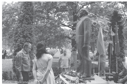
Zsivkov születésének 104. évfordulója az Európai Unió és Bulgária zászlóival, Pravec, 2015. http://balkanec.bg/galeria/v-pravec-otbelqzaha-104-godini-ot-rozhdenieto-na-todor-zhivkov-1971.html

Uralma idején Zsivkov jellegtelen apparatcsik volt, aki szervilisen hajlongott a Kreml urai előtt (odáig is elment, hogy kétszer, 1962-ben és 1973-ban kérelmezte Bulgária tagállami felvételét a Szovjetunióba!), most végre a nagy nehezen megszerzett népszerűségben sütkérezhetett, őszintén rajongott érte a „saját” nemzete. Azok, akik „igazságtalanul és eléggé el nem ítéhető módon” megfosztották hatalmától, letartóztatták és bíróság elé állították, a posztkommunista közvélemény szerint végül is hibát követtek el. Zsivkov tisztán állhatott népe előtt, és az emlékiratait is ilyen emelkedett hangon fejezte be: „Én, Todor Zsivkov, a rendelkezésemre álló minden hatalmat népem javára fordítottam”.