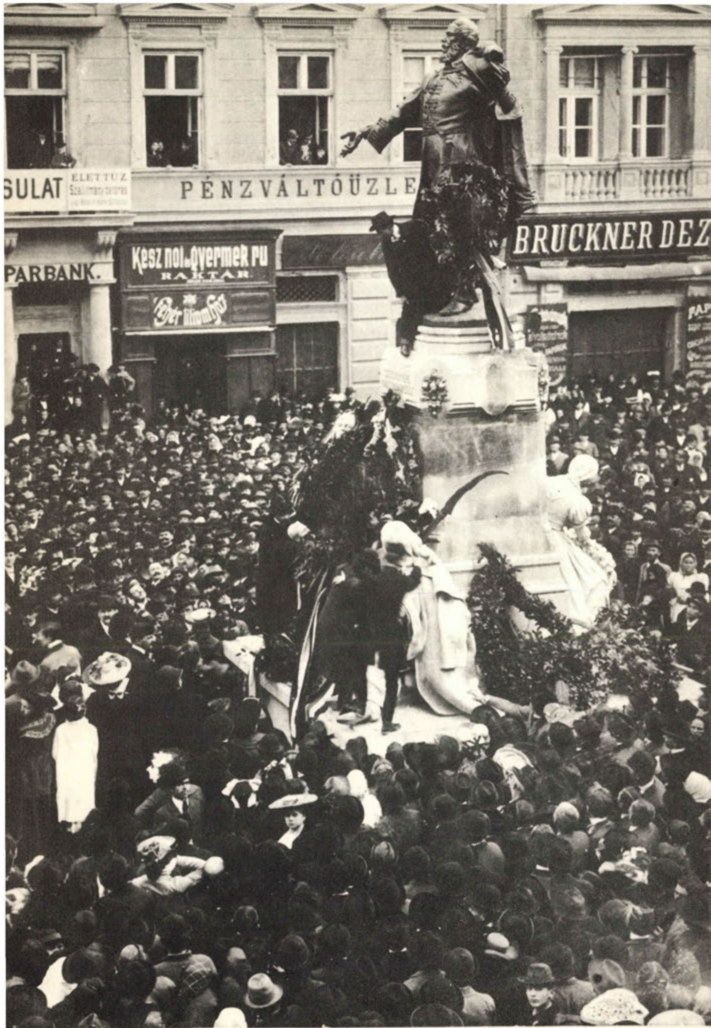
Keglovich Emőke Fényképész és festő Szeged