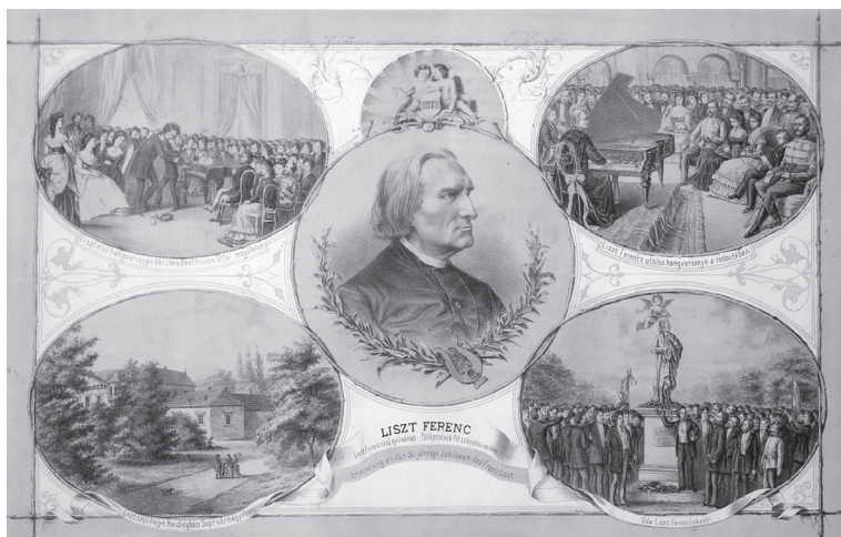
Emléklap Liszt Ferenc ötvenéves művészi jubileumára. Színezett litográfia. Készült Halász István nyomdájában. Pest, 1873. 44,4 x 60,3 cm (Liszt Ferenc Emlékmúzeum, Budapest)

A beethoveni Weihekuss történetének utolsó fázisához tartozik, hogy végül megjelent a Liszt-ikonográfiában. Fontos maga a kontextus is: az eseményt 1873-ban, Liszt 50 éves művészi jubileumára Magyarországon kiadott litografált emléklapon ábrázolták. 37 Az emléklap középpontjában Liszt profil portréja látható kör alakú mezőben, körülötte jobbra és balra két-két ellipszis formájú mező, amelyek ábrázolásai a zeneszerző múltját és jelenét szándékoznak sűrítetten bemutatni. Liszt honnan indult és hova