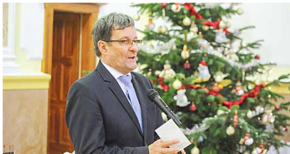
Vinczek György az élelmiszer-csomagok átadásán

Kispesti Szociális Szolgáltató Centrum és munkatársai felé. Az 5000 forint értékű élelmiszer-csomagokat a szociális centrum munkatársai állították össze a zömében gyermekes családoknak. Az önkormányzati ajándék mellé az Országos Gyermekvédelmi Liga tartós-élelmiszer-csomagját is megkapta a 40 család, amelynek mindegyike rendszeresen részesül szociális támogatásban az önkormányzattól, ügyfele a szociális centrumnak, és megkapta a 15 ezer forintos rendkívüli év végi támogatást is – tájékoztatta lapunkat a rendezvény házigazdája, Vinczek György alpolgármester.