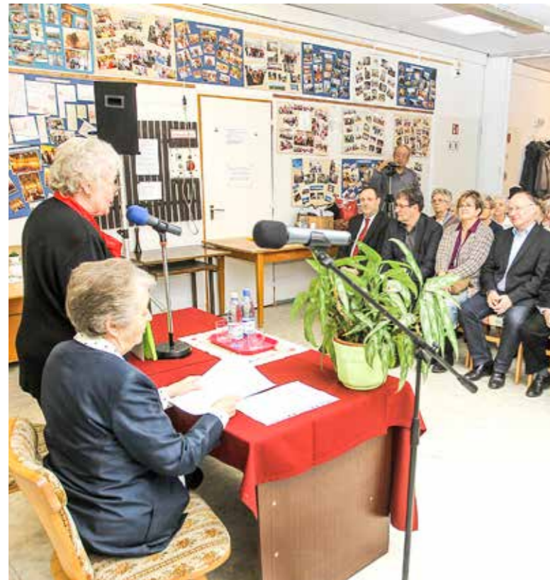
Évértékelőt tartott a MASZSZ alapszervezete