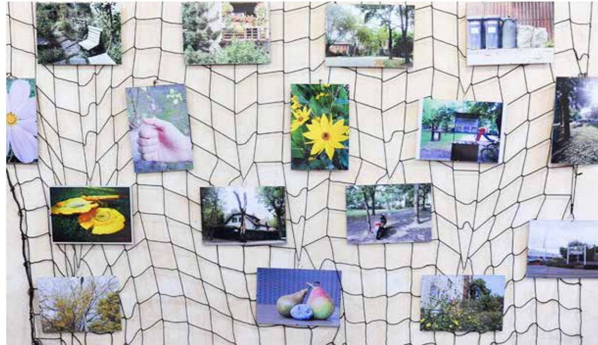
Egyre színvonalasabb munkák érkeznek a fiataloktól

A Városi ember és a környezet című fotópályázat anyagából nyílt kiállítás a Kispesti Városháza Tárlaton. A képeket február közepéig tekinthetik meg az érdeklődők.