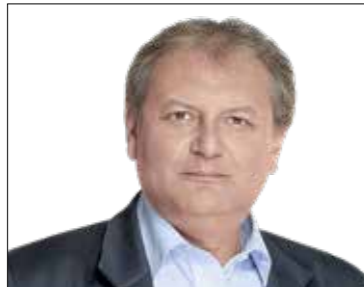
DR. HILLER ISTVÁN országgyűlési képviselő (MSZP)

Következő fogadóóráját 2019. június 13-án, csütörtökön 17 órától tartja a kispesti MSZP-irodában (XIX., Kossuth Lajos utca 50.). Előzetes bejelentkezés nem szükséges