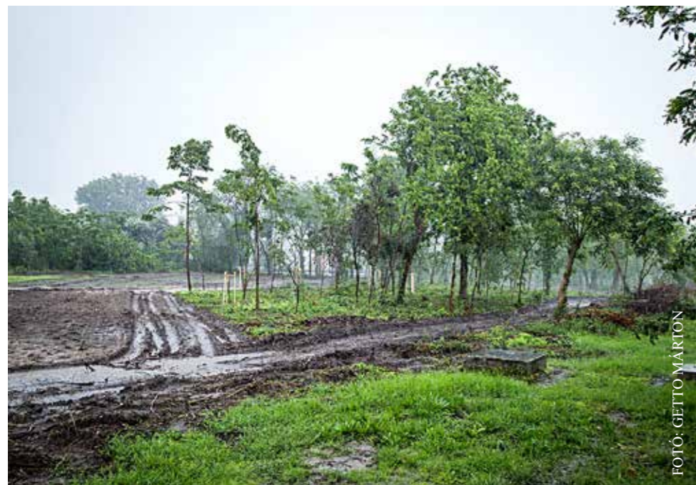
Egészében megújítják a háromhektáros erdőterületet

da vizesblokkjainak teljes felújítása: a 25 millió forintos beruházás eredményeként immár mind a hat fürdőszobában új eszközöket használhatnak az óvodások. Kispeszt polgármestere arról is beszámolt, hogy az önkormányzat több mint 52 millió forintot nyert a Gyöngykagyló óvoda energiahatékonysági felújítására az Innovációs és Technológiai Minisztérium által a közép-magyarországi régió települési önkormányzatai számára kiírt pályázaton. Így saját forrás kiegészítésével még jelentősebb átalakítás indul hamarosan ebben az intézményben is.