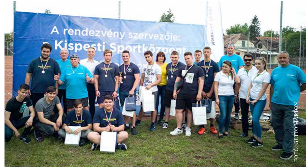
Örökre a ganzos diákoknál maradhat a vándorkupa

Bár a változékony időjárás visszavetette a vállalkozói kedvet, mégis kilenc helyszínen csaknem 450-en mozogtak legalább 15 percet az egészségükért a Kihívás Napján Kispesztben.