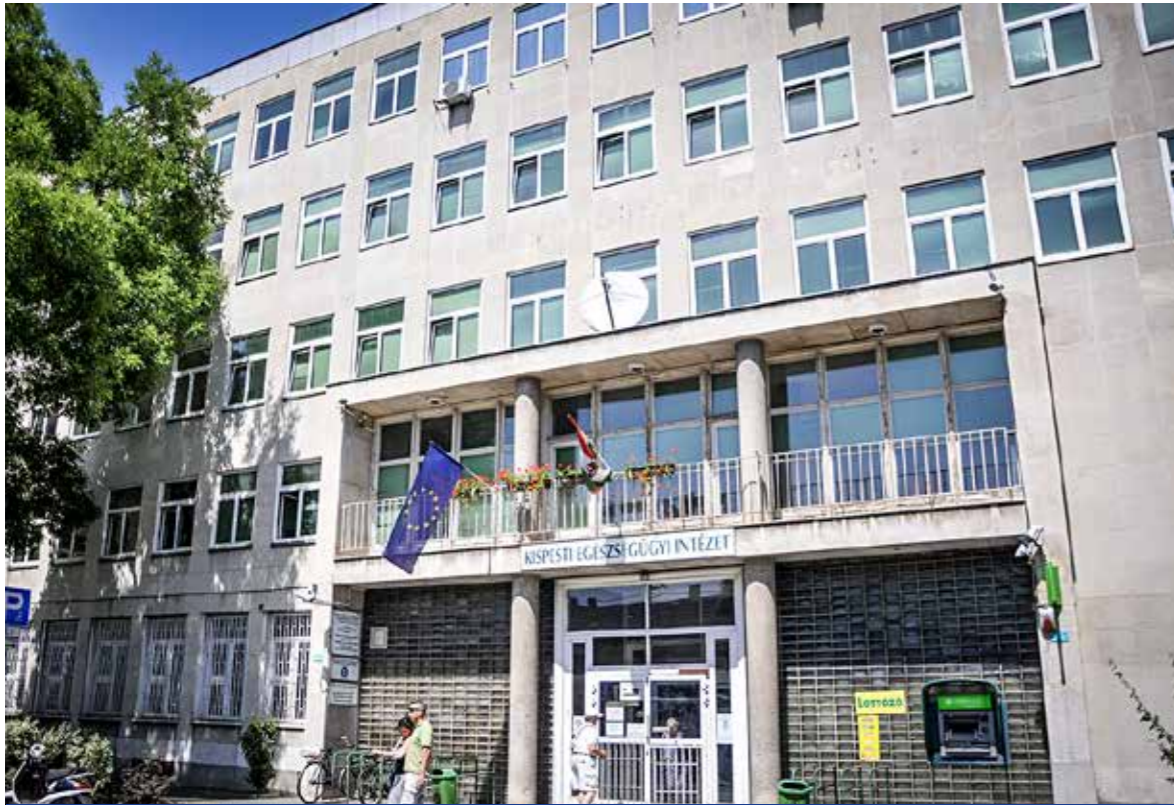
Teljesen átépítik a szakrendelő betegfogadó terét

Mintegy 160 millió forintos önkormányzati támogatásból megkezdődik a Kispesti Egészségügyi Intézet betegfogadó terének teljes felújítása. Az intézmény munkatársai mindent megtesznek annak érdekében, hogy az átépítés ideje alatt is zavartalan legyen a betegellátás.