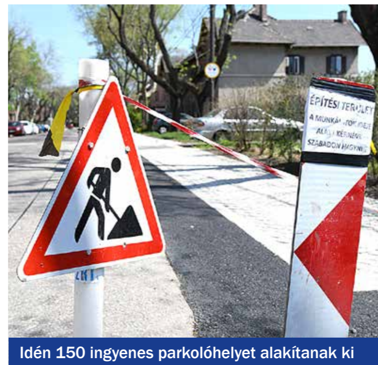
Idén 150 ingyenes parkolóhelyet alakítanak ki

Kerékpárosbarát fejlesztések Kispeszt Önkormányzata 350 millió forintos uniós támogatást nyert a kerékpárosbarát közlekedés és úthálózat fejlesztésére, ennek megvalósításához átfogó, a kerület egészére kiterjedő Kerékpáros Hálózat-forgalmi Tervet készített széles társadalmi egyeztetés mellett. A projektben az önkormányzat konzorciumi partnere a Budapesti Közlekedési Központ Zrt., a konzorcium vezetője Budapest Főváros Önkormányzata. Az idén záruló projekt a mindennapi, ún. hivatásforgalmi utak fejlesztését célozza, emellett a szomszédos kerületek, illetve a belváros felé irányuló kapcsolatokat erősíti. Biztonságos kerékpárutak és kerékpártárolók építésére, valamint szemléletformáló programok szervezésére egyaránt lehetőség nyílik.