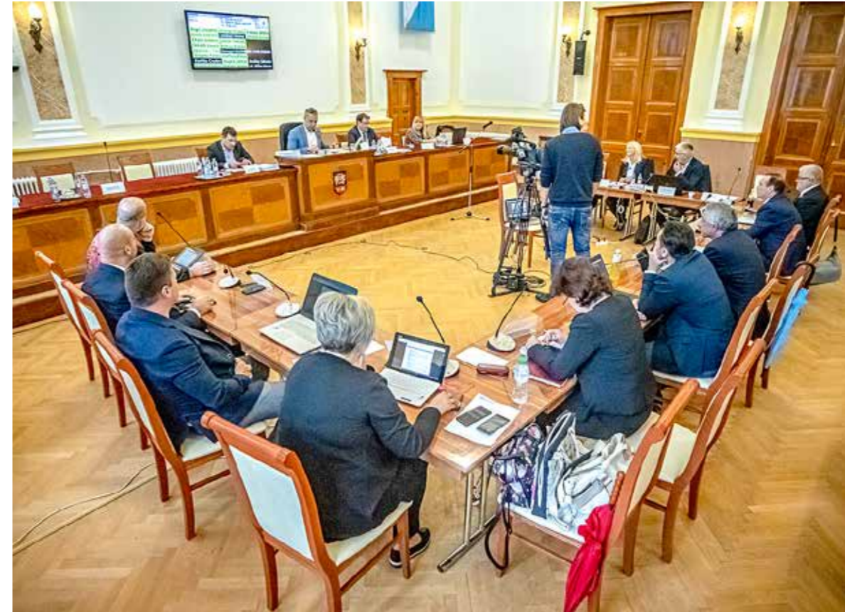
Több rendeletet is módosított a képviselő-testület

A költségvetési, a társasház-felújítási és a közterület-használati rendeletek módosításáról, valamint a Berzsenyi utcai felnőttorvosi rendelő felújításához benyújtandó pályázatról is döntött májusi ülésén a képviselő-testület.