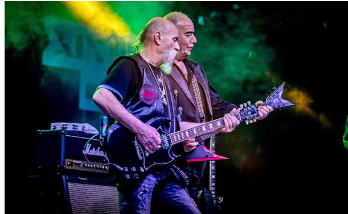
A 40 éves Karthago koncertje zárta a hétvégét

Tizenkettedik alkalommal rendezett városünnepet az önkormányzat és a KMO Művelődési Központ június első hétvégéjén. Több ezren ünnepelték Kispeszt 148. születésnapját a Templom téren.