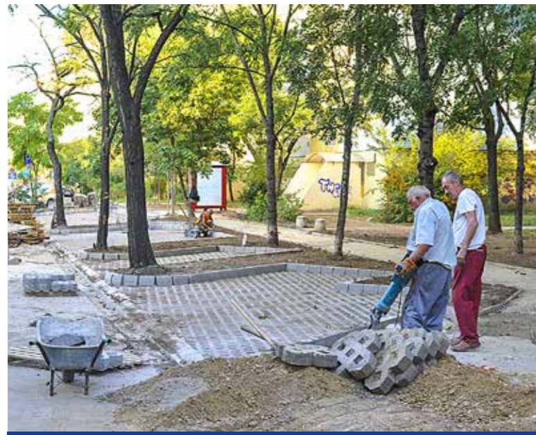
Több mint 330 parkolóhely létesült a ciklusban

Az önkormányzat évről évre magasabb összeget fordít a kerület tulajdonában lévő utak és járdák karbantartására és kátyúzására, valamint út- és járdaszakaszok építésére, felújítására. A parkolóépítési program keretében, több mint 200 millió forintból idén 150 ingyenes parkolóhely kialakítását, építését tervezik Kispesztben.