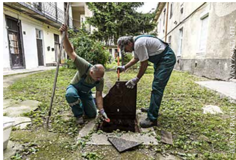
Munkában a Bábolna Bio munkatársai

Bio Kft.-vel kötött egyedi szerződés alapján. Budapesten 47 éven keresztül a Bábolna Bio végezte a patkányirtást, de a Fővárosi Önkormányzat 2018-ban az RNBH Konzorciumot bízta meg az irtási munkálatokkal. A patkányészlelések számának növekedése miatt az irtásra szánt évi 260 millió forintot év végén 650 millió forintra emelték. A pluszforrással együtt 910 millió forintba kerülő patkánymentesítést korábban ennek kevesebb mint harmadából megoldotta a Bábolna