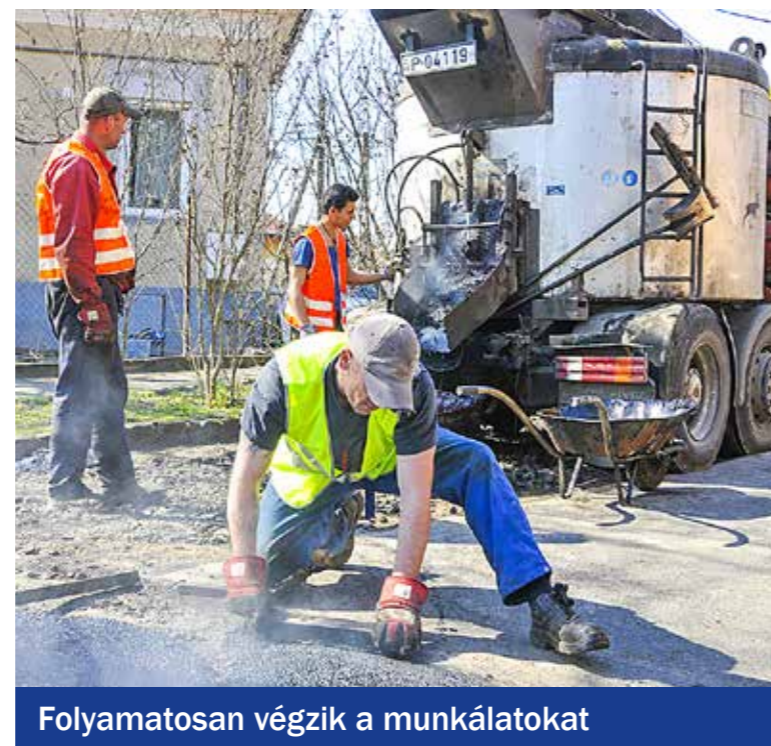
Folyamatosan végzik a munkálatokat

végeztek 2016-ban a Gomb, a Vak Bottyán, az Esze Tamás és a Temesvár utcában. Huszonegy férőhelyes, ingyenes parkolót alakítottak ki a Simonyi Zsigmond és a Bartók Béla utca sarkán, a Kispesti Uszodával szemben, és parkolók épültek a Petőfi, a Körző és a Beszterce utcában is. Az önkormányzat 2016-ban is több mint százmillió forintot fordított a kezelésében lévő utak és járdák karbantartására és javítására. A Fővárosi Önkormányzat Tér_Köz városrehabilitációs pályázatán 246 millió forintot kapott az önkormányzat a Kossuth téri piac és a Trefort szakgimnázium közötti tér megújítására. Az önerővel együtt összesen még 110 millió forint saját