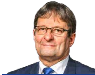
VINCZEK GYÖRGY alpolgármester (MSZP-DK-Együtt-PM)

12. sz. választókerület Alpolgármesteri fogadóórája: Minden hónap második szerdáján 13.00–16.00 óra között, telefonos egyeztetés alapján (347-4523) Polgármesteri Hivatal, Városház tér 18-20. Képviselői fogadóórája: Minden hónap harmadik hétfőjén 17.00–18.00 óra között Kertvárosi Közösségi Ház (Temesvár u. 117.)