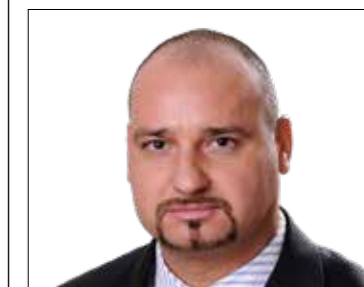
LÁZÁR TAMÁS Listás képviselő (Jobbik)

Telefonos egyeztetés alapján (06-20-490-0727) Polgármesteri Hivatal, Városház tér 18-20., A ép. II/71.