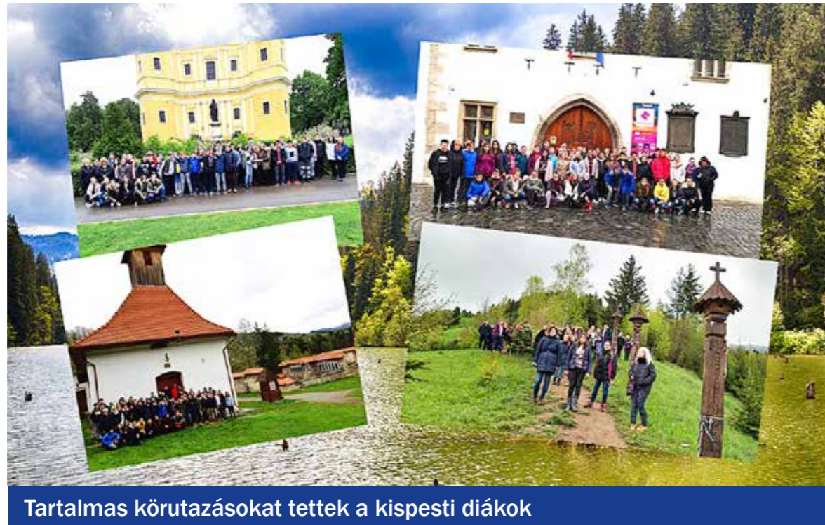
Tartalmas körutazásokat tettek a kispesti diákok

Élményekben gazdag programokon vehettek részt a Kispesti Vass Lajos Általános Iskola és a Kispesti Bolyai János Általános Iskola hetedik osztályos diákjai a „Határtalanul” programnak köszönhetően.