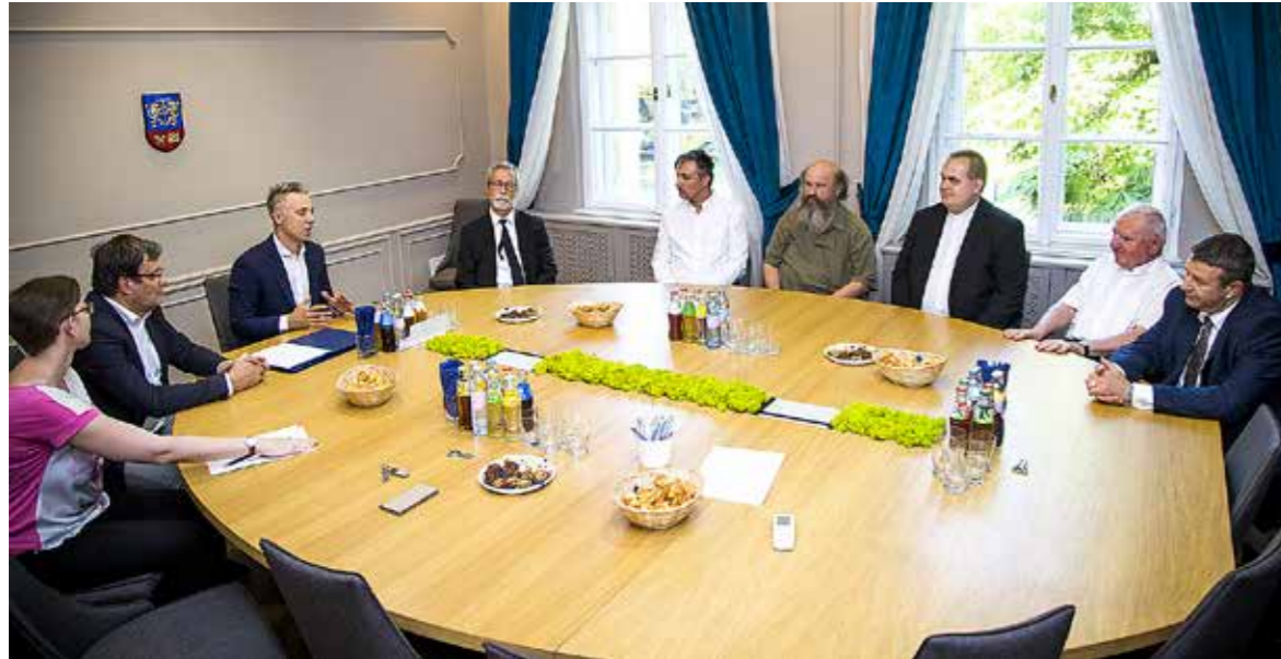
Egyházak kispesti vezetői az adománylevelek átadásán

Összesen hatmillió forint önkormányzati támogatásra pályázhattak a kerületben működő egyházak épületeik, ingatlanjaik felújítására, fejlesztésére idén is. Az erről szóló adományleveleket a Városházán adta át Gajda Péter polgármester.