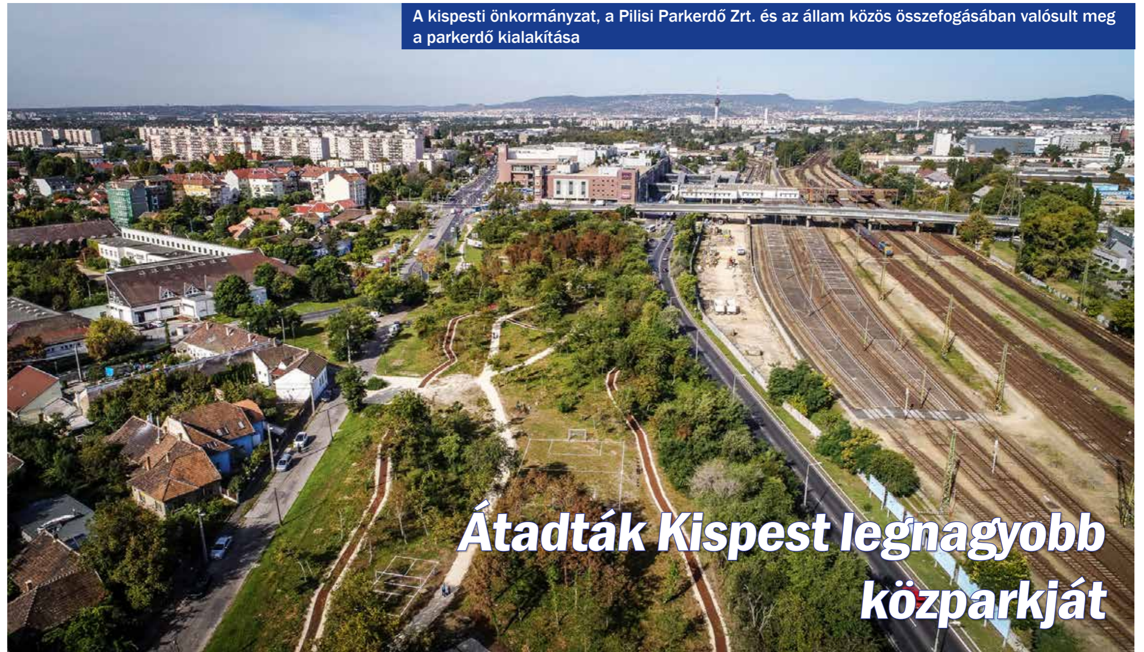
A kispesti önkormányzat, a Pilisi Parkerdő Zrt. és az állam közös összefogásában valósult meg a parkerdő kialakítása