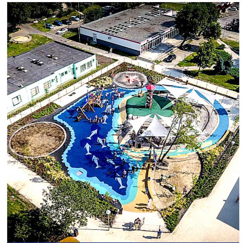
Rendkívül népszerű a vizes játszótér

A 2018. évi Tér_Köz pályázaton nyert 100 millió forintból és az önkormányzat 53 milliós kötelező önrészből a KÖKI melletti egykori KRESZ-park területe újult meg a közösségi tervezésben elkészült koncepciótervek alapján. A főváros ál-