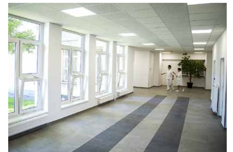
Tágasabb, jobb hangulatú lett a földszinti rész