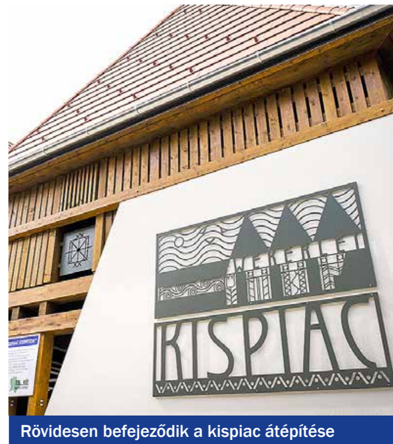
Rövidesen befejeződik a kispic átépítése

A Közösségi Költségvetés projekt keretében a kispestiek 2017-ben összesen 16 millió, 2018-ban 30 millió, 2019-ben 42 millió forint felhasználásáról dönthettek közvetlenül. Közösségi költségvetésből valósult meg Hagyományos Kispesten az Esze Tamás, a Kossuth Lajos és a Zrínyi utca járdáinak felújítása, a Vásár tér további fejlesztése, Felső-Kispesten a Vasút utca aszfaltozásának tervezése és engedélyeztetése, a Puskás Ferenc Általános Iskola udvarának felújítása, Wekerletelepen a Bárczy István téri játszótér felújítása és futókör építése, a Győri Ottmár téri kutyafuttató kialakítása, Kertvárosban a Karton utcai játszótér felújítása és szabadtéri kondigépek telepítése, a Mézeskalács óvoda udvarának felújítása és a fásítási program elindítása.