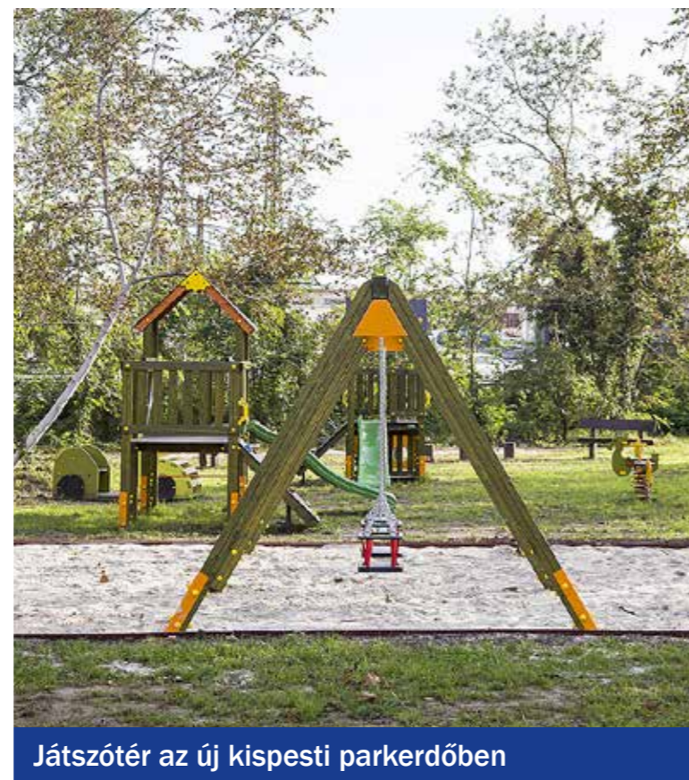
Játszóter az új kispesti parkerdőben

lió forint támogatást nyert az önkormányzat a Jézus Szíve templom környezetrendezésére a Fővárosi Önkormányzat Tér_Köz pályázatán, a projekt keretében, összesen 26 millió forintból teljesen megújult a templom előtti tér. Az önkormányzat a Wekerlei Társaskör Egyesülettel együttműködve valósította meg az Almavirág tér 19 millió forintba kerülő felújítását. Az Ady Endre út 114–116. alatt új, háromezer négyzetméteres közparkot alakítottak ki 10 millió forintból. Elindult a lakótelepi szalag- és pontházak közötti régi játszótérek, parkok felújítását célzó önkormányzati mintaprojekt, amelynek keretében pihenőparkká alakították át a Dobó Katica és a Kazinczy