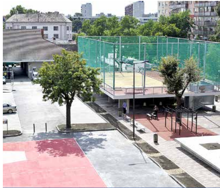
Egyedülálló közösségi tér a Kossuth téren

Az elmúlt években is több jelentős fejlesztést tudott elkezdni, illetve számos korábban elindított munkát fejezett be az önkormányzat. Összeállításunkban a Kispeszt életében meghatározó szerepet játszó közterületi beruházásokat és az idén záruló kiemelt projekteket mutatjuk be.