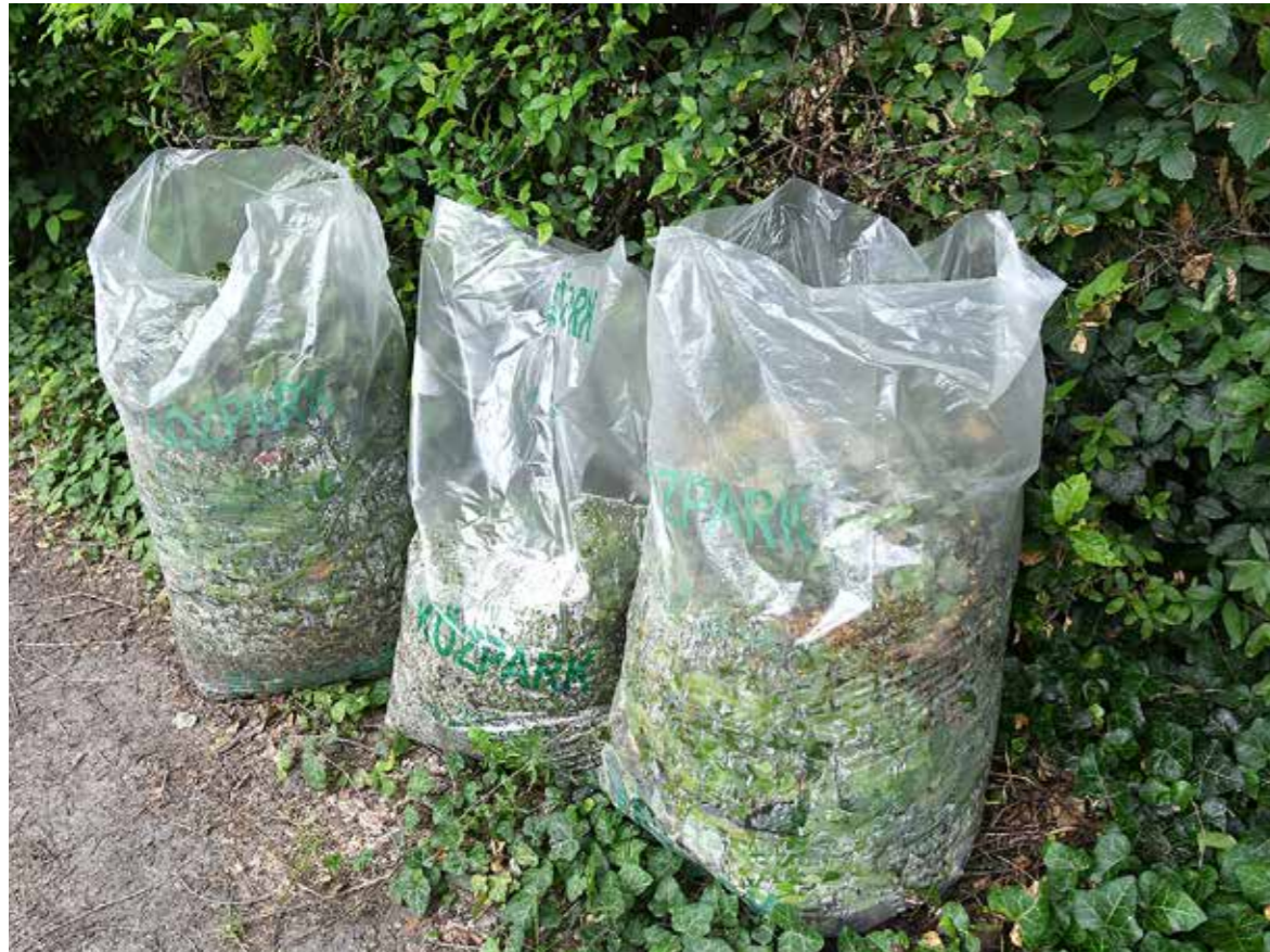
Az összegyűjtött zöldhulladékot komposztálják

Kifejezetten erre a célra árusított zsákokban szállítja el az udvarokban keletkező zöldhulladékot az FKF Zrt. és a Közpark Nonprofit Kft. Az illegális hulladéklerakókat akár 100 ezer forintos szabálysértési bírsággal is sújthatja az önkormányzat.