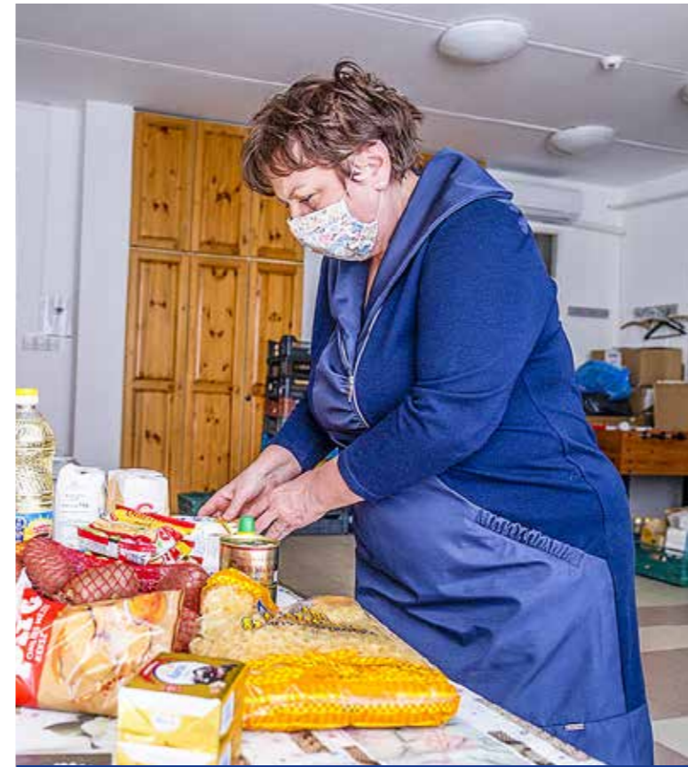
Élelmiszercsomagokkal is segítenek

Sok család mindennapjain segítenek a Kiscesti Szociális Szolgáltató Centrum munkatársai a koronavírus miatt kialakult veszélyhelyzetben. A nehéz anyagi körülmények között élőknek a Kiscesti Rászorultak Megsegítésére Közalapítvány is igyekszik segítséget nyújtani.