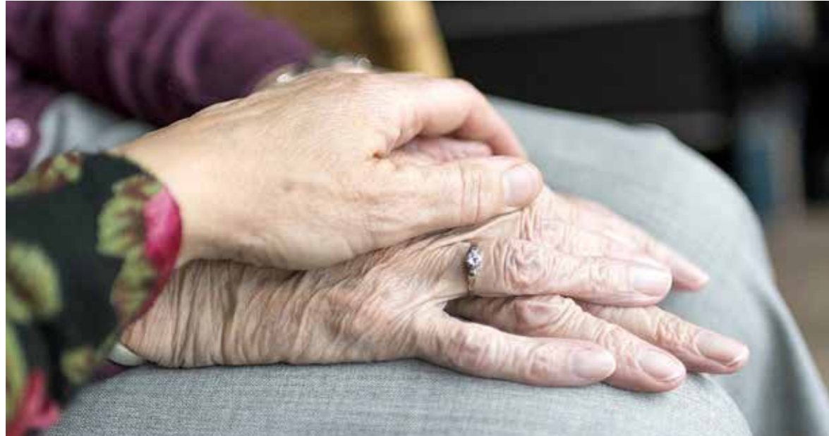
Létfenntartást veszélyeztető helyzetben igényelhető a támogatás

Rendkívüli települési támogatást igényelhetnek az önkormányzatnál azok a kiscestiek, akik a létfenntartásukat közvetlenül veszélyeztető, rendkívüli élethelyzetbe kerültek, vagy időszakosan és tartósan létfenntartási gondokkal küzdenek.