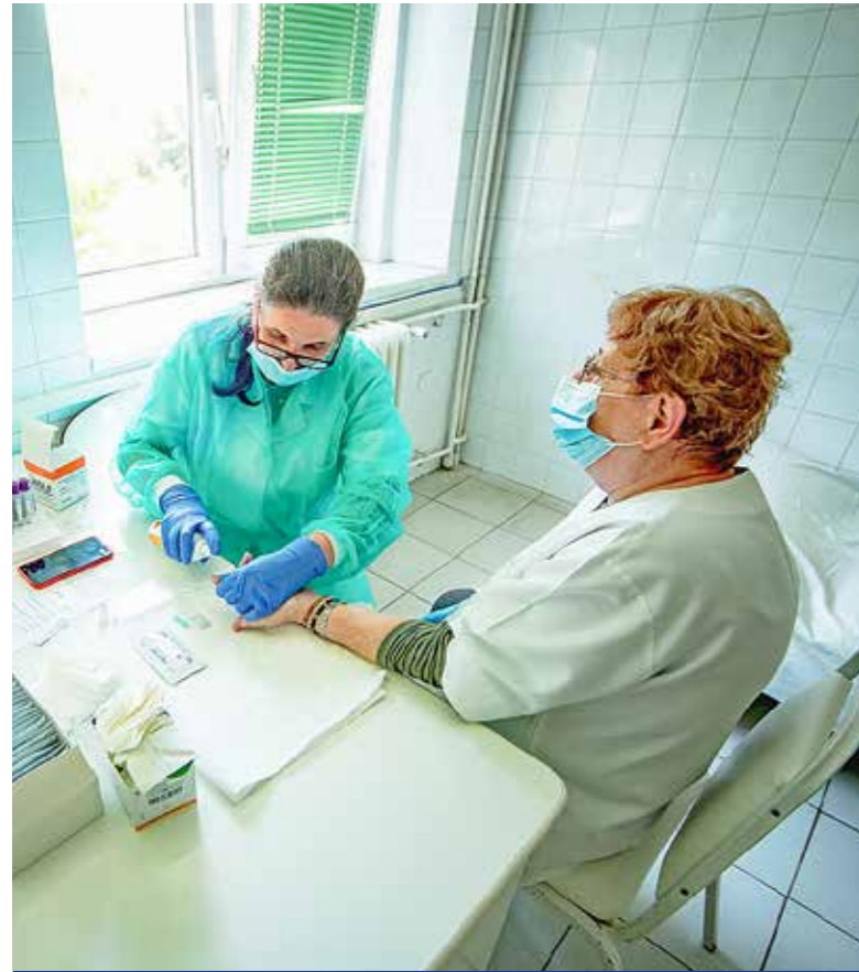
Gyorsteszt az Egészségügyi Intézetben

A kispesztiek és az egészségügyi dolgozók védelmében megkezdtek a Kispesti Egészségügyi Intézet munkatársainak, orvosainak vírusszűrését. Az elkövetkező időszakban 231 szűrést végeznek majd.