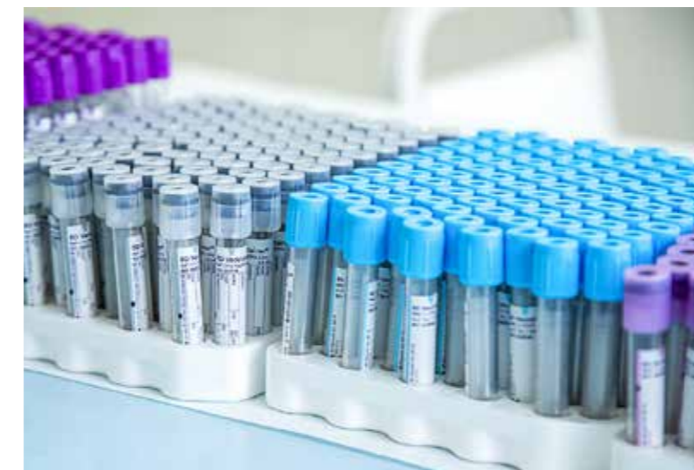
Előjegyzésre működik a labor

hozott és alkalmazott döntések mellett az önk példászerű fegyelmettségének, mégsem mondható el, hogy eltávozott volna a koronavírus. Nagyon is jelen van, és ha lankadni hagyjuk eddigi éberségünket, emelkedő fertőzöttség mutatókkal fogunk találkozni akár még a reményt keltő nyári hónapokban is. Az őszi második hullámhoz pedig – mint tudjuk – kétség nem férhet. Éppen ezért javaslom a már rutinná vált fokozott járványügyi óvó-védő rendszabályok – arcmaszke viselése a nyilvános helyeken, másfél-két méteres védőtávolság betartása, tömeghelyek lehető elkerülése, kézhigiéncia – folyamatos követését az előtűnk álló hónapokban is. Kérem, hogy minden orvos-beteg találkozást telefonos konzultáció és időpont-egyeztetés előzőn meg!”