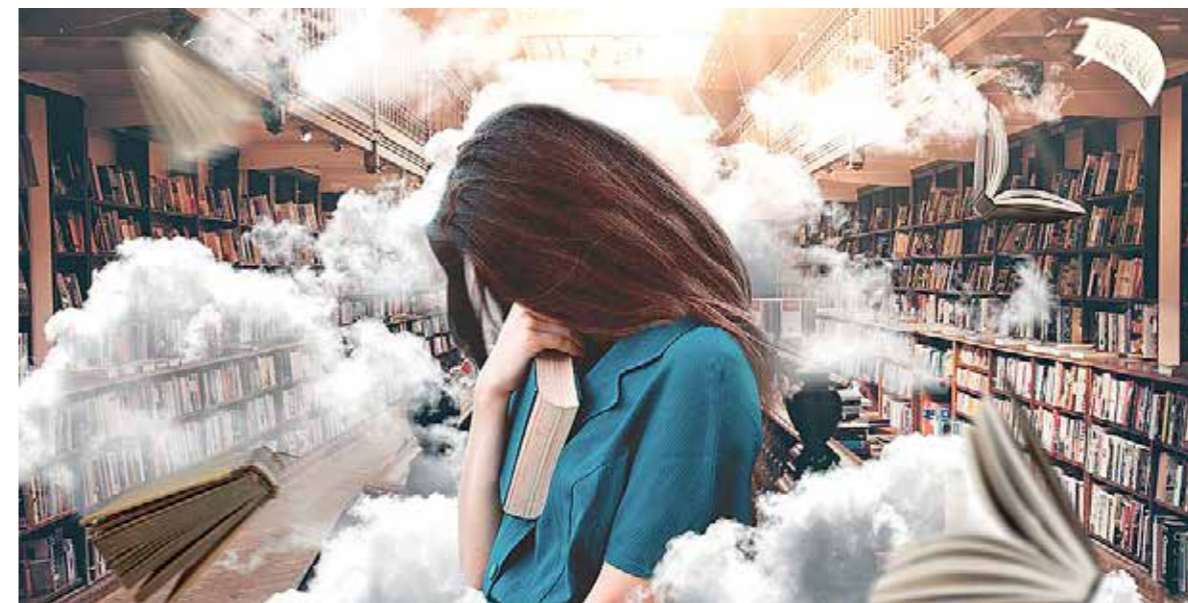
Hiába tiltakoztak egyértelműen és egyhangúlag az érintettek

Munkaviszonyra alakul a kulturális ágazat dolgozóinak közalkalmazotti jogviszonya, miután az Országgyűlés elfogadta az erről szóló törvénymódosítást. A közalkalmazottak jogállásáról szóló törvény 1992-es hatályba lépése óta a legnagyobb munkajogi változtatás történt a közgyűjteményi és közművelődési ágazatban.