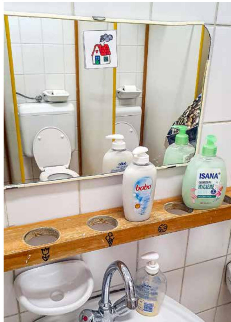
Minden óvodásnak „saját” mosdója és vécéje van

Kispesten az önkormányzat a veszélyhelyzet kihirdetése óta biztosítja az ügyeletet az óvodába és bölcsődebe járó gyerekek részére. Június 2-től valamennyi önkormányzati fenntartású óvoda és bölcsőde nyitva lesz, és – a lapzártakor bejelentett kormánydöntésnek megfelelően – visszatérhet a normális működési rendhez. Az intézményeknek külön igazolás nélkül is fogadniuk kell a gyerekeket, egy intézmény legfeljebb két hétre állhat le nyáron.