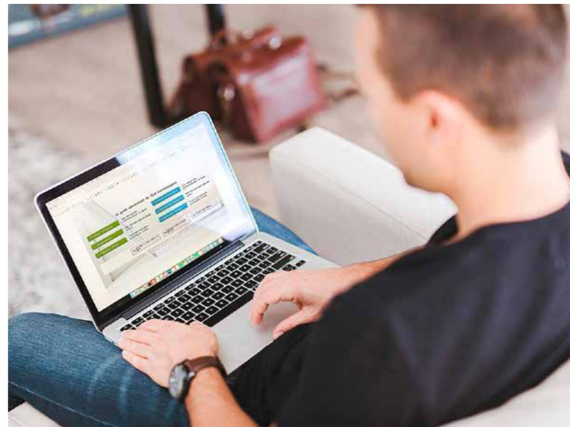
Célszerű elsősorban az online felületeket választani

Határozatlan ideig szünetel a személyes ügyfélfogadás a kispesti Polgármesteri Hivatalban. Továbbra is csak előzetes időpontfoglalással érkező ügyfeleket fogadnak a fővárosi kormányablakok, okmányirodák és minden egyéb kormányhivatali ügyfélszolgálat.