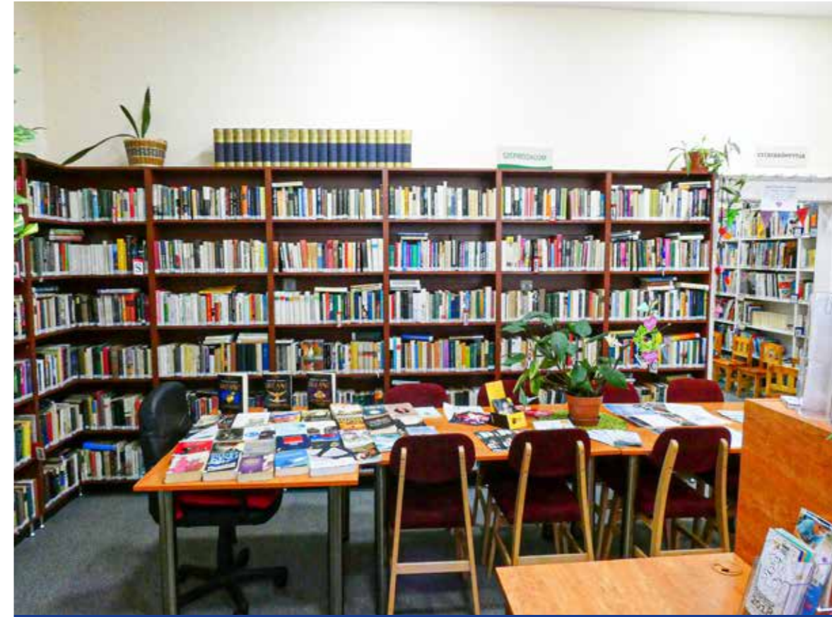
Új könyveket vásárolnak a támogatásból

Több mint 350 ezer forint támogatást nyert az önkormányzat a Wekerlei Kultúrházhoz tartozó könyvtár működésére.