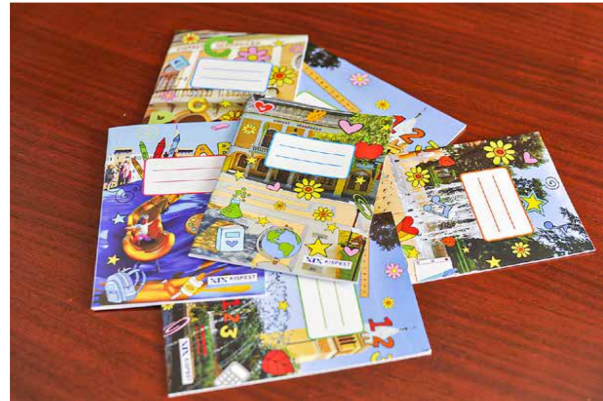
Jellegzetes kispesti motívumok és helyszínek láthatók a borítókon

A veszélyhelyzet alatt is ingyenes füzetcsomaggal támogatja a kispesti családok zökkenőmentes tanévkezdését az önkormányzat.