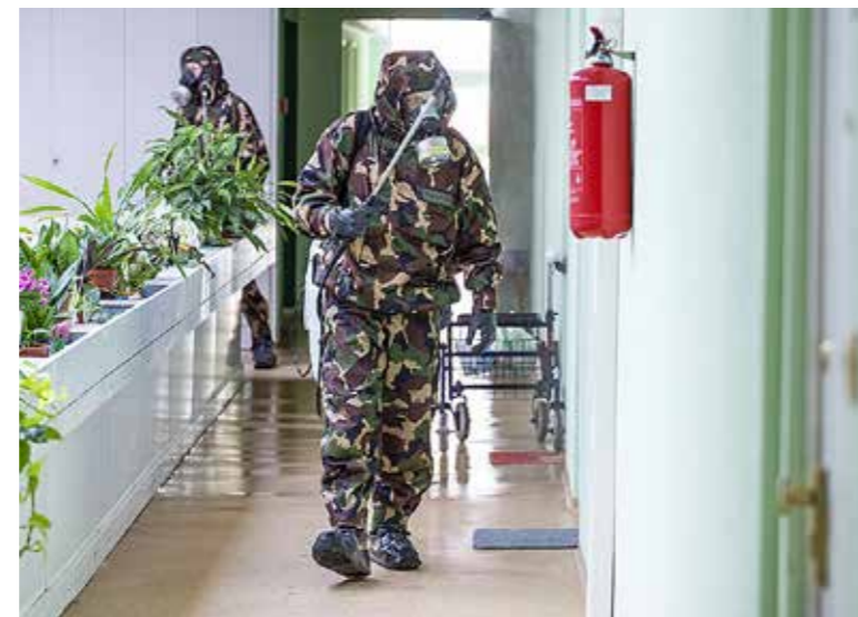
Katonai fertőtlenítés a Nyugdíjasházban

figyelmezetten viselték az elmúlt időszakot, a városvezetés pedig mindig jól reagált a vírus országos mozgására, időben hozott korlátozó intézkedéseket. A szigorú járványügyi előírások nyáron is érvényben maradnak az intézetben. A Segítő Kéz Kispesti Gondozó Szolgálatnál 30 munkavállalónál és 11 ellátott nyugdíjasnál végeztek gyors tesztet, az eredmény minden esetben negatív volt. Ezen kívül összesen 53 szűrést végeztek a Magyar Vöröskereszt Budapest Fővárosi Szervezet Nappali Szociális Központ 2. számú Telephelyén Kispesztben, az Ady Endre úton. A szűrés során, amelyet a Fővárosi Önkormányzat finanszírozott, 19 darab PCR-tesztet és 34 gyors tesztet végeztek. A tesztelés során az intézmény négy munkatársát is szűrték. A PCR-tesztet azoknál a hajléktalanoknál végezték el, akik éjjeli menedékhelyen töltik éjszakáikat. Öt esetben kellett megismételni a tesztet hibás mintavétel miatt, de a későbbiekben ezeknek az eredménye is negatív lett.