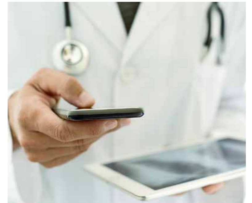
Továbbra is elsődleges a telefonvizit

előjegyzésre működik, a szigorú járványügyi szabályok betartása mellett. A nyitás második fázisában – személyi okok miatt csak csekély óraszámban – elindul a szemészeti rendelés, mivel sikerült egy speciális védőfelszerelést biztosítani a vizsgáló számára. „Ennél szélesebb körben jelenleg nem áll módunkban a rendeléseket megindítani, részben, mert nem mindenki vállalja a 65 év feletti korcsoportból