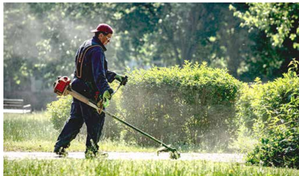
Nyitás előtt az összes játszótérre rendbe tették