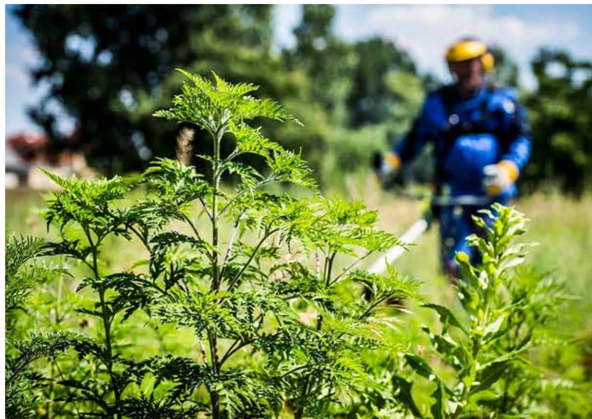
Virágzás előtt szükséges elvégezni a gyomlálást, kaszálást

Az egészséghez való alapjog és az egészséges környezet biztosítása érdekében közös célunk, hogy a pollenallergiát okozó gyomnövények, így többek között a parlagfű elszaporodását és terjedését megakadályozzuk.