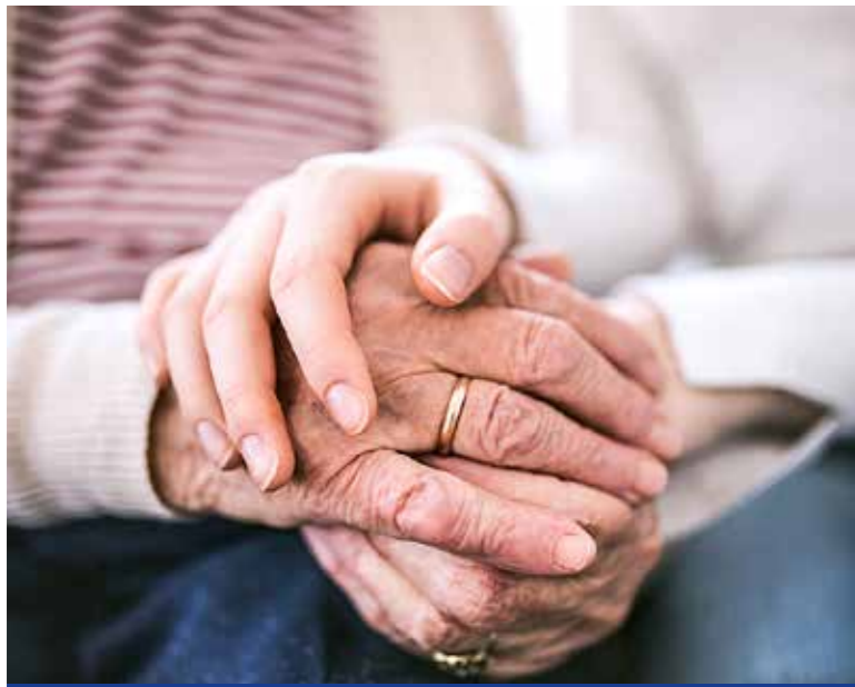
Többféle települési támogatás igényelhető

A létfenntartási gondokkal küzdő kiscestiek rendkívüli települési támogatást és lakásrezezi-támogatást igényelhetnek. Sok család mindennapjain segítenek a Kiscesti Szociális Szolgáltató Centrum munkatársai, a nehéz anyagi körülmények között élőknek a Kiscesti Rászorultak Megsegítésére Közalapítvány is igyekszik segítséget nyújtani. A munkájukat elveszítők a Nemzeti Foglalkoztatási Szolgáltatásnál igényelhetnek álláskeresési járadékot.