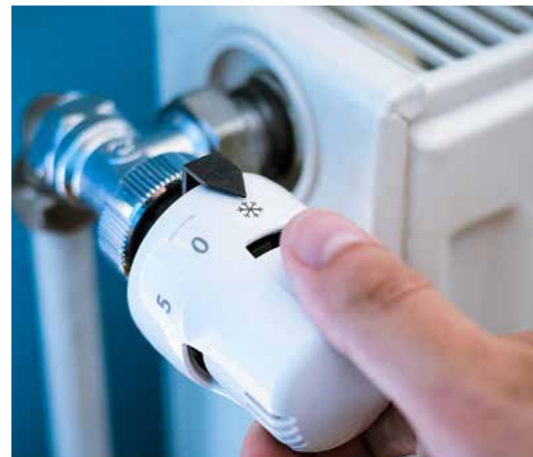
Idén újra bevezették a lakásrezezi-támogatást

ból bevezette a lakásrezezi-támogatást, amelyet a havi közüzemi számlákban írnak jóvá 12 hónapig. A jogosultak köre meg-egyezik a védendő fogyasztói státuszra jogosultak körével. A jogosultság feltétele a védendő gáz- vagy áramfogyasztói nyilvántartásba vétel vagy annak kezdeményezése. A támogatás a távfűtési fogyasztók esetében a távfűtési, egyéb esetben a víz-, csatorna- és szemétszállítási díjat csökkenti havi 2000 forinttal. A nem távhófogyasztók esetében a díjkompenzáció 2000 forintos összege a következőképpen áll össze: a vízdíj és a csatornadíj 750-750 forinttal, a szemétdíj 500 forinttal csökken. A támogatásra egy lakásban egy ember jogosult. A jogosultság megállapítását, a támogatás folyósítását a HÁLÓZAT – A Díjfizetőkért és Díjhátralékosokért Alapítvány végzi a Díjbeszedő Holding Zrt.-vel együttműködve. Nyomtatványok letölthetők a kiscest.hu honlapról, valamint igényelhetők a Polgármesteri Hivatal Humánszolgáltatási és Szociális Irodáján.