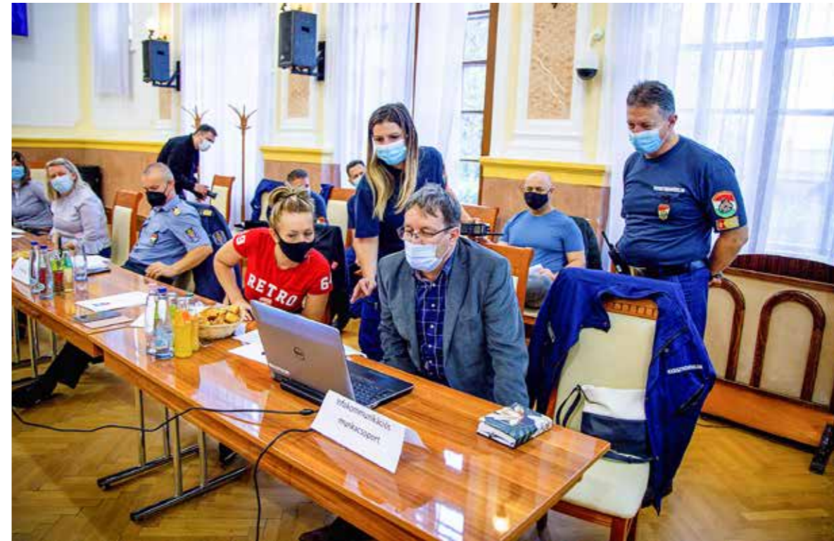
Rendkívül fontos a társszervek munkájának összehangolása

Sikeresen zárult a kispes-ti önkormányzat külső védelmi tervének komplex gyakorlata, amelyen az Illatos úti Vinyl Kft. területén bekövetkezett esetleges vegyi balesetre kellett reagálniuk a szakembereknek.