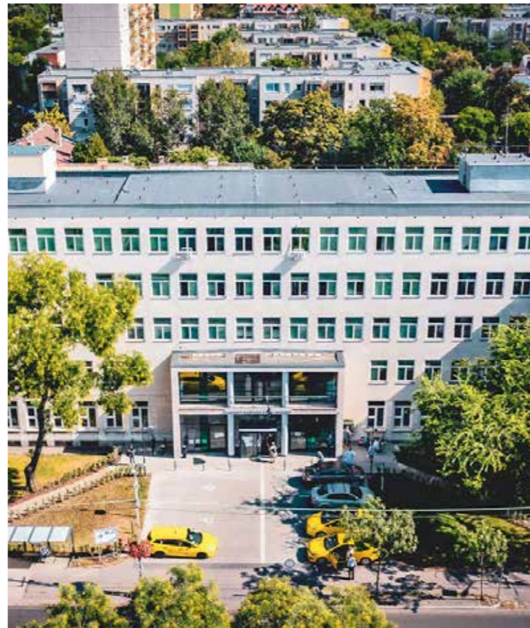
Telefonon vagy e-mailben keressék az Egészségügyi Intézet szakrendeléseit!