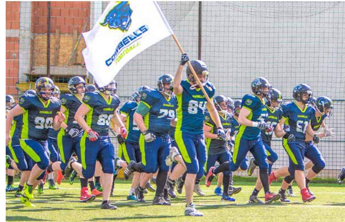
Ezentúl a sportcentrumban tartják az edzéseket és a mérkőzéseket

Hivatalosan is Kispest lett a Budapest Cowbells amerikaifutball-csapat otthona – a következő öt évben biztosan. A szerződés aláírása nagy lépés a sportcsapat történetében és hosszú távú céljainak elérésében.