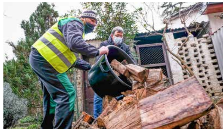
Ilyen módon is próbál segíteni az önkormányzat

Az önkormányzat szociális intézményhálózata minden évben ingyenes téli tüzelő kiosztásával és kiszállításával is próbál segíteni a leginkább rászoruló kispestieknek. A nyílvántartott, rendszeres segélyre, segítségre szoruló, többségében nyugdíjas kispestiek között osztják szét a fát. Idén 40 család, illetve idős magánszemély kap ingyenesen egy-egy köbméter tűzifát és papír hulladékból készített „téglát”, papírpelletet. A mennyiség közel egy hónapra elegendő,