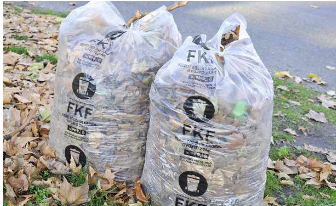
Többféle erre alkalmas zsákban gyűjthető a zöldhulladék

Idén is segíti a helyben élőket Kispest önkormányzata az őszi avar összegyűjtésében és elszállításában. A kertés családi házas övezetben házanként ingyenesen négy darab sárga zsákot osztottak ki az adott körzet képviselői, aktivistái. Wekerletelepen – egészen a Hunyadi utcáig – ezúttal is avargyűjtő ketreceket helyeztek ki.