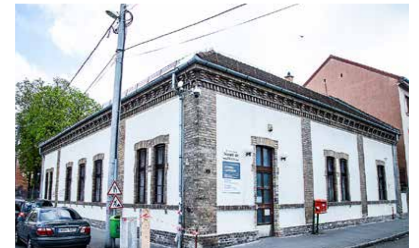
Jellemzően sarki házak falán található