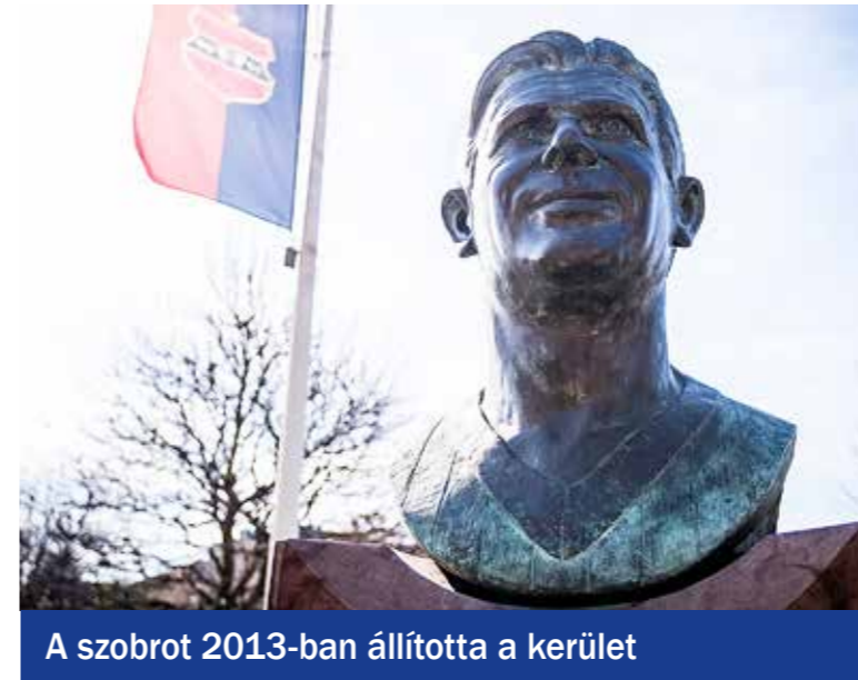
A szobrot 2013-ban állította a kerület

Puskás Ferenc, az Aranycsapat kapitánya, Kispest Díszpolgára 94 éve, 1927. április 1-jén született. A járvány miatt idén is csak szűk körben tartottak születésnapi megemlékezést a legendás Honvéd-labdárúgó KÖKI Terminál előtt álló szobornál.