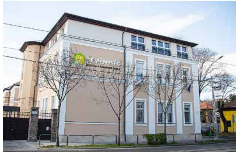
Kispest egyik legszebb épülete lett

Az ütemezett korszerűsítések sorában a nyílászárók cseréjét, a födém és a teljes homlokzat szigetelését végezték el a Reménység iskolán, amely így Kispest egyik legszebb épülete lett.