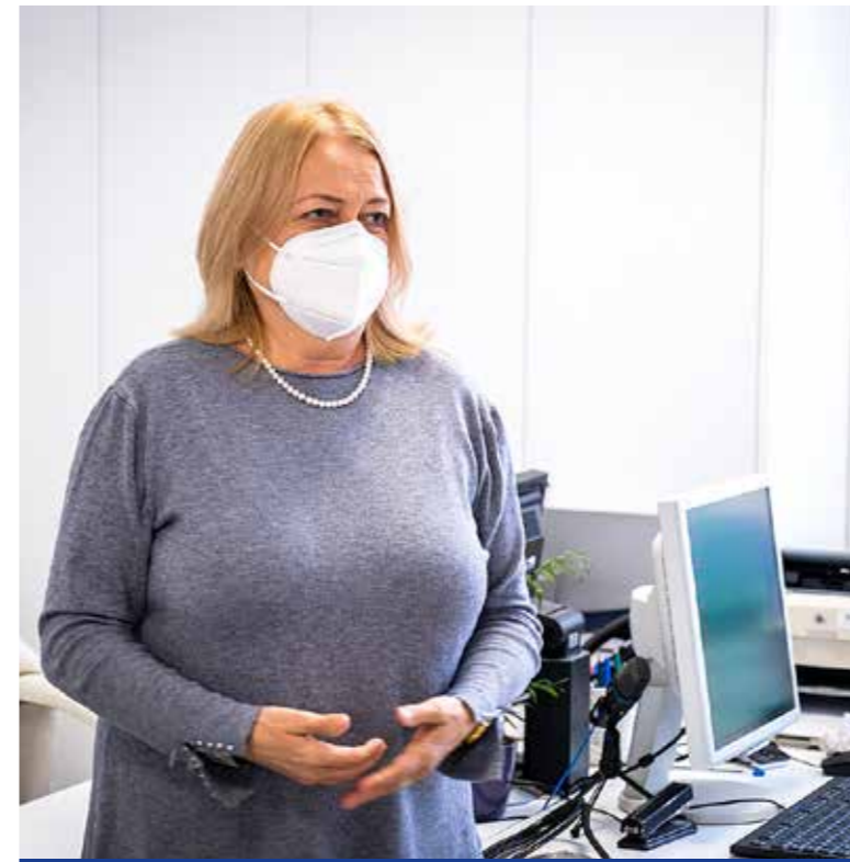
Már öt és félezernél többen kaptak oltást