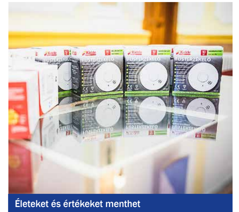
Életeket és értékeket menthet

zeket egy kis odafigyeléssel és egy füstérzékelővel meg lehet előzni. Néhány ezer forint, mégis életet és milliós értékeket menthet meg, ha a mennyezetre felszerelünk egy ilyen készüléket.