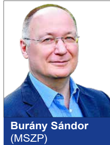
Burány Sándor (MSZP)

toljuk a párommal a bevásárlókocsit, mikor a biztonsági őr halkán megkér bennünket, hogy vigyünk még egy kiskocsarat, mert aszerint számolják, hogy hányan jöhetnek be az élelmiszerboltba. Új szabályok vannak. Igaz, ezek eddig is lehettek volna, de ez van, most jutott a kormány eszébe, ahogy arra is rájöttek, hogyha tovább tartanak nyitva az üzletek, akkor valószínűleg job-