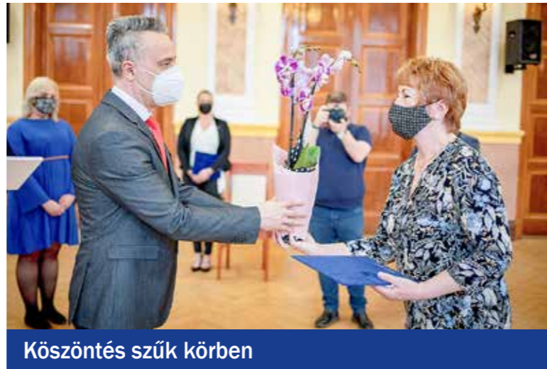
Köszöntés szűk körben

gáinak beilleszkedését, illetve elméleti tudásuk alkalmazását a gyakorlatban. A gyermekek és a családok iránt mutatott türelmes, elfogadó magatartásával és az irántuk tanúsított tisztelettel nagy hatást gyakorol környezetére. Kollégái számítanak véleményére, munkáját elismerés és megbecsülés övezi körükben. Magyarországon 169 éves múltra tekint vissza a bölcsődei ellátás, amely a gyermekjóléti ellátások között a legrégebbi intézményes forma. Az első bölcsődét a Pesti Első Bölcsődei Egylet hozta létre Pesten, 1852. április 21-én, az akkori Kalap u. 1. szám alatti bérházban, ahol 5