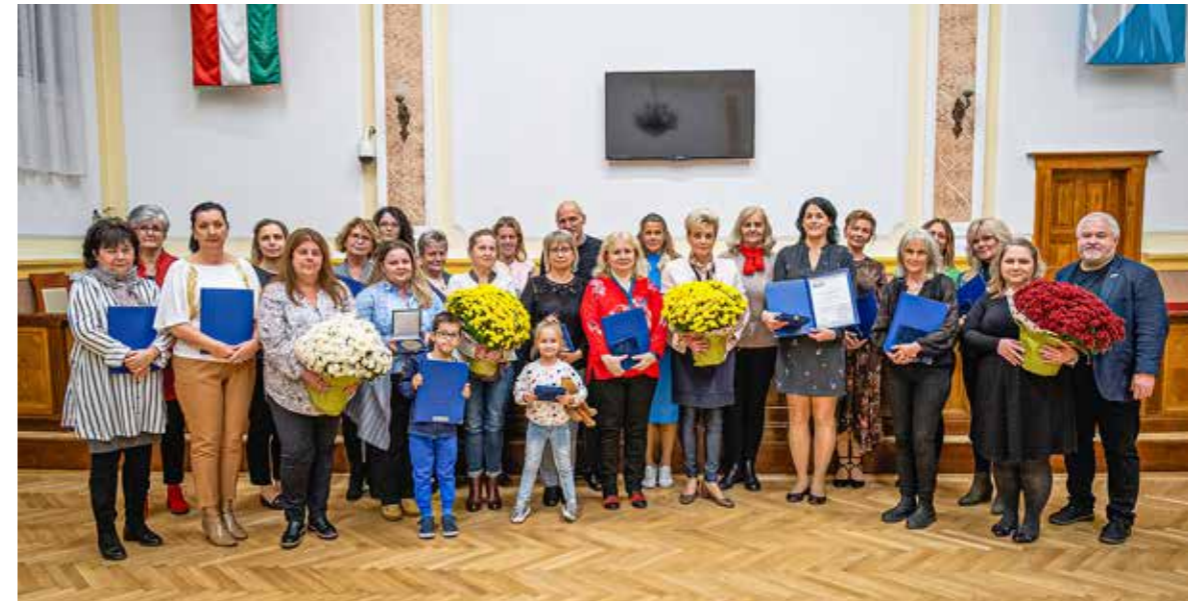
Együtt a környezetszépítők

Kilenc intézmény és két társasházi közösség kapott emlékplakettet, oklevelet és pénzjutalmat a „Szebb Kispesti Környezetünkért” környezetvédelmi pályázat díjátadóján. A díjazottakat a Kispesti Mézeskalács Művészeti Modell Óvoda gyermekei köszöntötték.