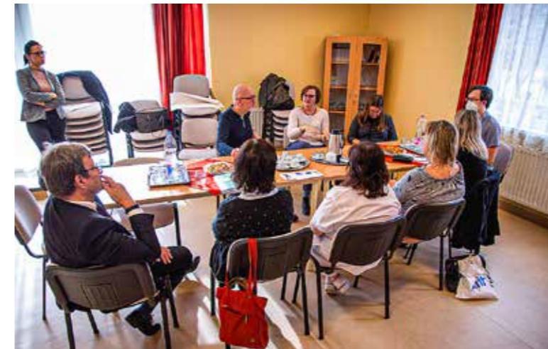
Kezdődhet a tervezés!

Új szakaszába lépett a dán–magyar bölcsődei projekt, amelyet a Villum Alapítvány támogat. Dán javaslatok és helyi elképzelések, kívánságok alapján megkezdődött a Csillagfény bölcsőde kertjének, játszóudvarának átalakítása, elkészültek az első vázlatos tervek.