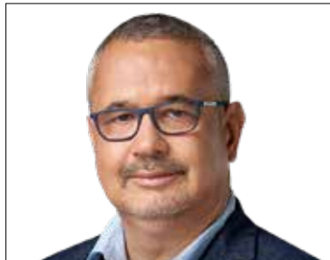
ARATÓ GERGELY országgyűlési képviselő (DK)

Telefonos egyeztetés alapján folyamatosan (06-20-549-2400)