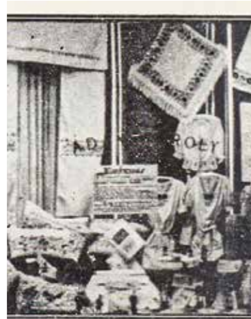
ispesti kunhímzés tanfolyam mű Károly Kigyó-utcai kézimunkaüzletében.

A kézműipar előretörése, a néprajzi minták népszerűsége rengeteg lehetőséget biztosított a lányoknak, asszonyoknak.